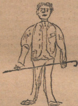
EL APRENDIZ DE CASA.—Por Mercedes Calvente