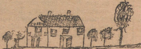
UN CUARTEL.—Por Justita B. (diez años)