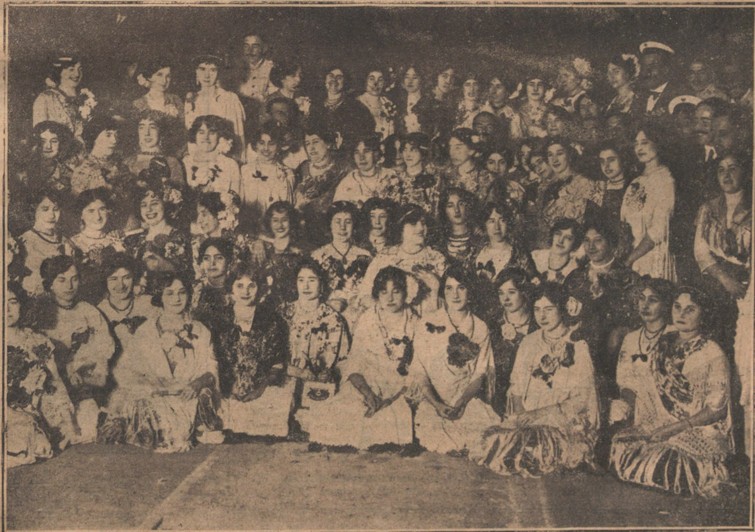
AS FIESTAS DE MELILLA.—Señoritas que han tomado parte en la velada celebrada por la Sociedad de Salvamento de Naufragos, vendiendo obitos a beneficio de dicha Asociación

Arquitecto, de cinco a seis de la tarde. Secretario, de once de la mañana a una de la tarde y de cinco de la misma a ocho de la noche.