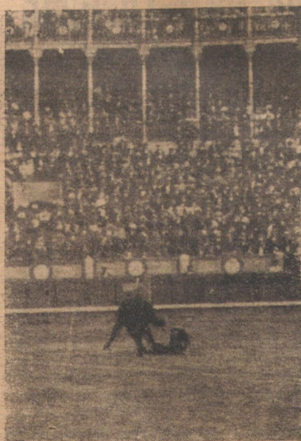
COGIDA DE PACO MADRID en el quinto toro

liente, con un buen pase de rodillas, ceñido y dejándose rozar los alfileres con los pitones; sigue con otro de pecho y otros cambiados y naturales en un palmo de terreno, entrando a matar con los grandes y señalando un buen pinchazo.