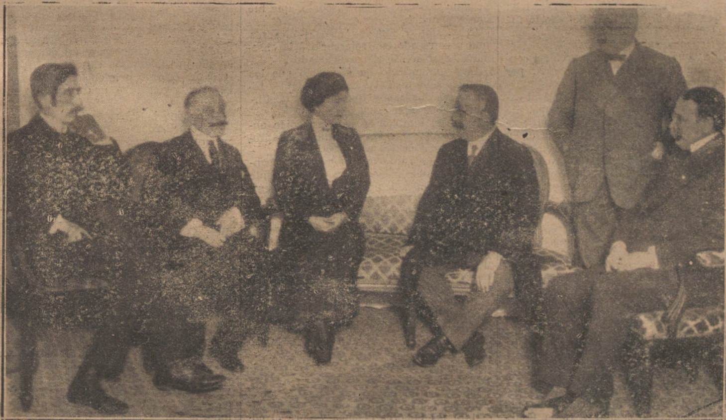
El presidente del Consejo, Sr. Canalejas, durante la visita que le hizo anoche al Sr. Figueroa Alcorta.