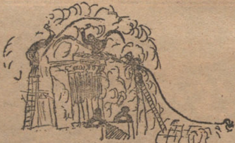
EFFECTOS DE LA OLA DE FUEGO EN EL CONGRESO.—Por Desiderio Sánchez (once años)