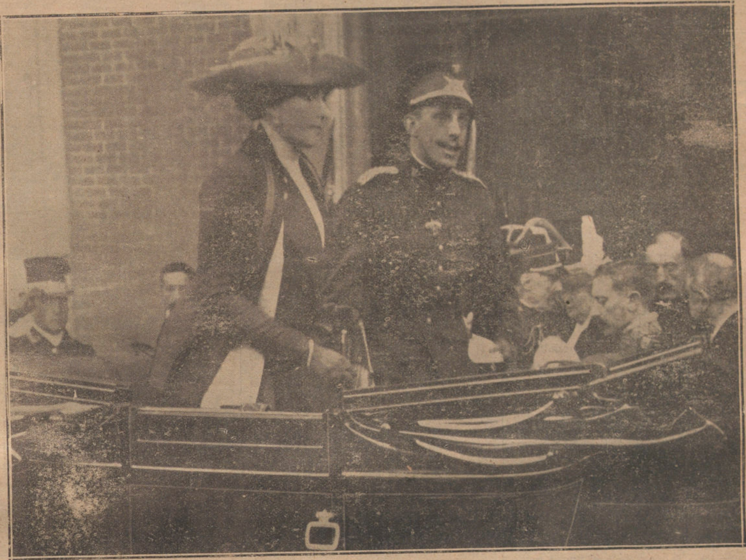
Llegada de los Reyes á la estación del Norte, á su regreso de San Sebastián.

El general López Herrero ha regresado á Nador, después de ultimar con el general Aldave detalles de la inauguración de la escuela indígena de aquel territorio, que se verificará mañana, con gran solemnidad. A dicho acto ha sido invitado el re