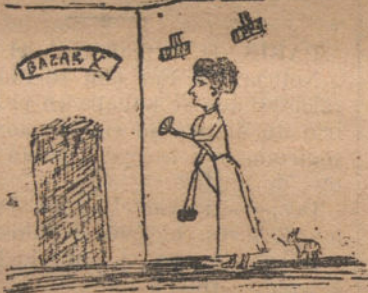
MI TIA, CAMINO DEL BAZAR.—Por Asunción Villalengua (siete años)