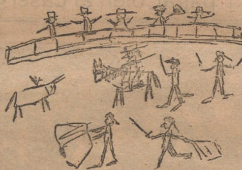
CORRIDA DE TOROS.—Por Marianito Garrasco (cinco años)