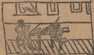
MI HERMANO EN SU CUARTO DE ESTUDIO, por Daniel Vieites.—COMO SE CRIAN LOS POLLOS, por Luis Ceta (siete años).—REGATAS DE BALANDROS, por Maria Cruz Bayton (siete años).—DE MUDANZA, por Félix Foca (seis años).