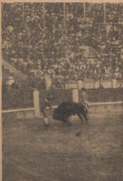
MALLA, matando su primero

Pocos pases más y una estocada entera, tendenciosa, que basta. (Palmas.)