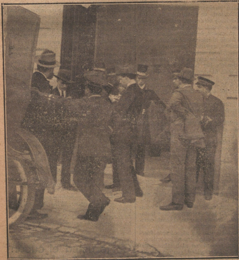
Grupo de periodistas a la puerta del palacio de la Infanta, inquirendo noticias.