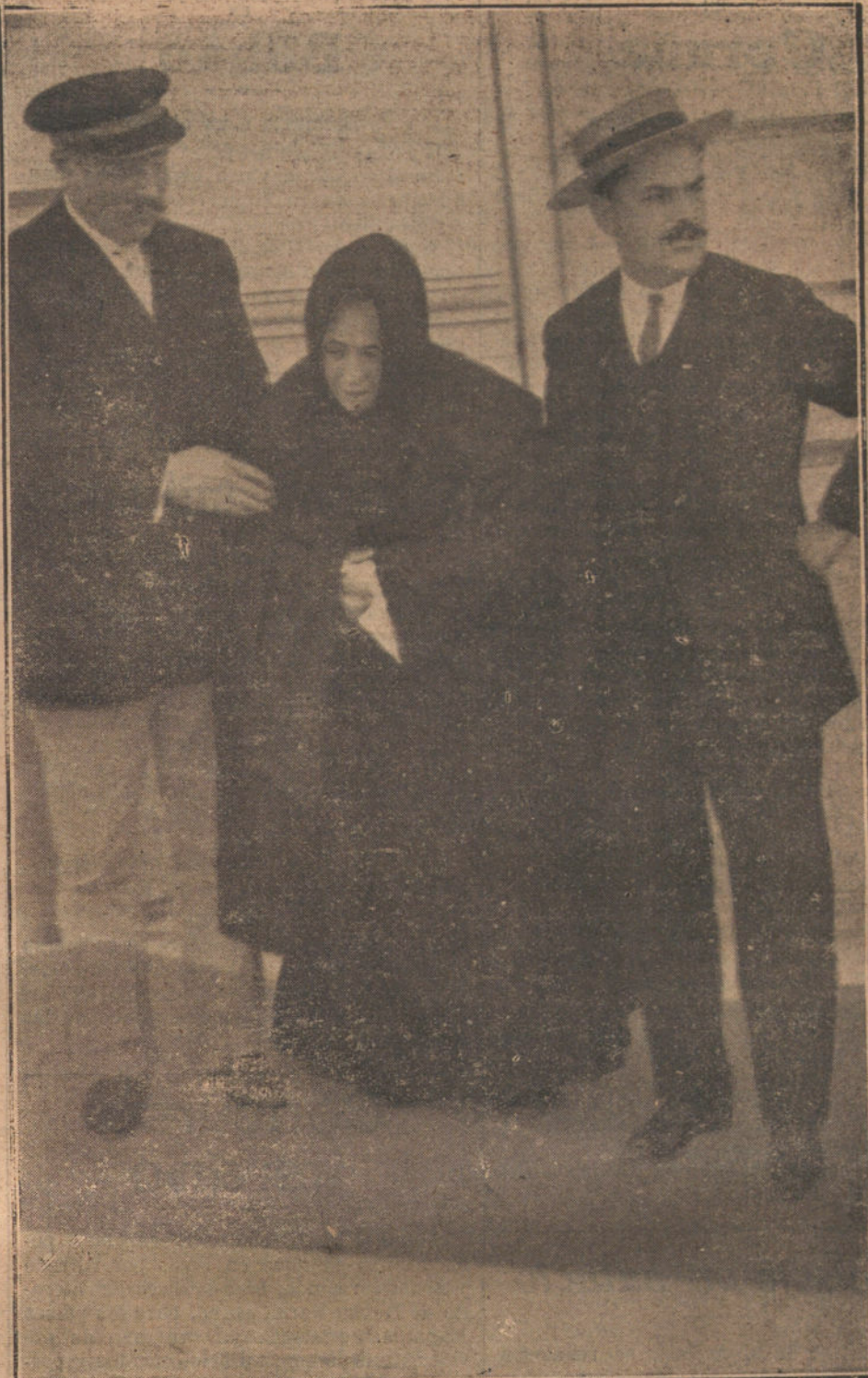
La nodriza de S. A. la Infanta María Teresa, al salir esta mañana del palacio, después del fallecimiento.

El traslado del cadáver desde el palacio de la Cuesta de la Vega a la estación del Norte se verificará mañana martes, a las dos y media de la tarde, para ser condu-