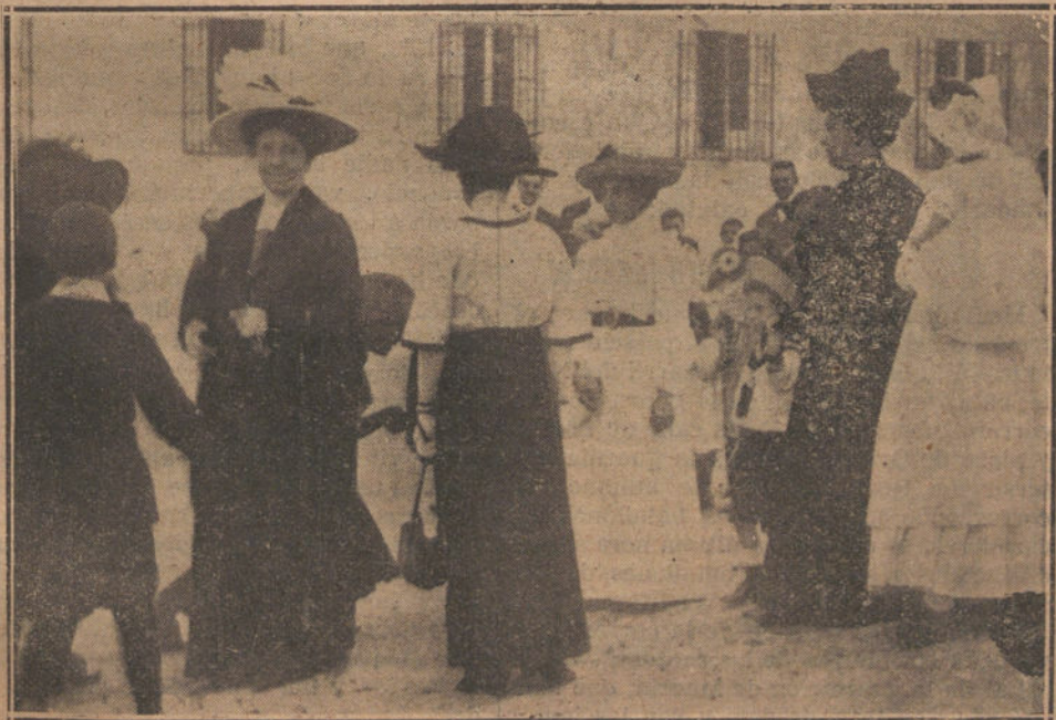
S. A. la Infanta MARIA TERESA, acompañada de sus hijos, paseando por La Granja

El ministro de la Gobernación llegó á su despacho á las doce y media, y pocos