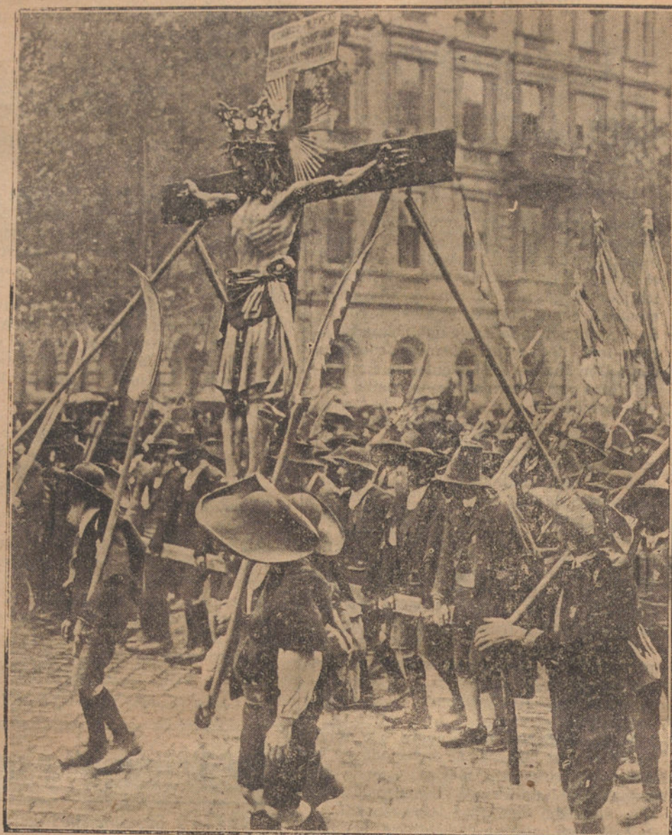
EL CONGRESO EUCARISTICO DE VIENA.—Los aldeanos del TIROL escoltando a su famoso Cristo, en la procesión con que han terminado las sesiones del Congreso.

Este Gaona es aquel que tan bien toreaba de capa?