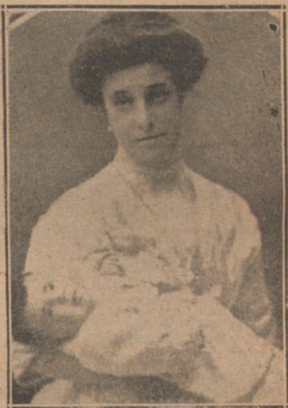
S. A. la Infanta MARIA TERESA, teniendo en brazos á la Infantita Maria de las Mercedes

Aún no terminada la tarea de vestirse, parece que la Infanta, perdiendo en los primeros instantes el equilibrio, fué acometida de un desvanecimiento, alarmando esto extraordinariamente á la citada profesora, que, con la urgencia que el caso requería, aplicó á S. A. un frasco de sales, sin que esto hiciera volver en sí, desgraciadamente, á la Infanta. Después de dar inmediato aviso la profesora al Príncipe D. Luis Fernando, que en aquellos momentos hallábase recibiendo una Comisión del Cuerpo de Sanidad, que había ido á cumplimentarle, luego de transcurrir el aviso con las pre-