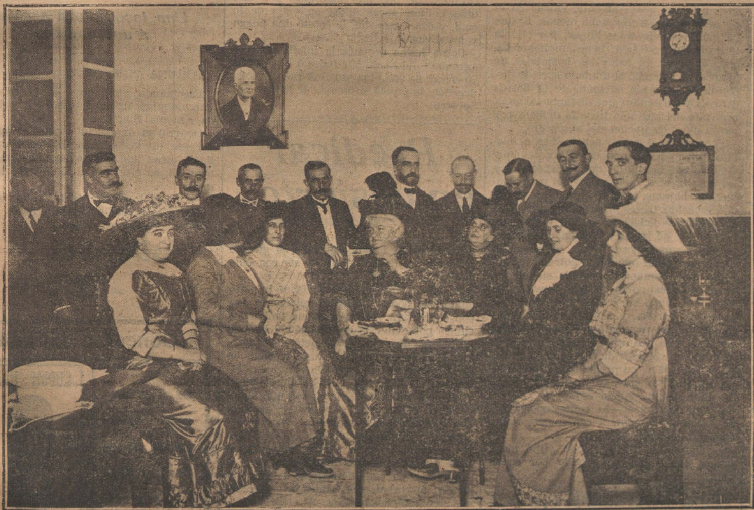
LAS FIESTAS DEL «FARO DE VIGO».—La condesa de Pardo Bazán, su hija, la familia del director del periódico, los redactores y el alcalde, durante el te con que fueron obsequiados en la casa del «Faro de Vigo».

En la Casa del Pueblo, secretaria número 25, donde tiene su domicilio social La Razón del Obrero, Sociedad de sastres, comenzó anoche la votación que ha de decidir si dicha Sociedad ha de ir a la huelga en el próximo mes de Octubre.