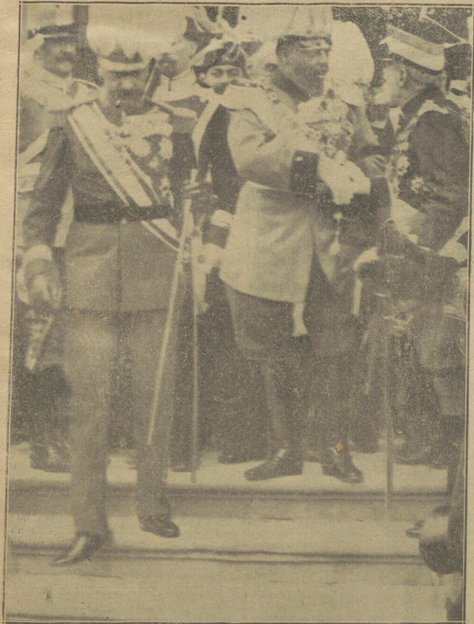
LOS FUNERALES POR LA INFANTA MARIA TERESA.—El fante D. Carlos y D. Luis de Baviera, padre del infante D. Fernando, al salir de San Francisco el Gran de.

Entre los elementos liberales del país estas cifras han provocado grandes manifestaciones de entusiasmo.