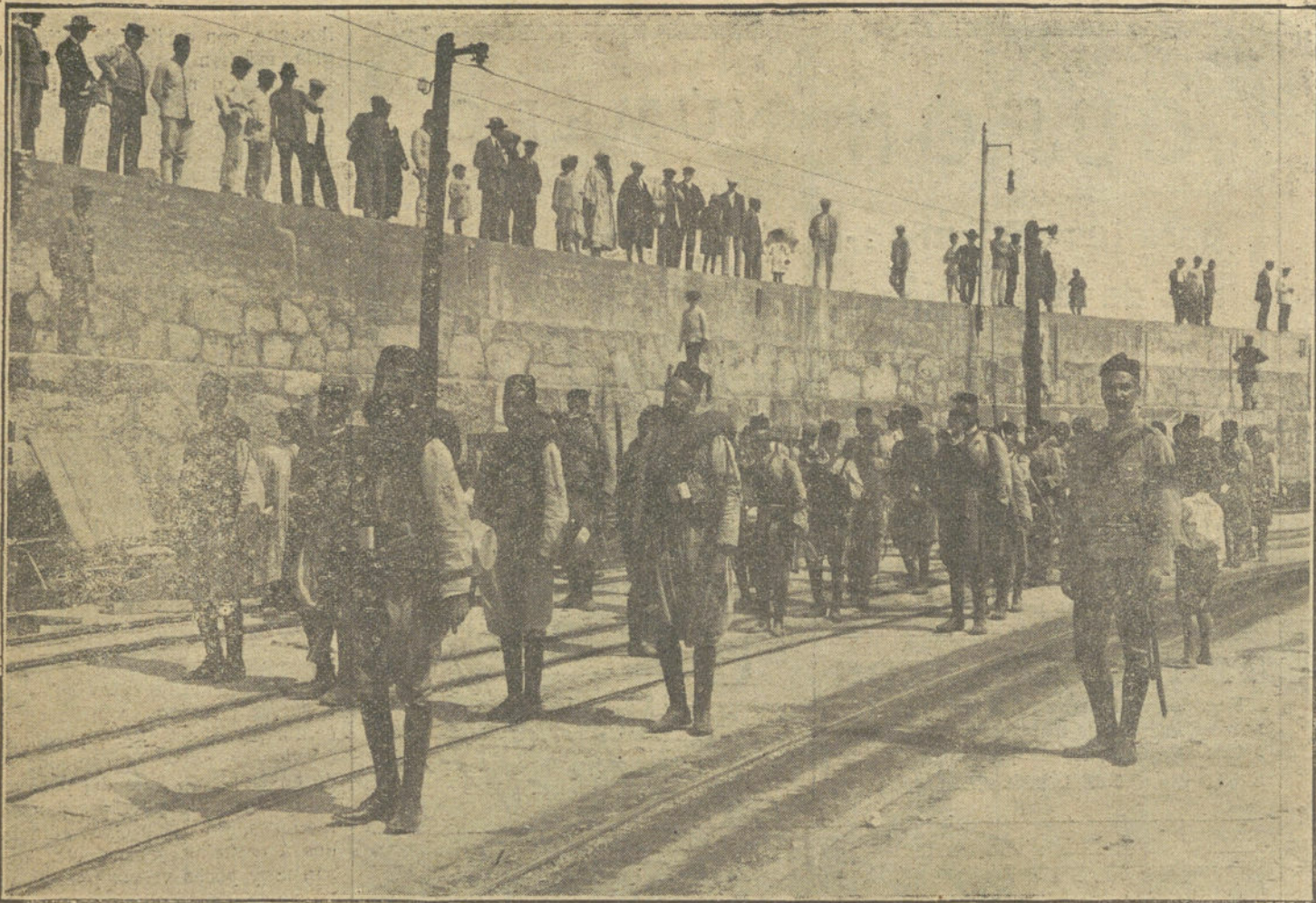
EL CENTENARIO DE LAS CORTES DE CADIZ.—Escuadra de gastadores y banda de músicos árabes de las fuerzas regulares indígenas, que han venido á la Península, con motivo del Centenario de las Cortes de Cádiz.