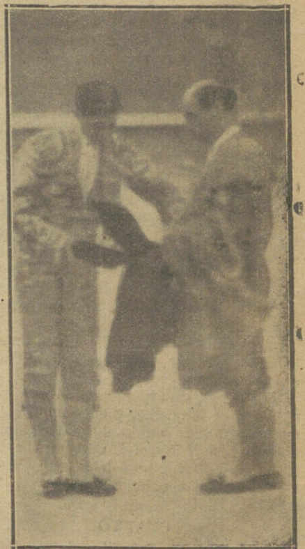
Gallo mayor dando la alternativa a Gallo menor.

Cae al descubierto el Poli, en la primera vara, y antes de que tengan tiempo de le-