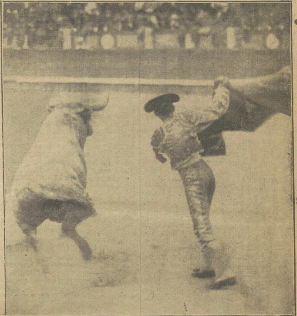
Joselito Gallo toreando de capa al toro de su alternativa.

des solemnidades, que ya saben sus señorías cuáles son: corrida con Gallo y canje de cupones de LA TRIBUNA.