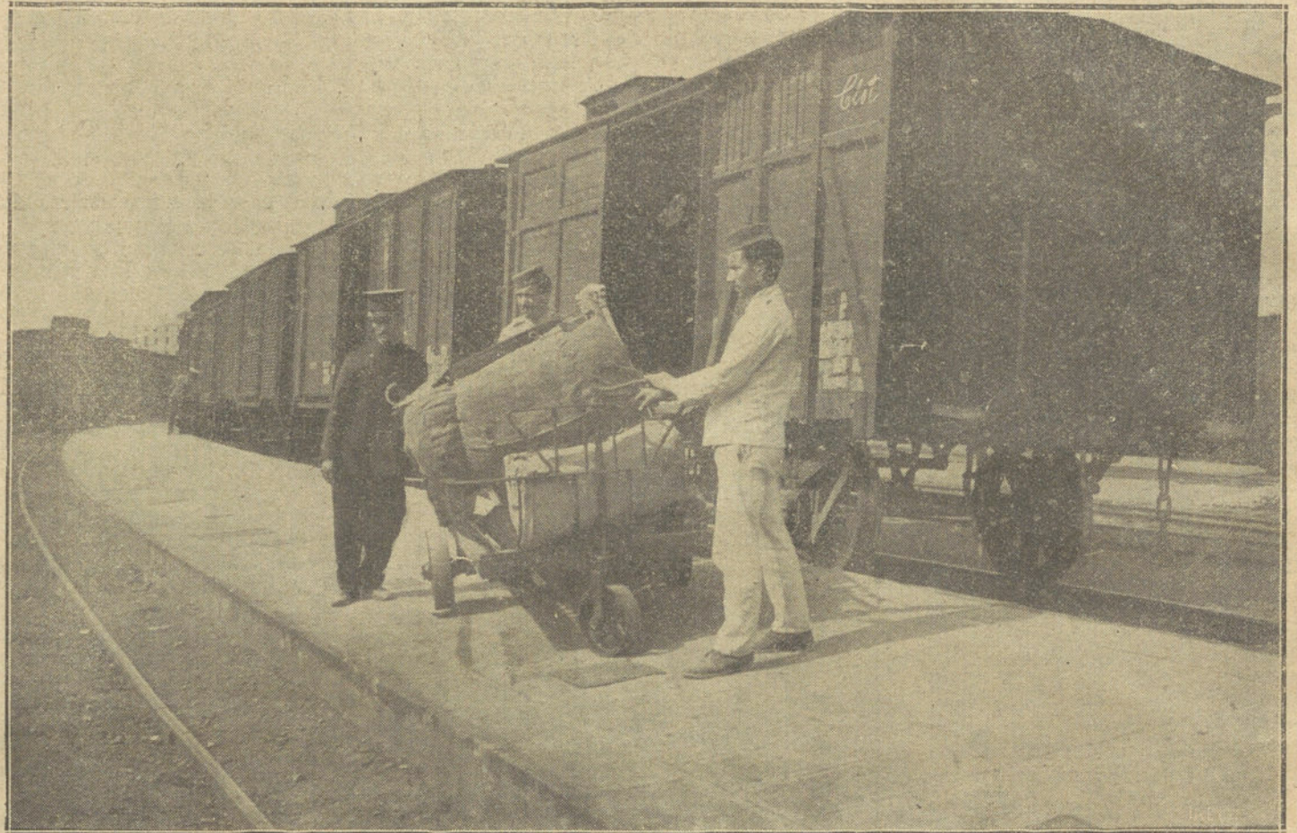
LA HUELGA FERROVIARIA.—Soldados de Ingenieros descargando un vagón

BARCELONA (1,10 madrugada) del 1.º. En vista de las quejas de los fabricantes de Villanueva y Sitjes de que les escasean las primeras materias y tendrán que suspender los trabajos, el gobernador ha