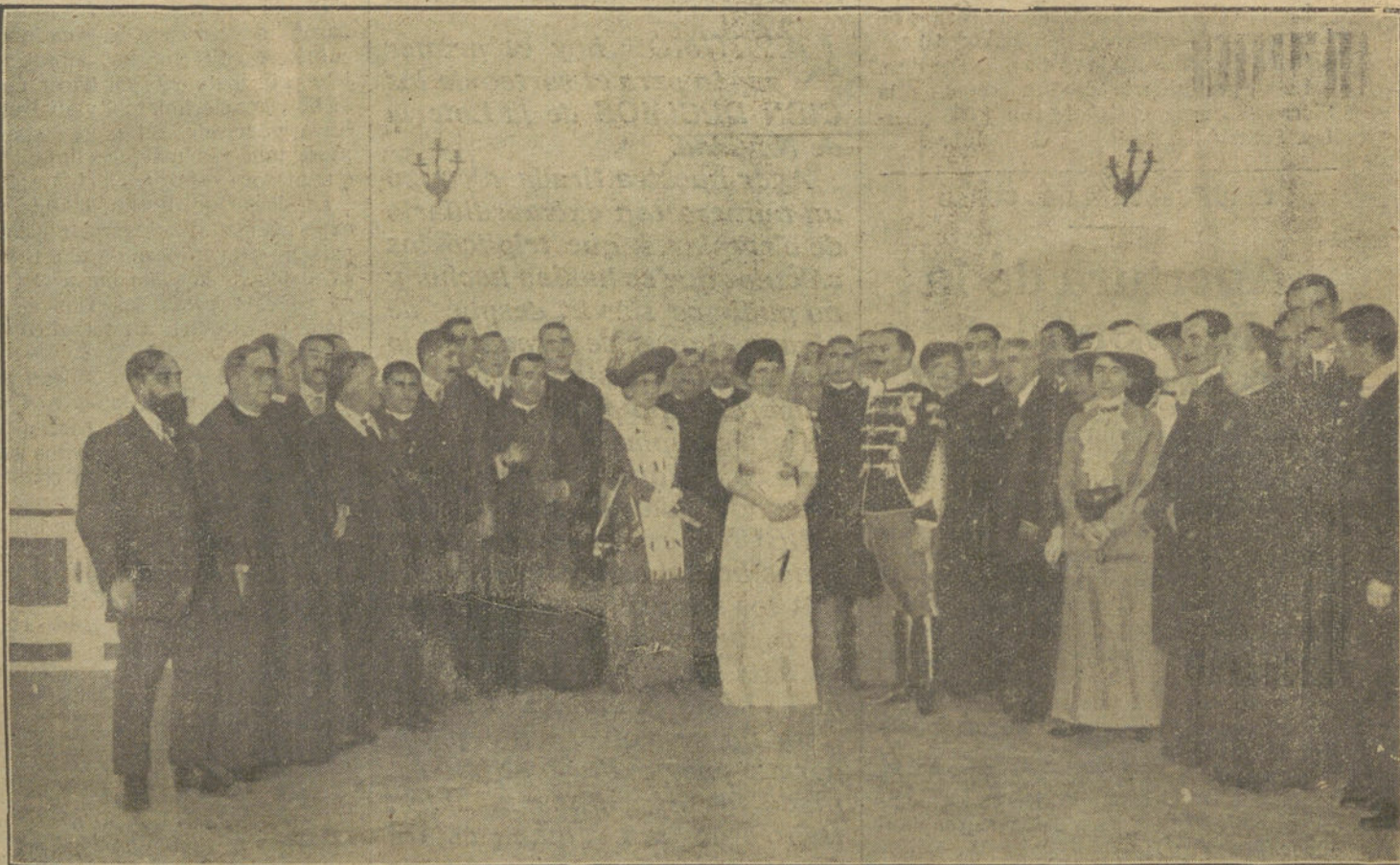
LA FIESTA JAIMISTA DEL PALACIO DE FROHS DORF.—Grupo de españoles, acompañados de doña Blanca y D. Jaime, éste con uniforme de oficial ruso. (Fot. VIDAL. Cliché exclusivo de LA TRIBUNA.)

Accedió á ello el Jurado, resultando vencedor el navarro Ochoa, después de emocionante lucha, que duró quince minutos, adjudicándosele el premio de mil pesetas como vencedor de Roher y de Esson.