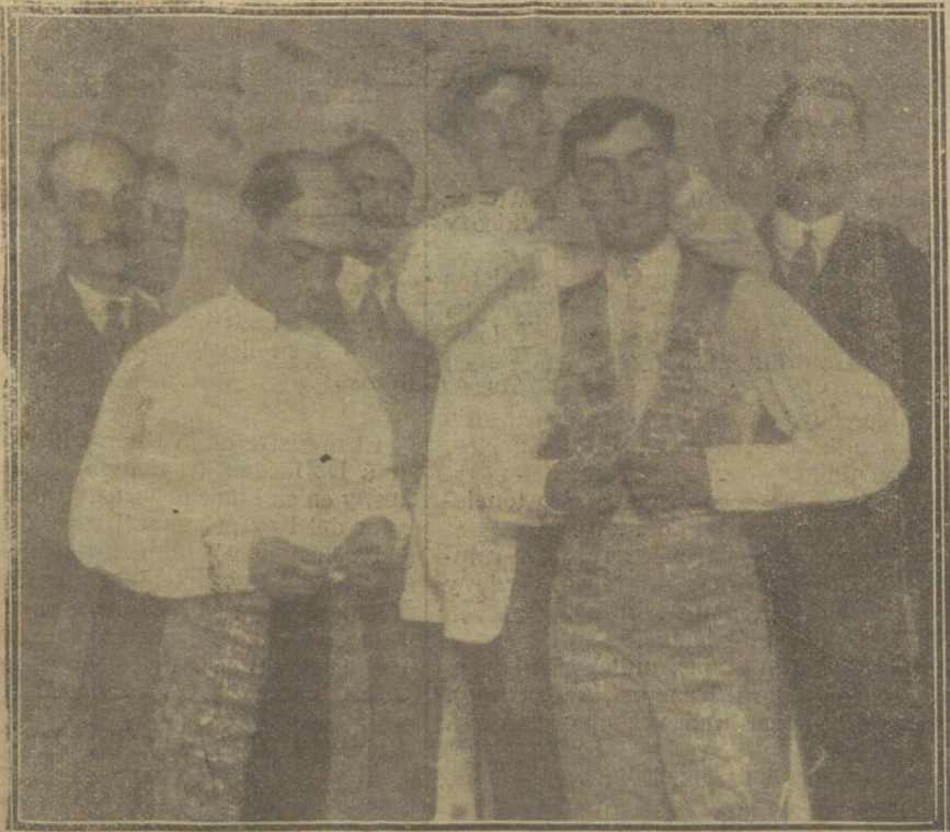
Los dos Gallos desnudándose en el Hotel de Roma, donde se hospedan, al terminar la corrida.