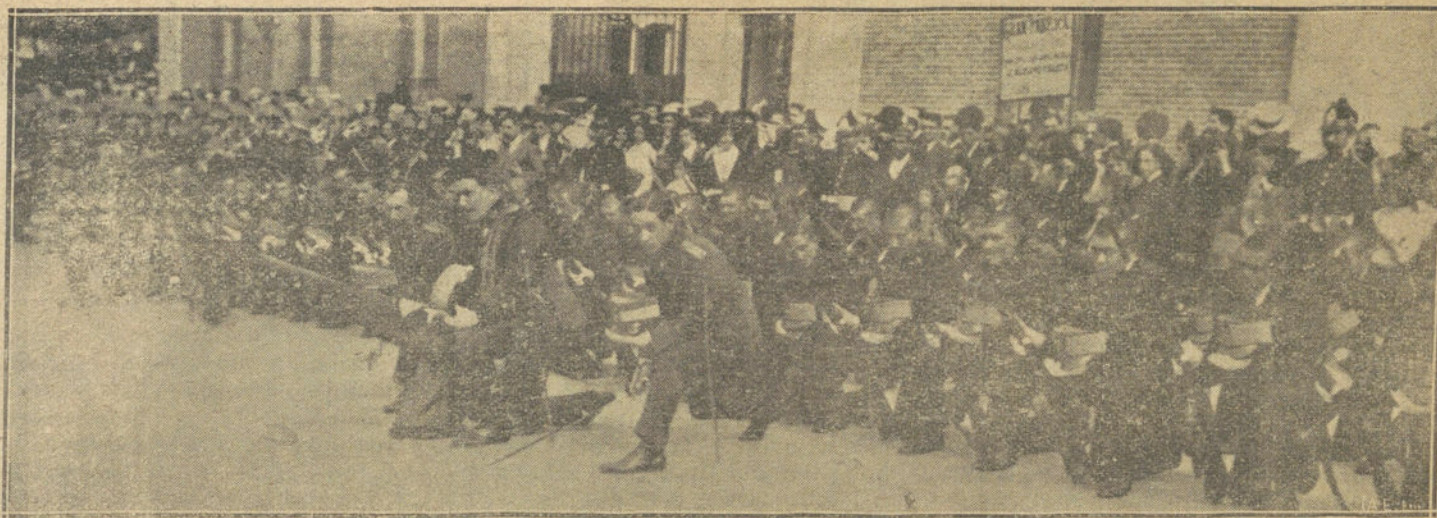
LOS FUNERALES POR LA INFANTA MARIA TERESA.—Las tropas que han asistido á la solemnidad religiosa.

Yo me siento un poco entrenado por esta manía coleccionista de los idiomas. Comprendo que es ridículo, pero no lo puedo evitar. Soy una cosa así como aquel personaje de los Quintero que cuando le dicen, por ejemplo, «calle», exclama: