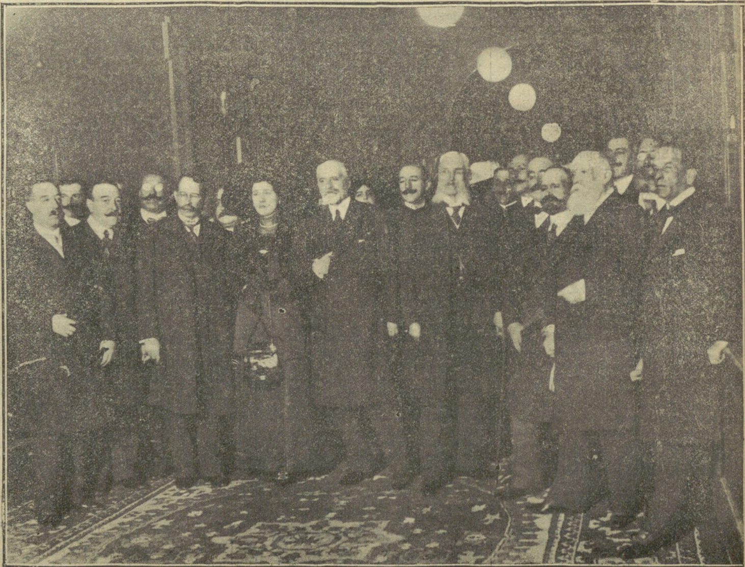
Los enviados especiales de América, después del banquete con que fueron obsequiados ayer tarde en el Senado.

Número del teléfono de LA TRIBUNA: 3.800.