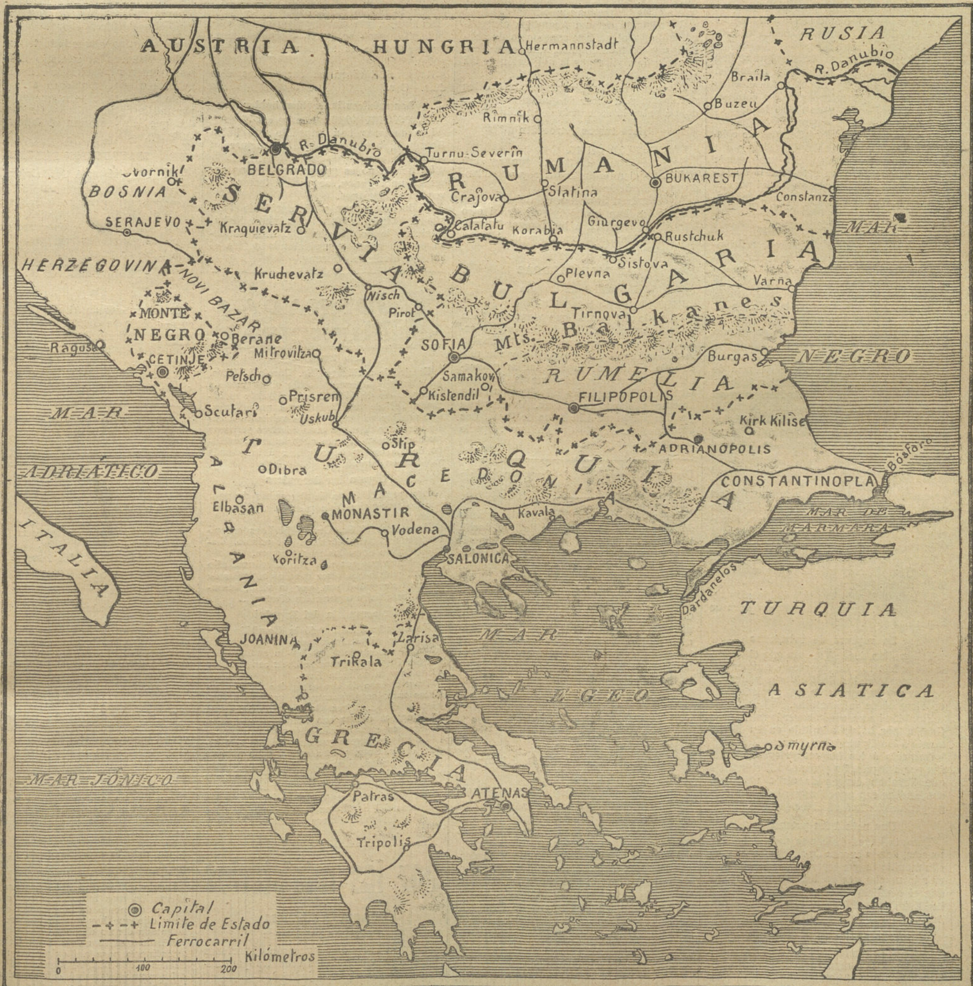
Mapa de la Península de los Balkanes; en cuyos territorios se desarrollarán los incidentes de la guerra entre Turquía y los aliados balcánicos, Bulgaria, Serbia, Grecia y Montenegro.