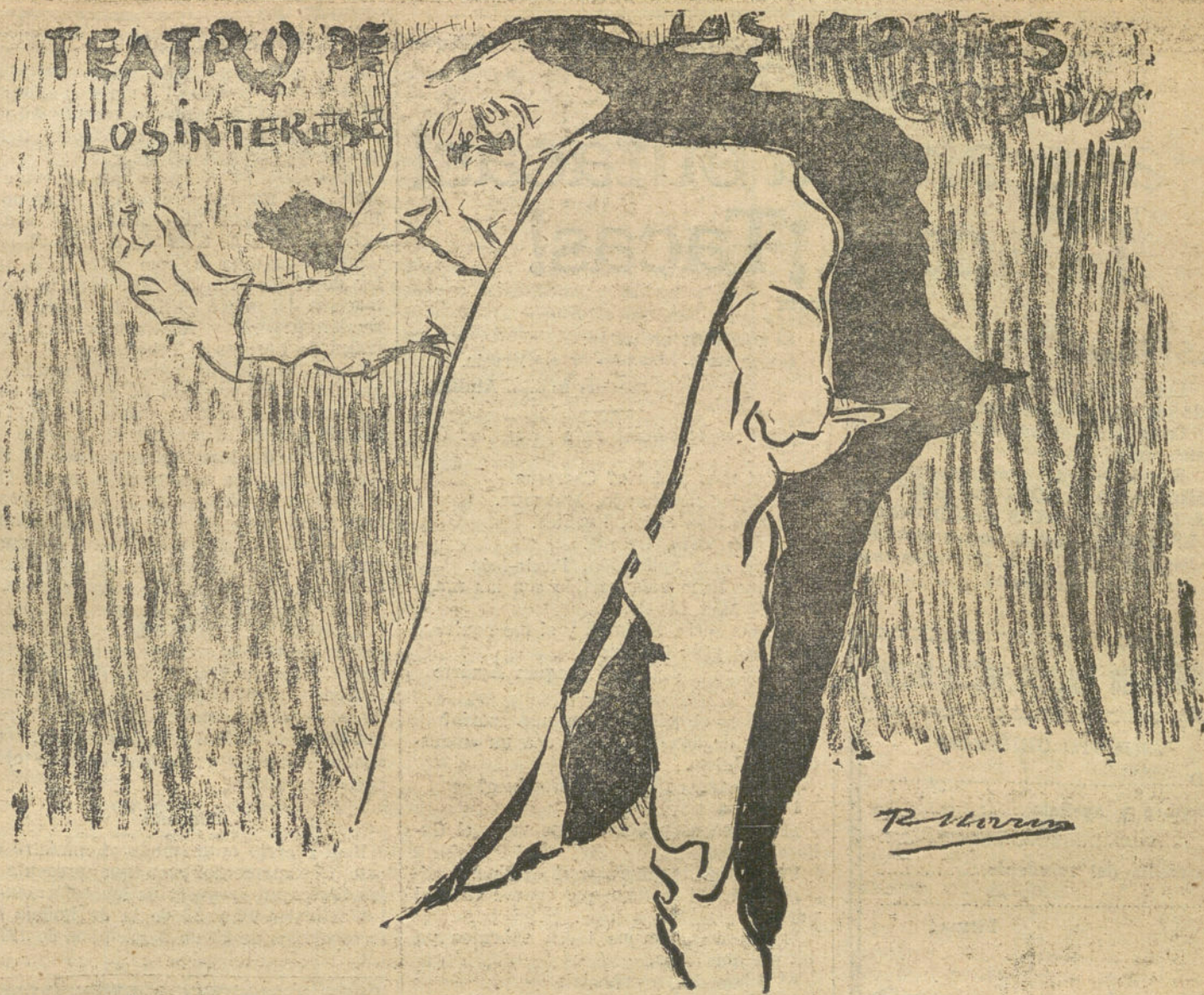
CRISPIN.—La farsa va á empezar! (Caricatura de R. MARIN.)

En la Catedral se han celebrado hoy solemnes funerales por el eterno descanso