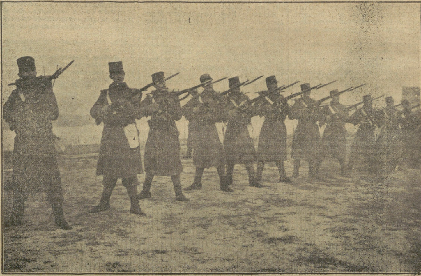
LA GUERRA EN LOS BALKANES.—Infantería del Ejército serbio, primeras tropas que han acudido al teatro de la guerra