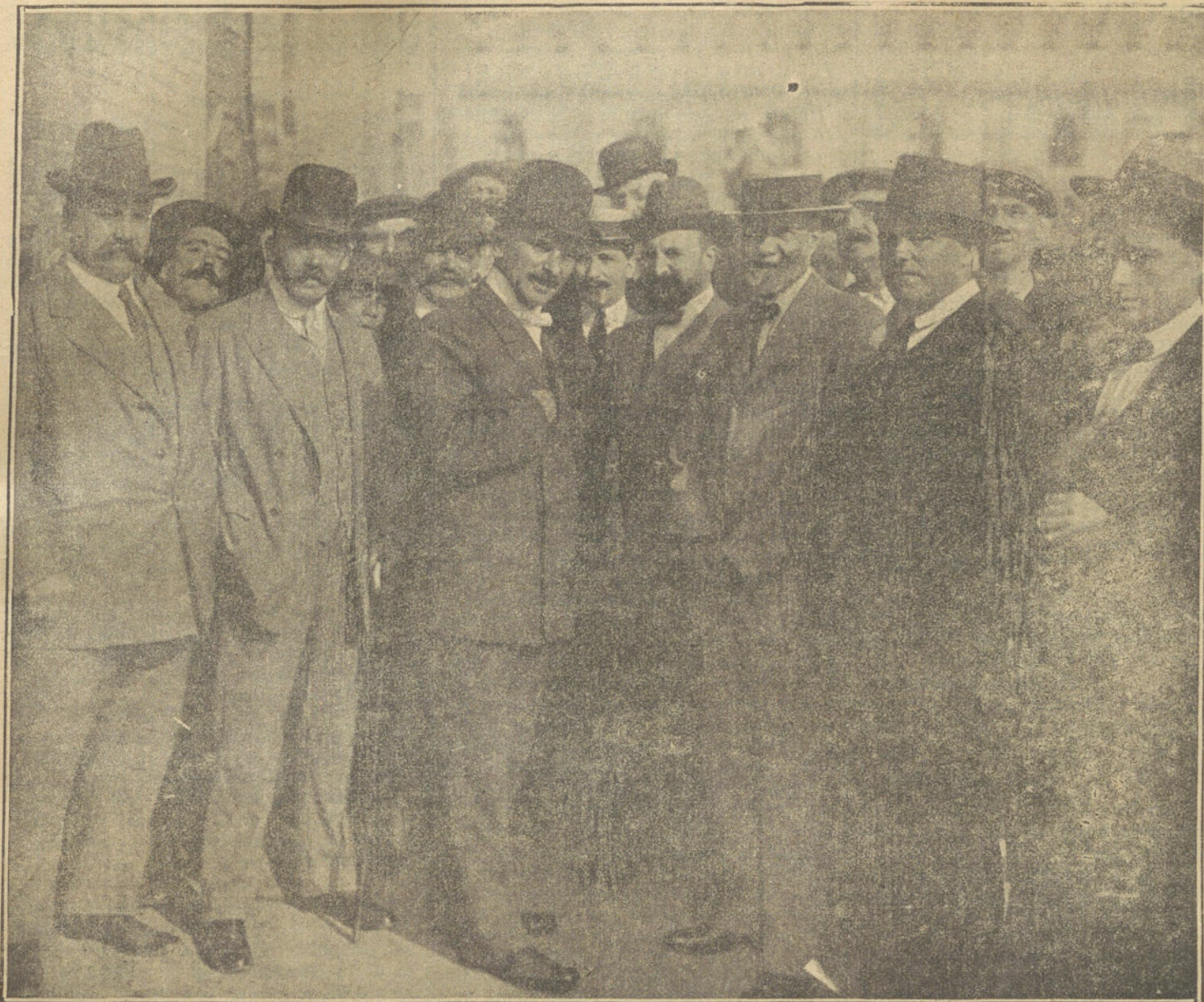
UN MIIN REFORMISTA.—Llegada de D. Melquiades Alvarez á Sevilla, acompañado de sus correligionarios, en cuya capital ha dado un mitin, al que en los círculos políticos se concede gran importancia.

maciones de júbilo de los jugadores. El acaparador de trigo está encantado, porque con la guerra podrá vender más cara su mercancía. ¡Eso se llama entender los negocios! Los fabricantes de balas y de fusiles dan gracias al dios Marte, que ha hecho alianza con Mercurio y viene á salvarlos de la ruina.