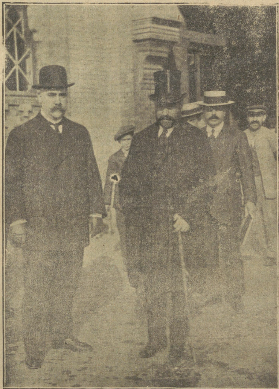
El nuevo gobernador de Sevilla. Sr. Cabrerizo, al salir de la estación á su llegada á aquella capital, acompañado del alcalde.

¿Quién ha dicho que la guerra es un mal? Para negarlo basta oír las exclamaciones.