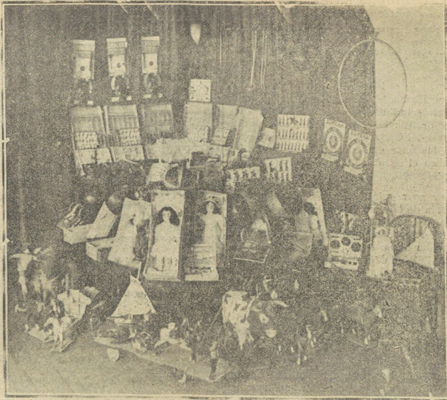
NUESTROS CONCURSOS INFANTILES.—Los 160 magníficos juguetes que han sido sorteados entre los pequeños colaboradores de LA TRIBUNA.