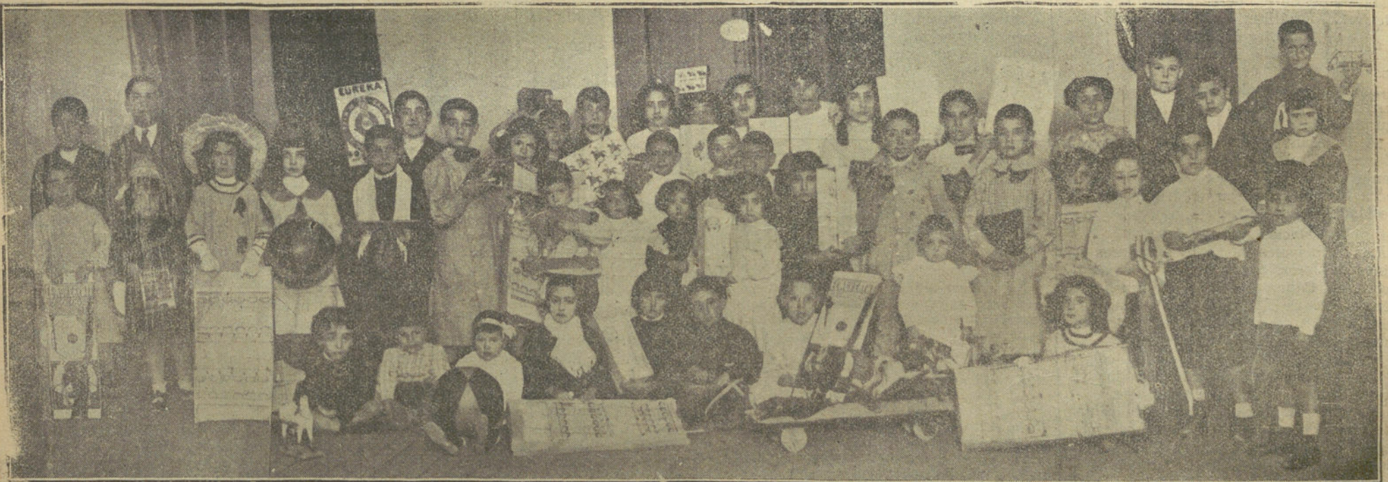
NUESTROS CONCURSOS INFANTILES.—Grupo de niños premiados en el último concurso.

La fama mundial de este violinista español asegura un completo éxito a su reaparición en Madrid.