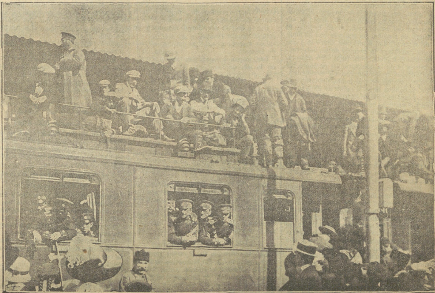
LA GUERRA EN LOS BALKANES.—Embarque de un regimiento en la estación del ferrocarril de Sofía.

LA TRIBUNA, que alardea constantemente de sana independencia, que marcha siempre hacia la verdad, no tiene empaños en cantarla en medio de los convencionalismos que se estilan y que son am-