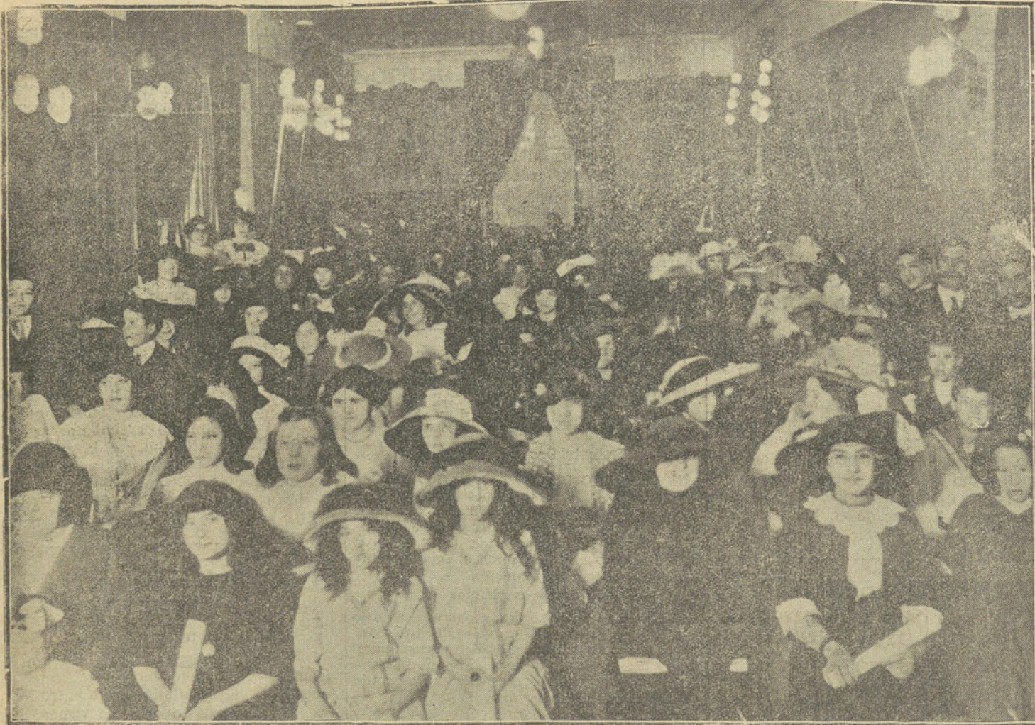
Aspecto del salón de actos del Centro Gallego, durante la apertura del curso de 1912 á 1913.