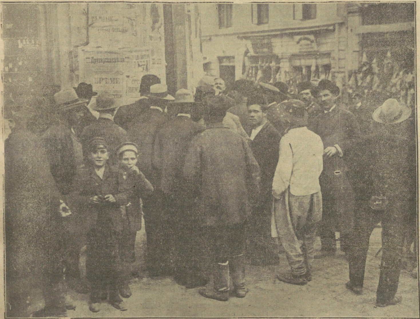
LA GUERRA EN LOS BALKANES.—La muchedumbre en una calle de Sofía leyendo el decreto de movilización de tropas

Después de su caída precipitada, ese ambiente perduró, y cuando el Sr. Canalejas fué encargado del Gobierno, todos vieron en él un símbolo, y su advenimiento se saludó con alegrías y satisfacciones. Sus primeros pasos hicieron brotar esperanzas: su gallardía enfrente de las ruinas del liberalismo doctrinario, su actitud enér-