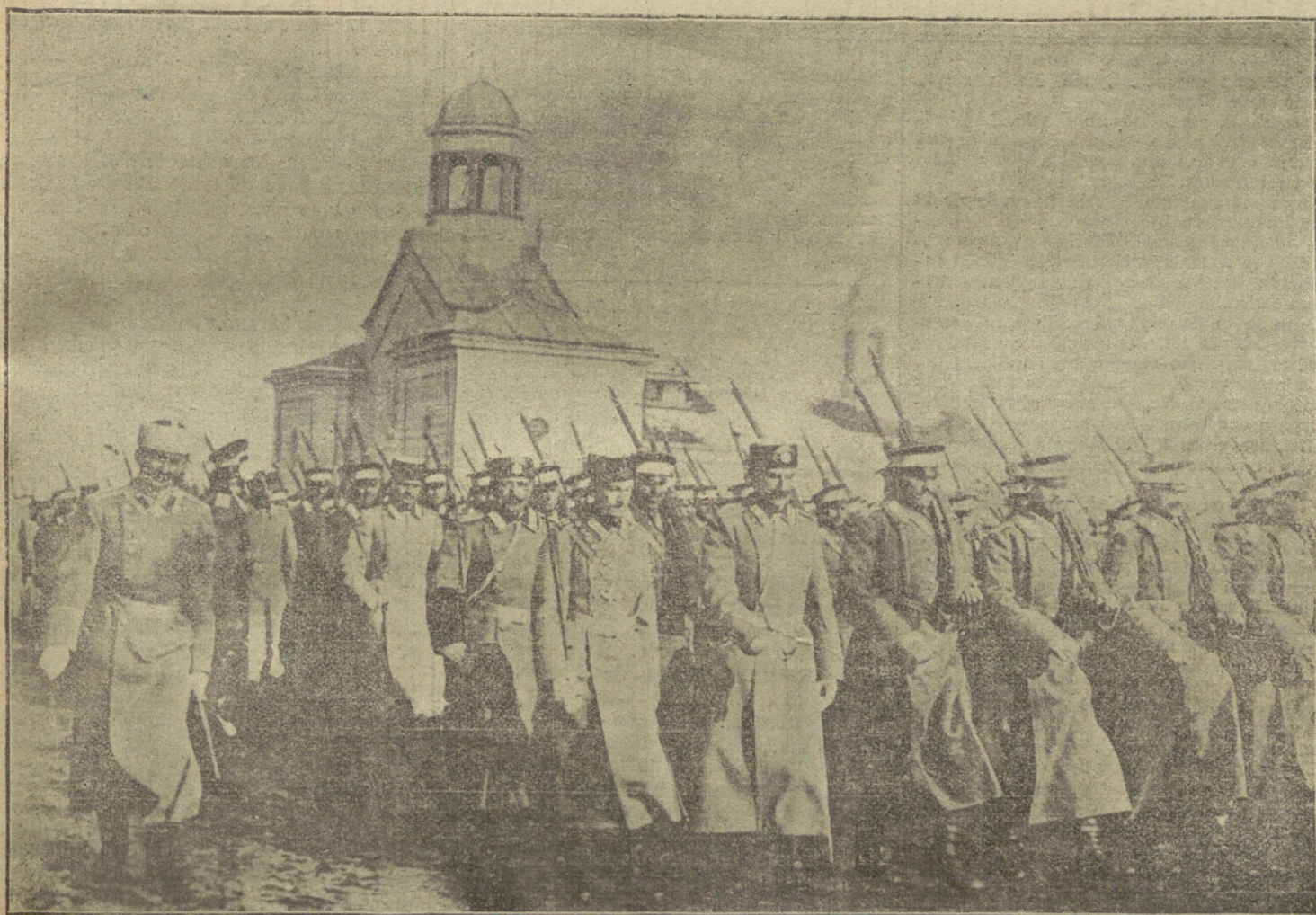
LA GUERRA EN LOS BALKANES.—El príncipe Boris, heredero del trono de Bulgaria, desfilando delante del Zar, al frente de su regimiento, que ha marchado á la guerra

Para descifrar este suelto es preciso el diccionario.