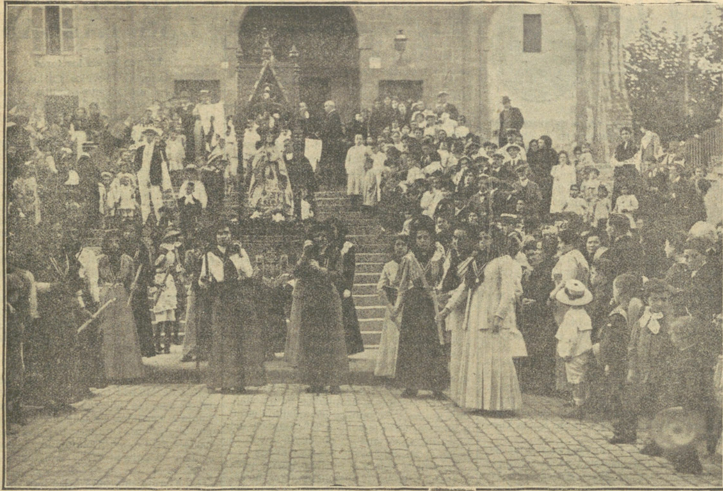
LAS FIESTAS DE LA «SANTA MISIÓN» DE GRACIA (BARCELONA).—La procesión de jóvenes saliendo del templo.