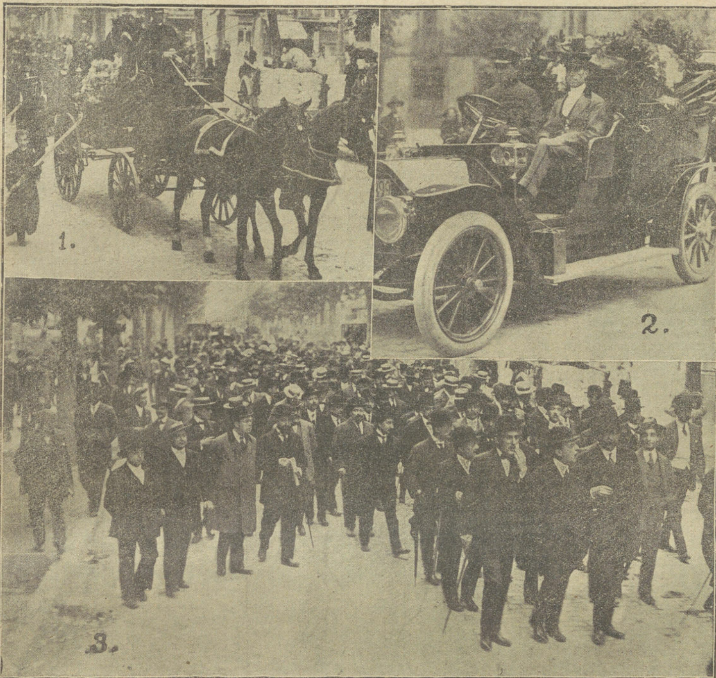
ENTIERRO DEL PIANISTA MALATS.—(1). El coche fúnebre. (2). Automóvil del Círculo Lirico, cubierto de coronas. (3). Artistas y personalidades que figuraron en la fúnebre colectiva.