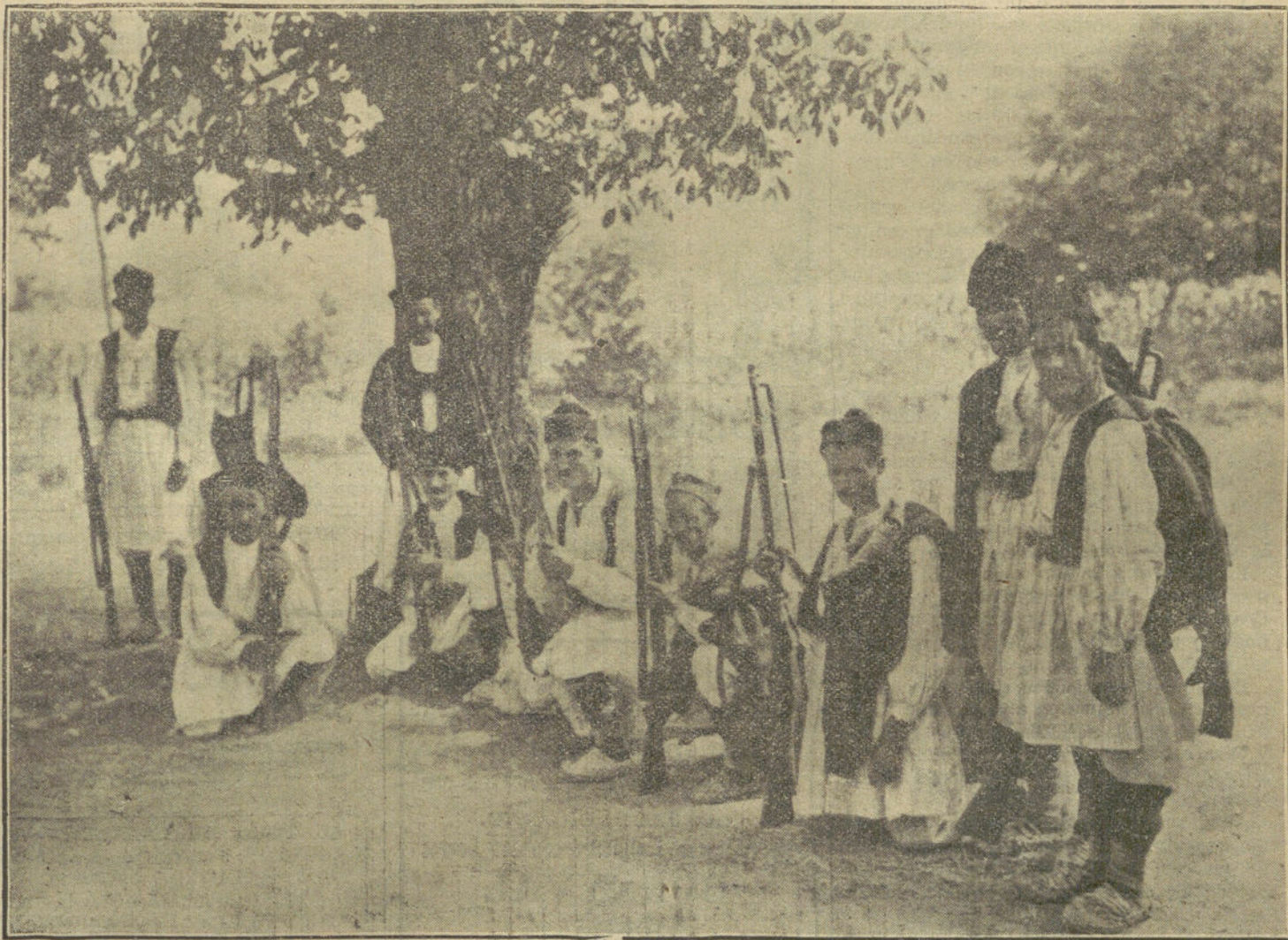
LA GUERRA EN LOS BALKANES.—Voluntarios se reúnen en la frontera

Empeño inútil, pues la atropellada había quedado en tal forma metida entre los rieles, que para lograrlo se hacía preciso la intervención de los empleados de la Compañía tranviaria.