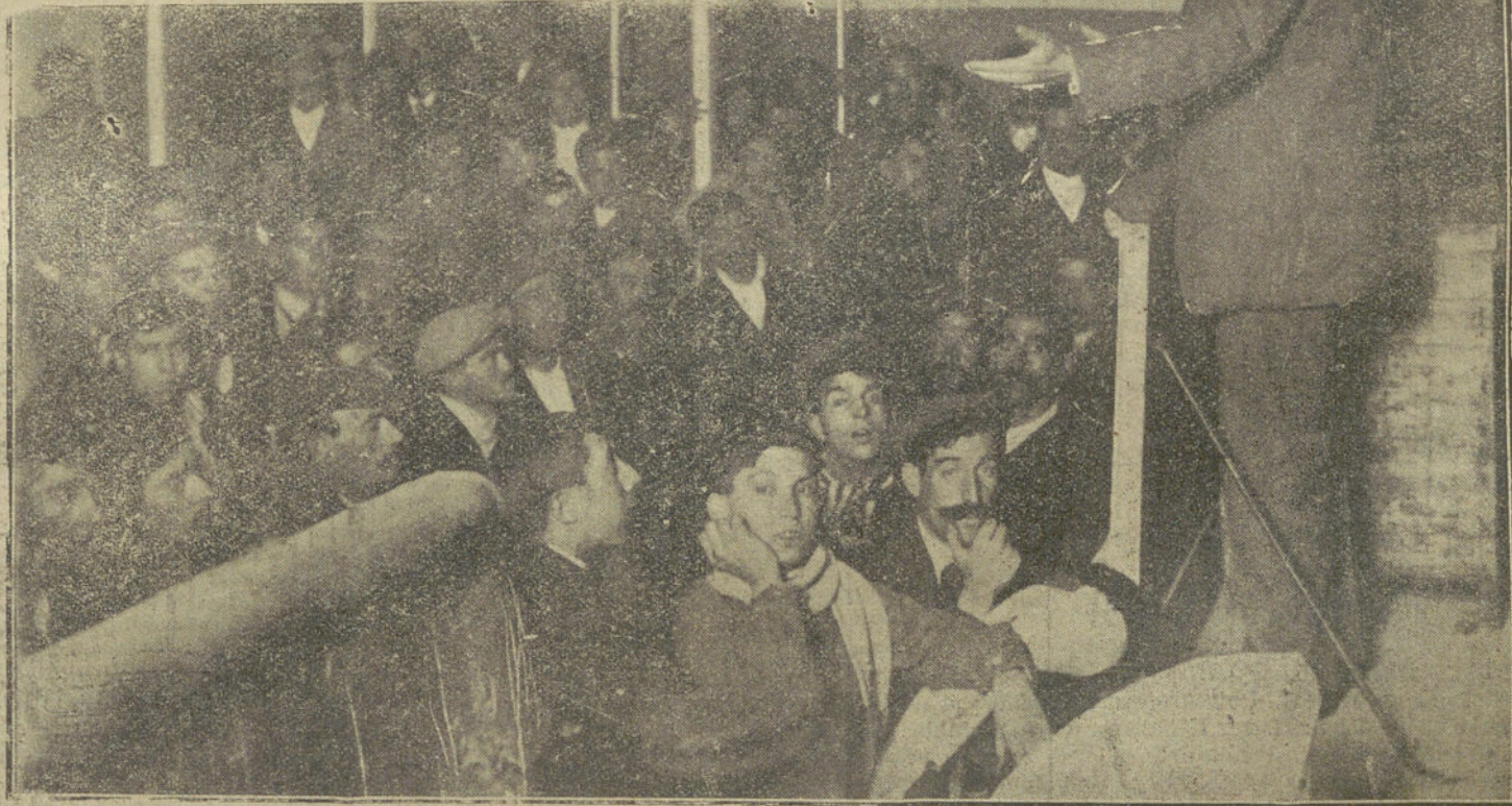
El Sr. Pablo Iglesias dirigiendo la palabra a los ferroviarios en el mitin celebrado anoche en el teatro Barbieri para protestar de los proyectos presentados a las Cortes por el Gobierno.

LA TRIBUNA, apartado de Correos número 501.