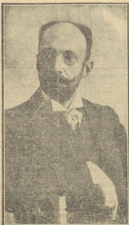
EL CONDE DE PENALVER, presidente del actual Congreso del Turismo

Próxima exposición de artículos de nieve