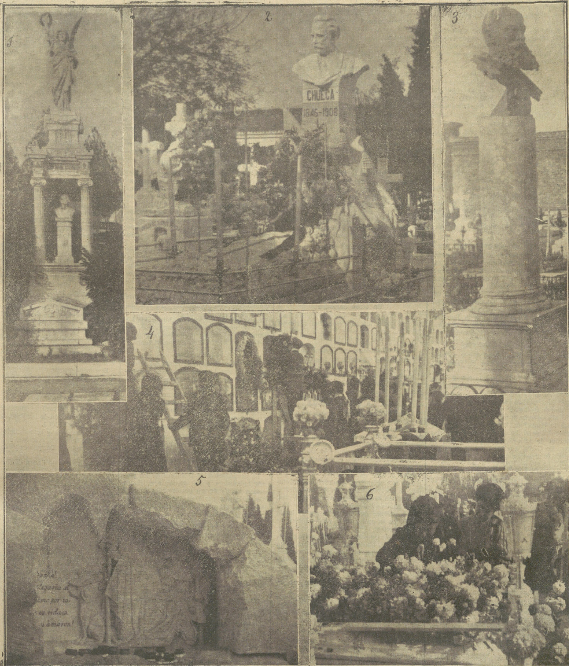
EL DIA DE HOY.—1, 2 y 3, panteones de López de Ayala, maestro Chueca y Gastó Plasencia, en la Sacramental de San Justo.—(4) Adornando los nichos en la Sacramental de Santa María.—(5) Una tumba artística en San Lorenzo, y 6, la tumba de un niño en San Isidro.