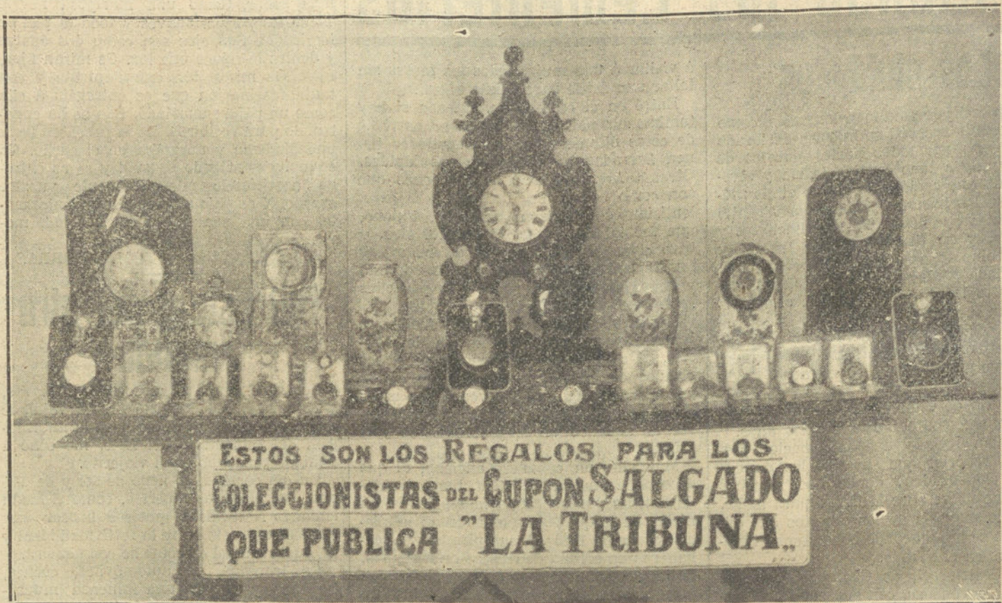
ESTOS SON LOS REGALOS PARA LOS COLECCIONISTAS DEL CUPON SALGADO QUE PUBLICA "LA TRIBUNA."