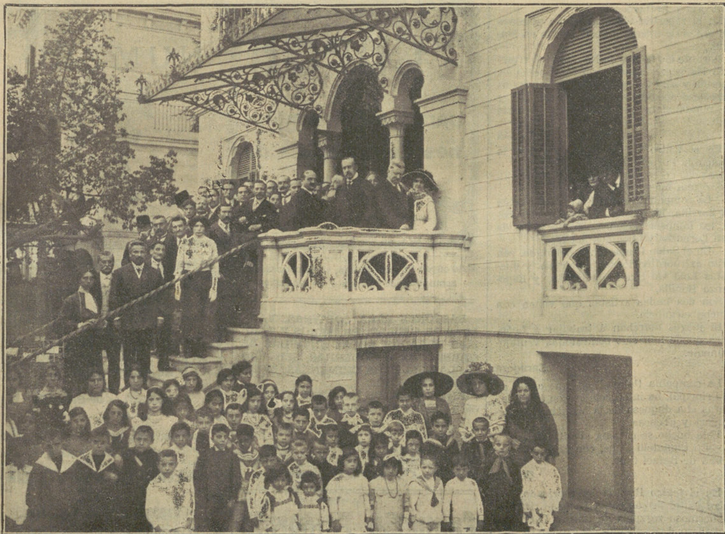
LA CASA DE LOS ITALIANOS, EN BARCELONA.—Visita del embajador de Italia en España, que ha dado una interesantísima conferencia sobre las relaciones comerciales hispano-italianas.

periódicos, un título de la Deuda de 5.000 pesetas nominales; otro de 500 y un cheque de 3.000 pesetas para cobrar en el Banco de España de esta capital.