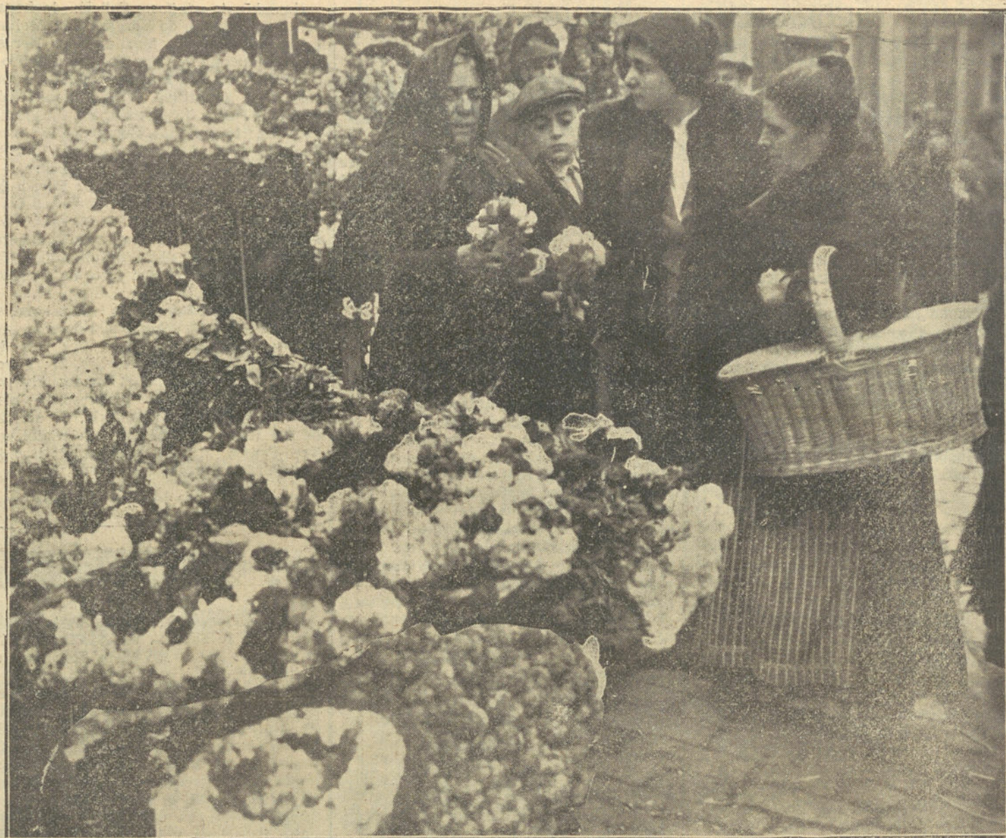
DIA DE TODOS LOS SANTOS.—Un puesto de flores.

Absolvieren , absolver. Acceptieren , aceptar. Accordieren , acordar. Adoptieren , adoptar. Applaudieren , aplaudir. Assekurieren , asegurar. Balancieren , balancear. Balsamieren , embalsamar. Barbieren , afeitar. Blockieren , bloquear. Bombardieren , bombardear. Bronzieren , broncear. Centralisieren , centralizar. Chiffrieren , cifrar. Citieren , citar. Civilisieren , civilizar. Debattieren , debatir. Decimieren , decimar. Deduzieren , deducir. Defraudieren , defraudar. Degradieren , degradar. Deklamieren , declamar. Deklariieren , declarar. Deklinieren , declinar. Dekretieren , decretar. Delegieren , delegar. Demonstrieren , demostrar. Denunzieren , denunciar. Deponieren , deponer. Desinfizieren , desinfectar. Destillieren , destilar. Differieren , diferir. Diktieren , dictar. Dirigieren , dirigir. Diskontieren , descontar. Dispensieren , dispensar.