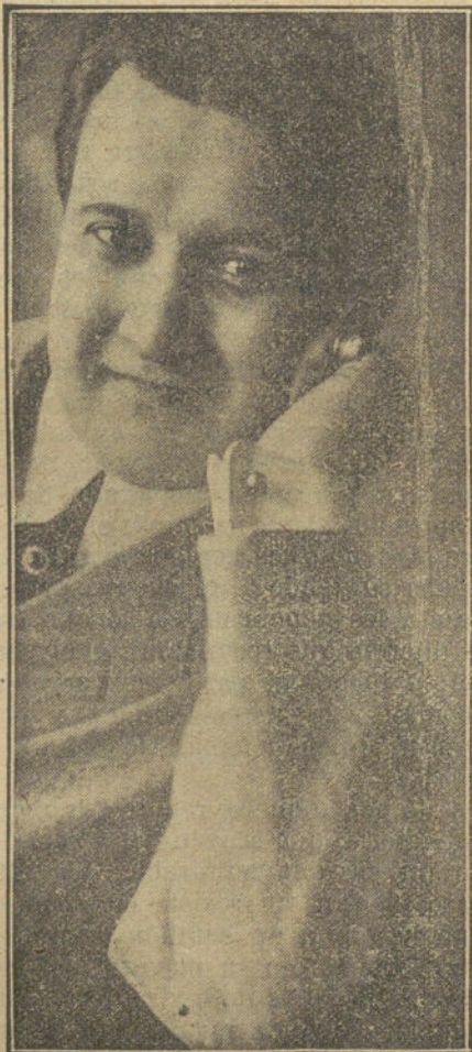
El notable tenor MANUEL ALARCON, que ha debutado con gran éxito en el teatro Price

La casa generalmente conocida por la «de Mondragón» fué la más principal de esta ciudad durante la dominación musulmana, como lo demuestra su construcción y riqueza de detalles en adornos, mosaicos, columnas, inscripciones y leyendas árabes. Fué habitada por el último alguacil árabe de Ronda, Ibrahim Alhaquime, y después de la Reconquista por su pri-