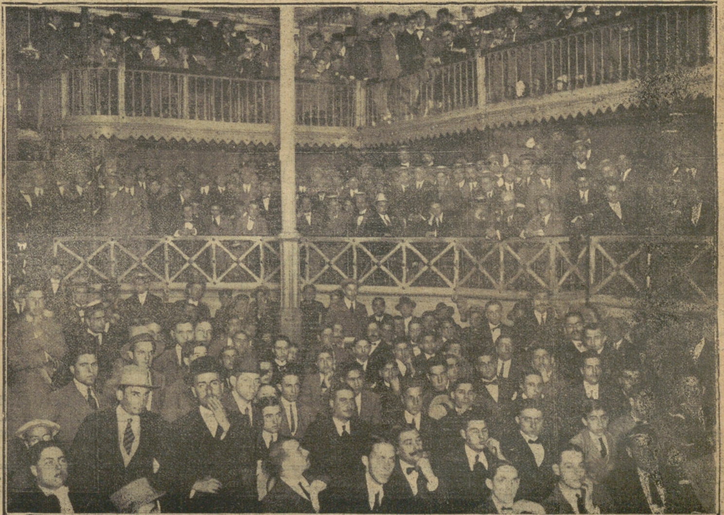
EL CONFLICTO ESCOLAR. —Los alumnos de las Escuelas de Ingenieros Industriales, de Barcelona, en la última reunión de protesta contra el proyecto del Gobierno.

Cancillería.—Disponiendo que la revista de luto riguroso durante cuatro días con motivo del fallecimiento de S. A. R. la princesa María Gabriela (duquesa de Baviera).