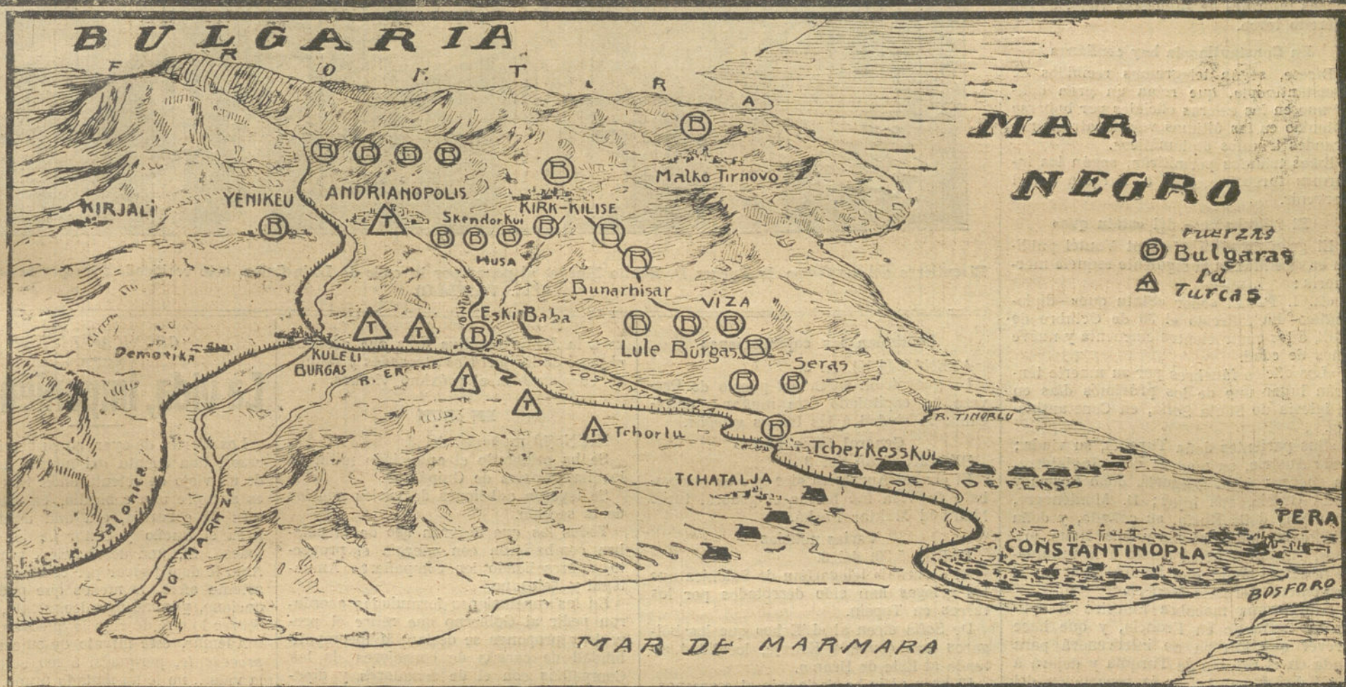
El anterior mapa muestra las posiciones búlgaras. Los círculos representan el Ejército búlgaro, y los triángulos el Ejército turco, que se halla aislado en Constantinopla, ante cuya línea de defensas se halla desde hace dos días el Ejército del zar Fernando