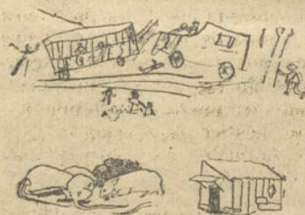
UN PASEO POR LA MONGLOA — A COGER EL TRANVIA, por Enriquito Jaramillo (seis años). — LOS INQUILINOS QUE HABITAN EN MI CASA, por Fabriciano Santos (diez años)