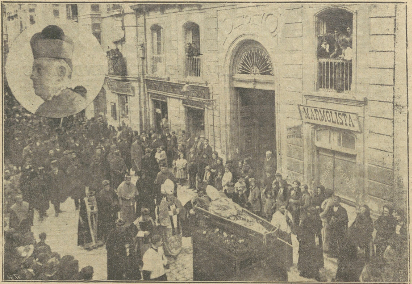
El entierro del arzobispo de Burgos D. Benito Murúa, al pasar por la calle de Lain-Calvo, acto verificado ayer por la tarde

Dicen de Constantinopla al «Berliner Tageblatt», que en aquellos centros se cree que Rusia declarará la guerra a Turquía, parece que con este motivo el embajador ruso saldrá de la capital otomana en la semana entrante.