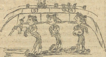
LOS IDOLOS DEL PUEBLO, por Paula Carmona (diez años)