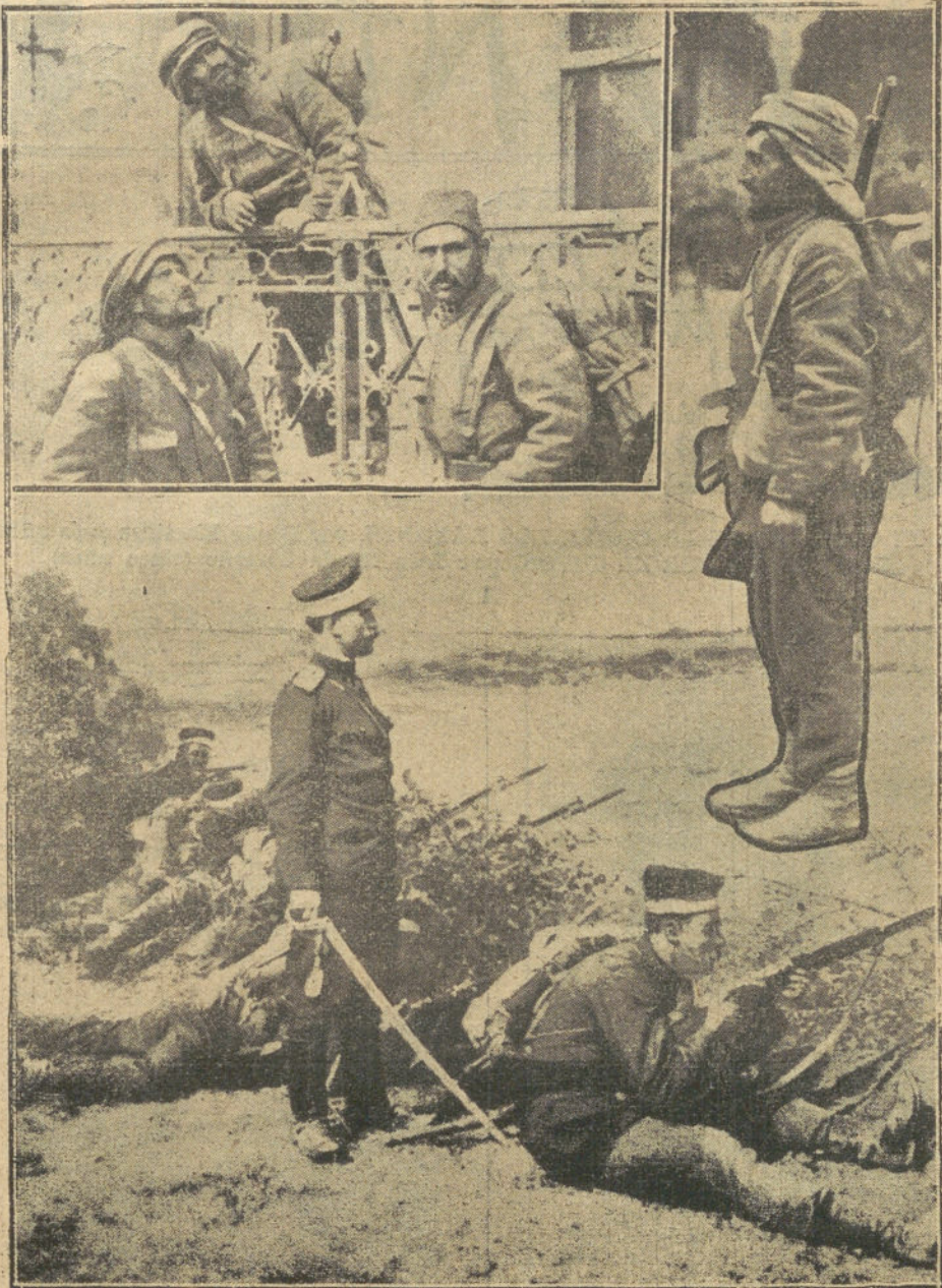
GUERRA DE LOS BALKANES. —Soldados en Adrianópolis contemplando los efectos del bombardeo de la plaza.—Un soldado turco prisionero de las tropas búlgaras.—Línea de fuego de las tropas búlgaras, frente a Adrianópolis.

rio hecho y la epopeya concluida; pero él monta a caballo y caracolea como si la epopeya continuase y como si el Imperio fuese obra suya. Es el emperador de la «gründerzeit», en la que no tuvo arte ni parte. Es el Caruso de los emperadores, como Caruso es el kaiser de los cantantes.