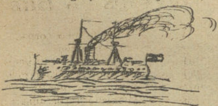
EL ESPAÑA, por Alfonsito Meirás (nueve años)