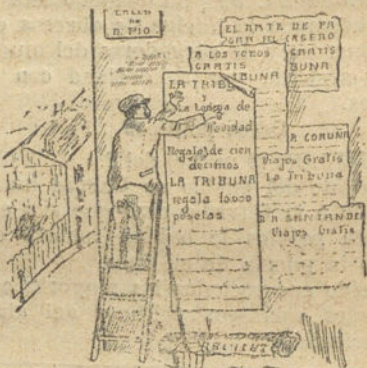
SE LE HA TERMINADO EL, por Isabel...