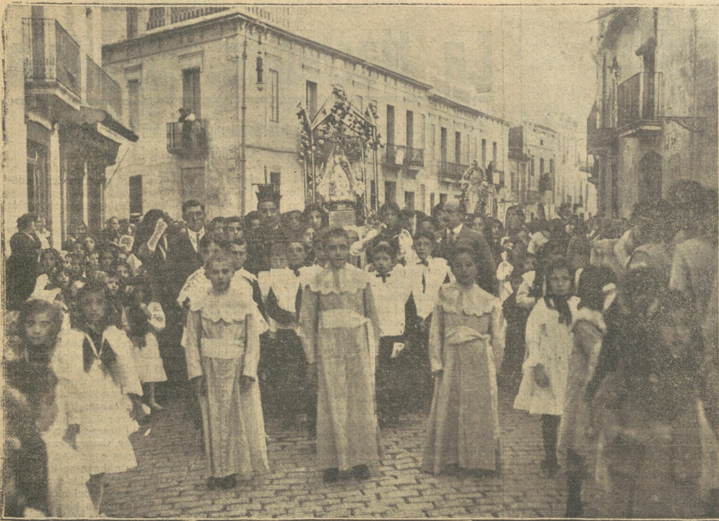
La tradicional procesión de niños en San Andrés de Palomar, de Barcelona, con motivo de la Santa Misión que se celebra en estos días.

asivas, se desprende que el 57 por 100 de los varones que perciben pensiones del Estado, van de los treinta y cinco a los cincuenta y cinco años de edad, lo que constituye un argumento más a favor de la capitalización, puesto que tales individuos que viven en su mayor parte sin emplear su actividad en trabajos productivos, podrían, de llevarse a la práctica este proyecto, disponer de un capital para trabajar.