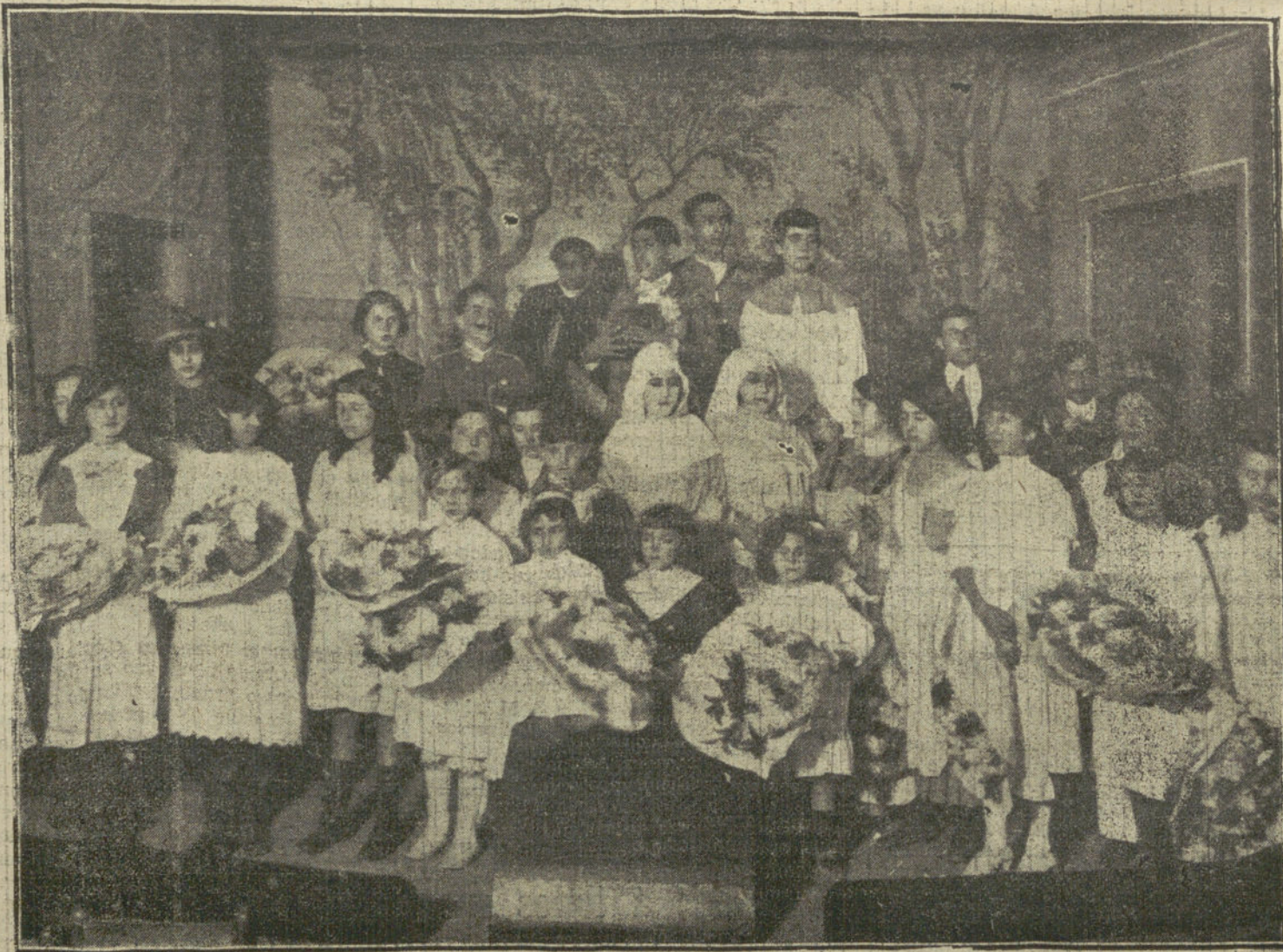
Alum. 33 del Ateneo Valentino, en Barcelona, que tomaron parte en el festival celebrado con motivo del sexto aniversario de su fundación.

Esta palabra viene de la divinidad latina