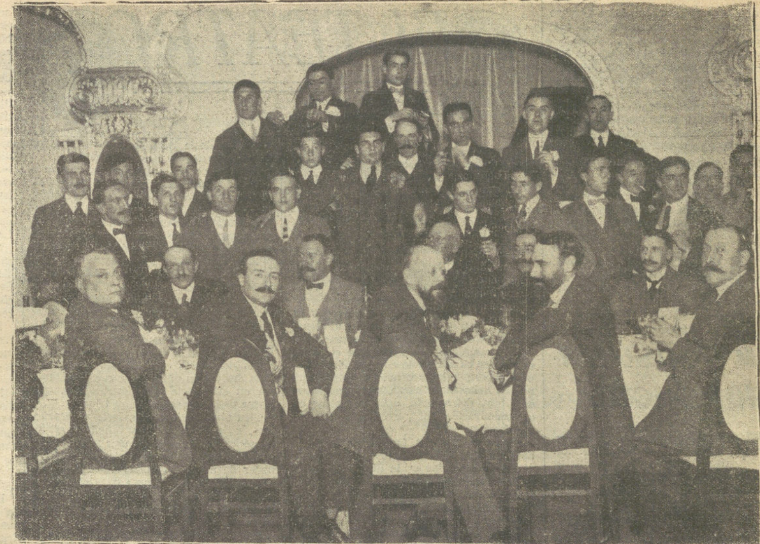
EL «FOOT-BALL» EN BARCELONA.—Banquete ofrecido por los jugadores y Junta del Barcelona F. C., a los jugadores donostiarros que tomaron parte en el concurso de «foot-ball» celebrado en la capital catalana.

El Sr. Alonso Castrillo entregó una cantidad al director, con destino a los come-