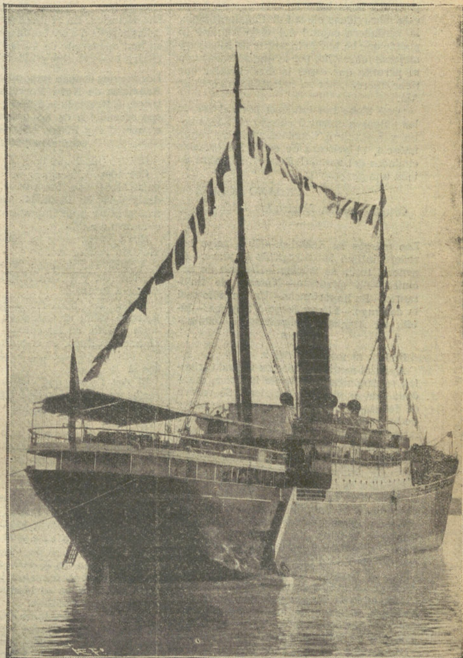
El nuevo barco «Mariano Benlliure», dotado ayer en Valencia, para hacer el servicio correo de Africa.

El Gobierno turco, en su afán de encontrar disculpas para la derrota, ha lanzado una especie que ha sido muy bien acogida, según la cual, las derrotas del Ejército turco se deben a la incorporación de elementos cristianos, y los periódicos oficiales afirman que los regimientos que huyen ante el enemigo están compuestos por sol-