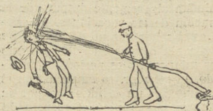
UNA SORPRESA, por Guillermo Conesa (nueve años)