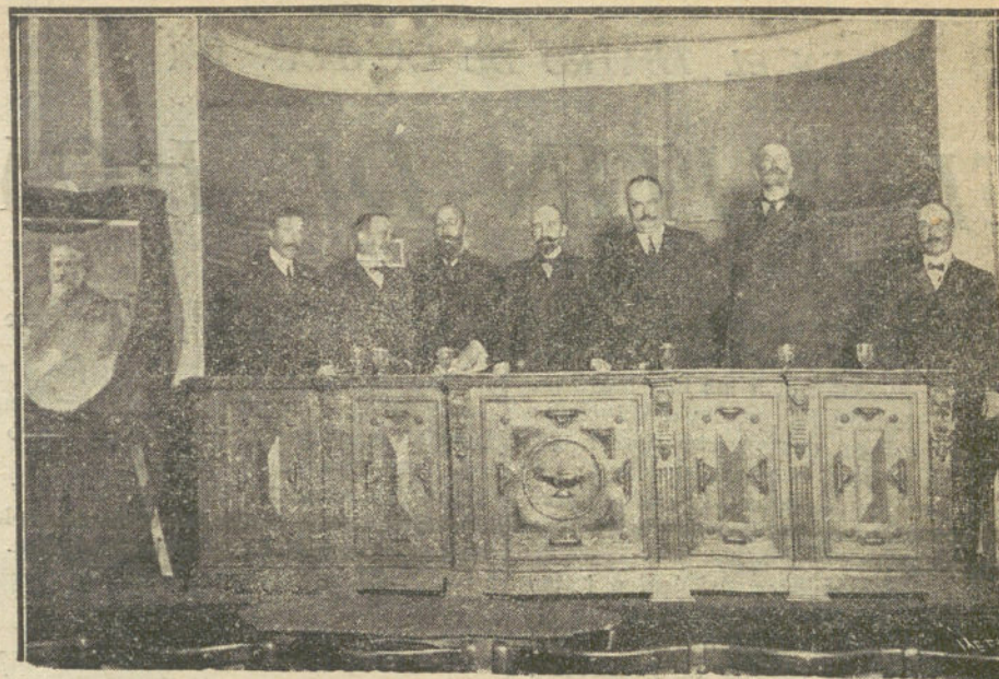
Velada necrológica en honor del Sr. Menéndez Pelayo, celebrada anoche en el Ateneo.