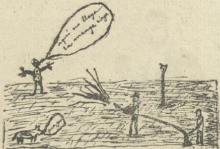
ESCENAS CALLEJERAS, por José Luis Waguer (siete años)