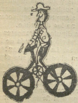
MI TIO EN BICICLETA, por Daniel Zapata (doce años). — UNO DE MI TIERRA, por Ignacio Rey (nueve años). — UN RESERVA DE LOS NOVILLOS, por Eduardo Gullón (tres años)