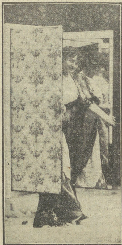
Ultimos retratos de la eminente actriz ROSARIO PINO