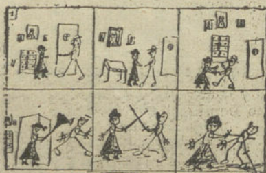
HISTORIETA MUDA, por Sergio Madrigal (doce años)