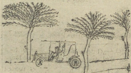
PASEANDO EN AUTOMOVIL, por Teodoro Madrigal (once años)