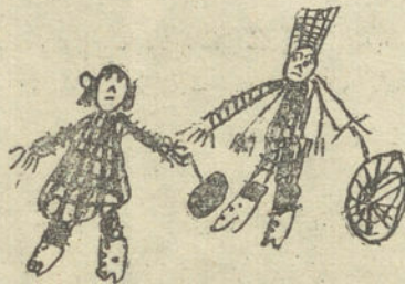
MI MUÑECA Y MI PRIMO, por Carmen Muñoz (siete años)