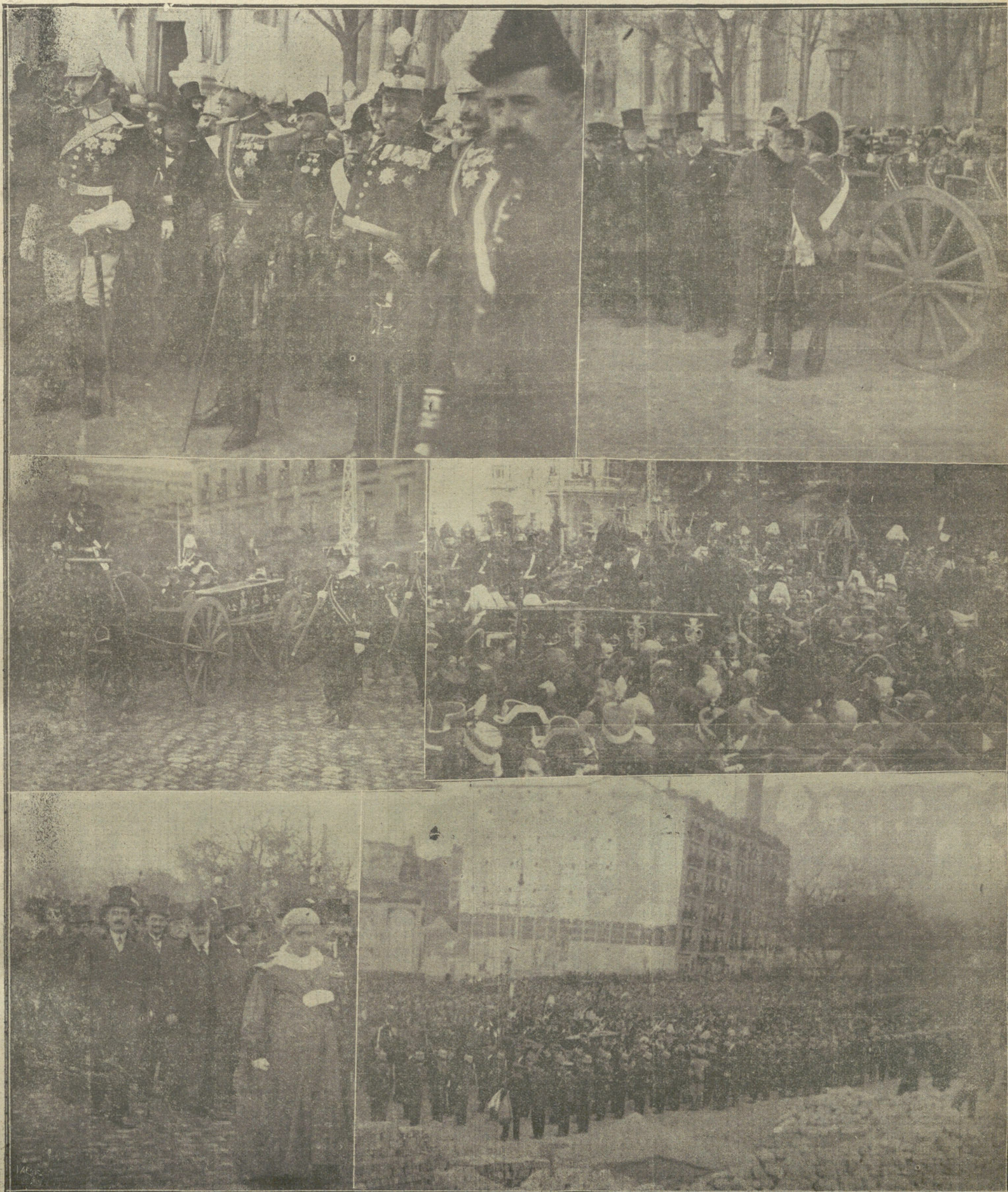
Detalles del entierro del presidente del Consejo.