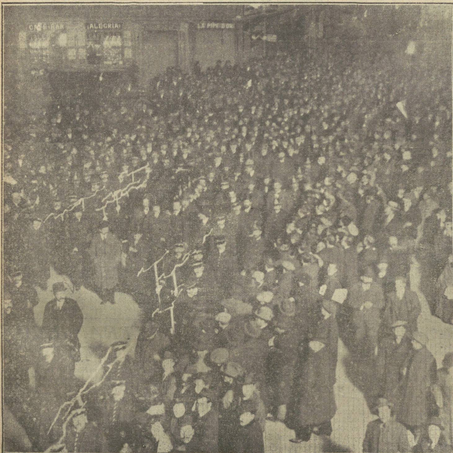
EL ASESINATO DE CANALEJAS.—Traslado del cadáver del presidente desde el ministerio de la Gobernación al Palacio del Congreso.—La comitiva al pasar por las Cuatro Calles.