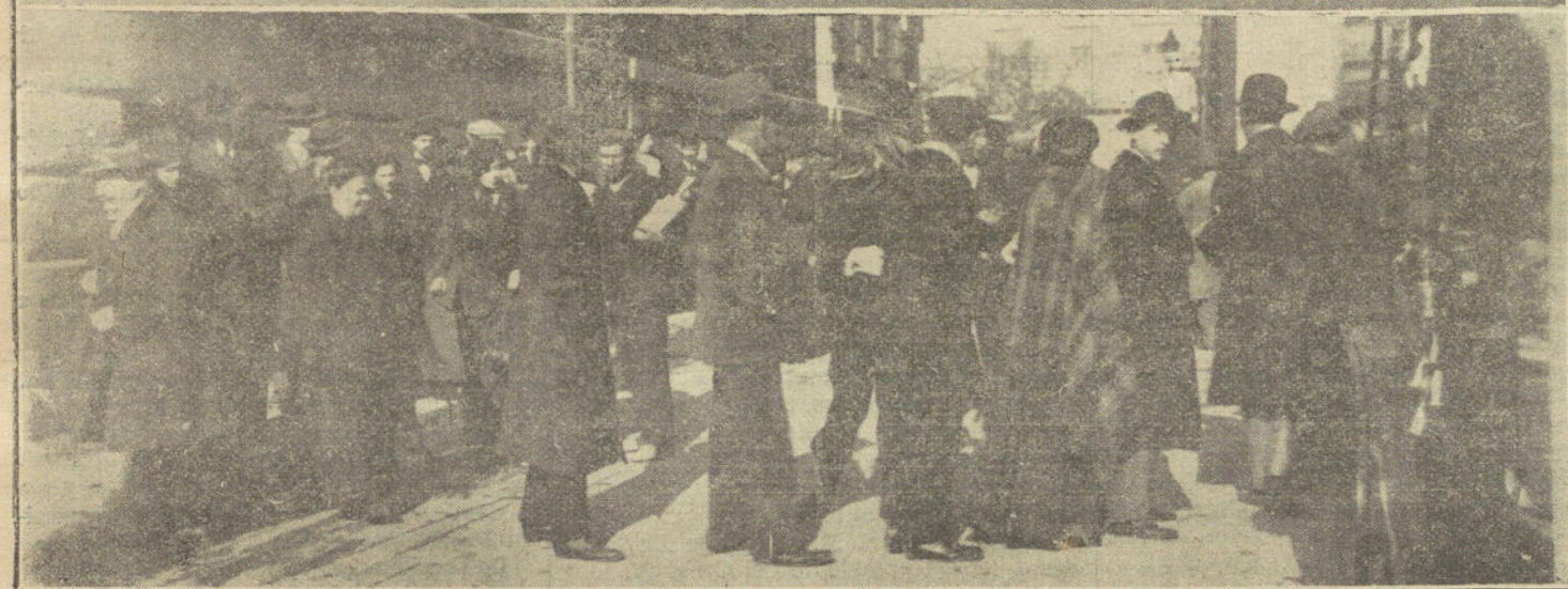
El cadáver de Canalejas en el Congreso.—El principio de la cola.—En la calle de Alcalá.—El final de la cola en la calle del Turco.