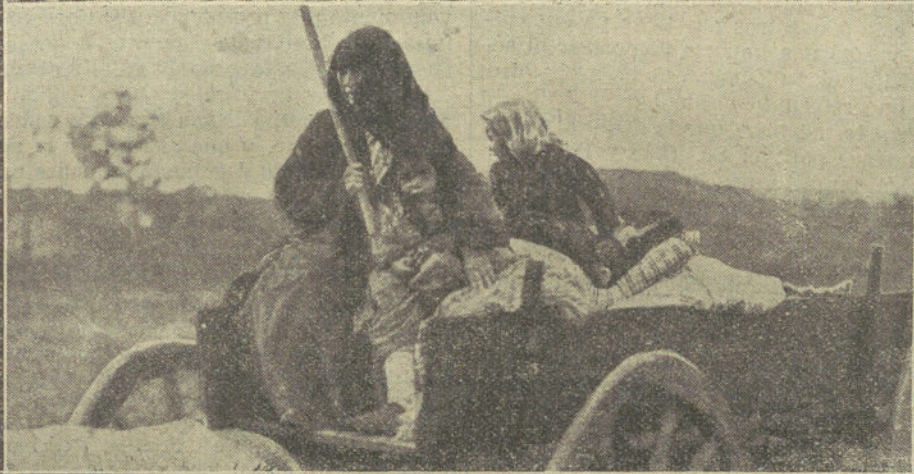
LA GUERRA EN LOS BALKANES.—Ante el avance de las tropas aliadas, las familias turcas abandonan sus leres, y en largas, llevando ajueres y enseres, llenan los caminos que conducen a la frontera asiática. Nuestro grabado representa algunos de esos grupos emigrantes

como en el extranjero, se implantan con éxito.