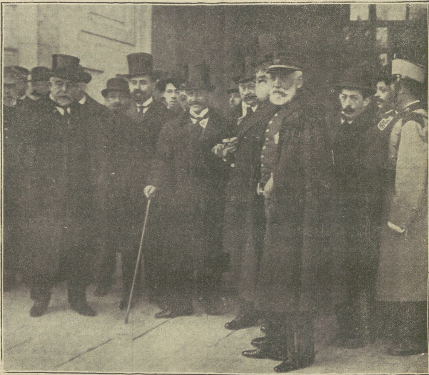
El conde de Romanones y los demás ministros, al salir de Palacio después del Consejo presidido por S. M.

De los once a los diez y seis años se ocupó de las faenas del campo, marchando después a Zaragoza para sentar plaza de