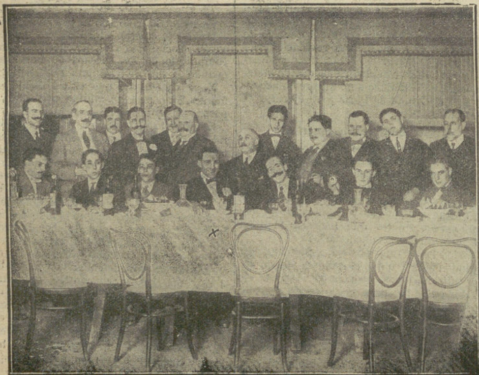
Banquete con que han obsequiado al gran escultor JULIO ANTONIO los artistas y escritores valencianos en la ciudad levantina

LA TRIBUNA proveerá de relojes á todos sus lectores