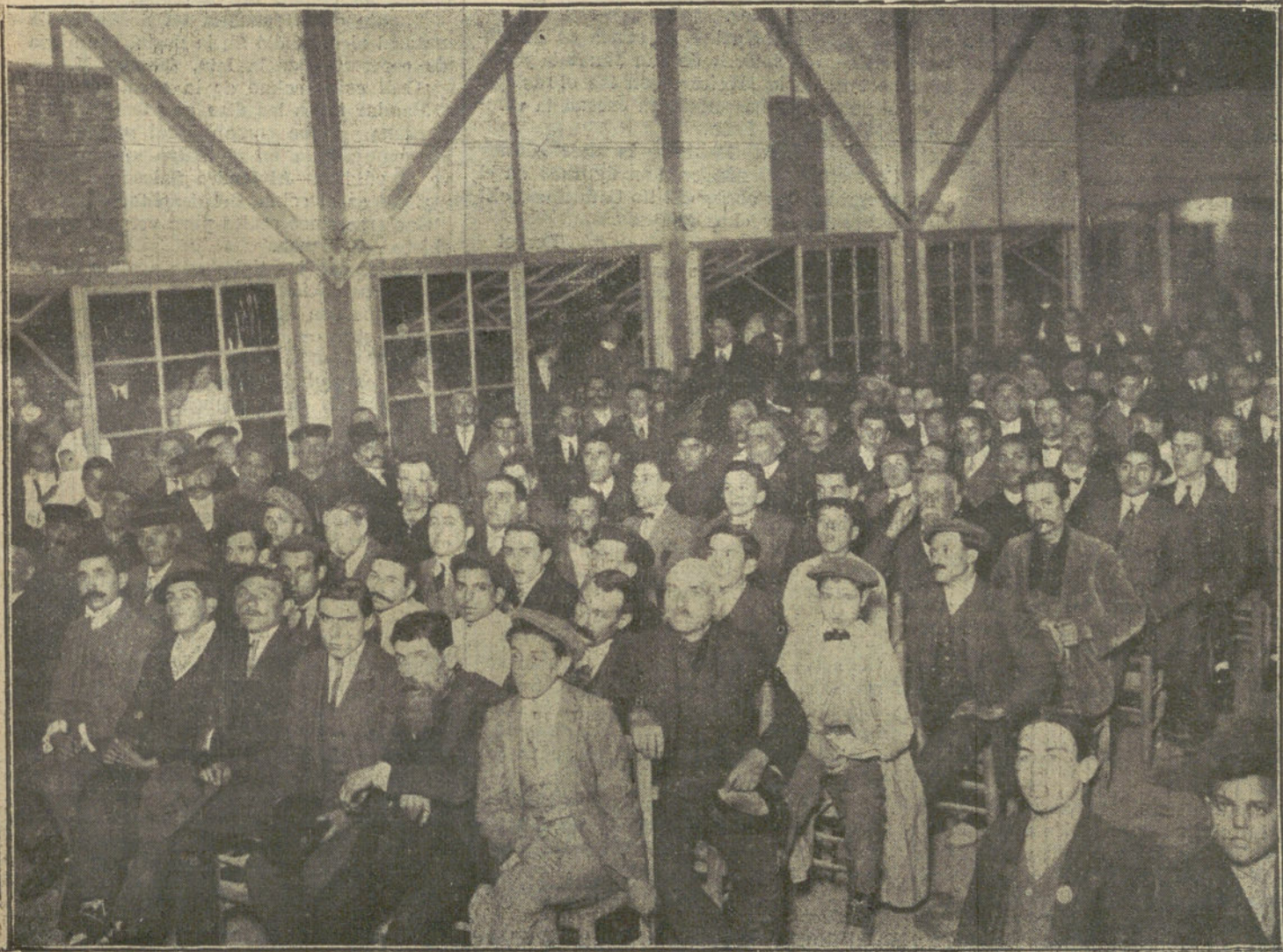
Miun tradicionalista en SANS, organizado por los redactores del semanario catalán «La Trinchera».

Hauptmann es autor también de cuentos muy notables para niños. —Hallet.