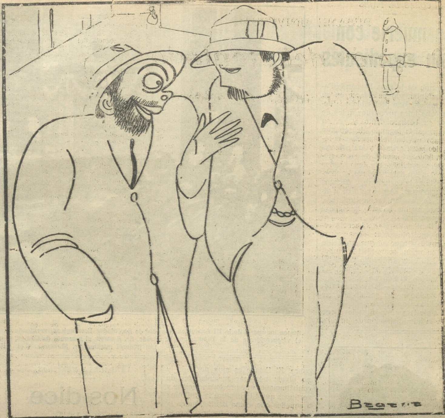
DIALOGO DE ACTUALIDAD

—Oye, ¿no tienes miedo que te cojan? —Ga, hombre, ¿no ves que estoy «dichao».