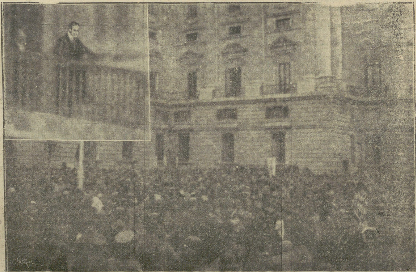
La manifestación escolar frente á Palacio.—S. M. el Rey saludando á los manifestantes.

En Zaragoza se ha celebrado esta tarde una grandiosa manifestación para protestar del inico atentado. Asistieron 20.000 personas y se cerraron todos los establecimientos, incluso los cafés. En Santiago también se verificó una manifestación análoga.