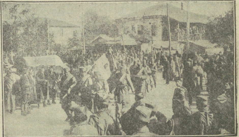
LA GUERRA EN LOS BALKANES.—Entrada triunfal de los servios en Uskub, antigua capital de Servia que ha permanecido en poder de los turcos durante cinco siglos

Más tarde, cuando Europa, conmovida, presenciaba la marcha triunfal de Bonaparte, todos los ojos convergieron hacia nosotros el día que resonó por nuestros campos el grito de independencia... En las