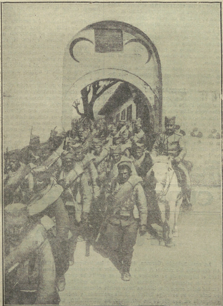
LA GUERRA EN LOS BALKANES.—Los serbios en Uskub. El primer destamato servio que entró en la capital, franqueando la puerta de las murallas

El público, entusiasmado del resultado de la corrida,