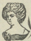
Madame Giral á los 65 años

Tos crónica.—Catarros pulmonares, se curan con jarabe Anticataral Zúñiga Cerrudo 2 ptas. frasco. Jacometrezo, 14. Madrid.