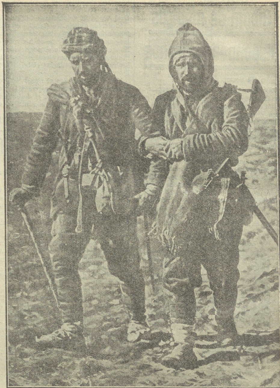
LA GUERRA EN LOS BALKANES.—Un soldado turco conduciendo á un camarada herido en la retirada de Lule-Boor-gas

mes ha recibido un expresivo telegrama del ilustre fundador de los «Boy-scouts», y el capitán Iradier la siguiente carta, que refleja los lazos de unión que empiezan á crearse entre nuestros exploradores y sus camaradas del Reino Unido.