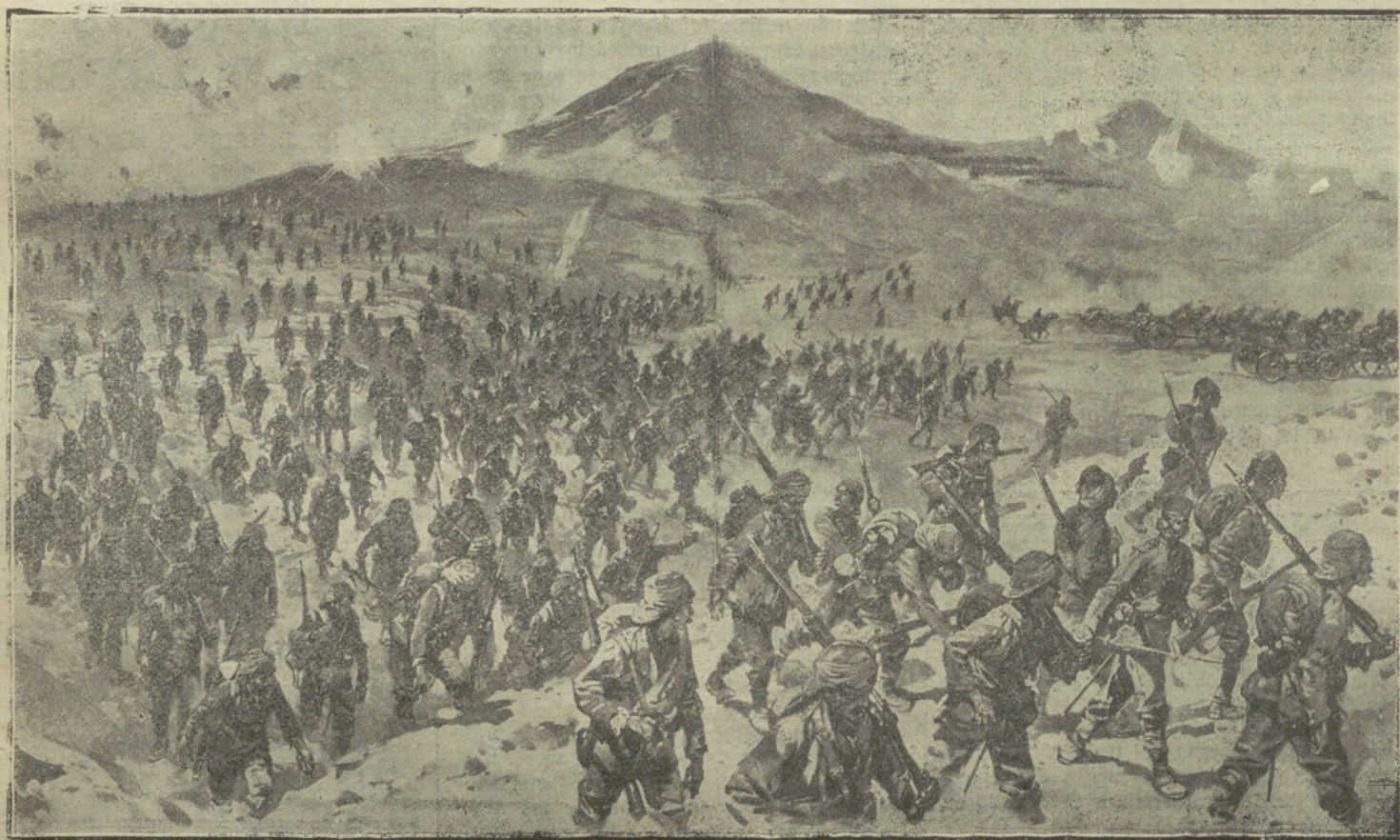
LA GUERRA EN LOS BALKANES.—La retirada de Lule-Boorgas.—La duodécima división turca, próxima á ser copada por las tropas búlgaras vencedoras