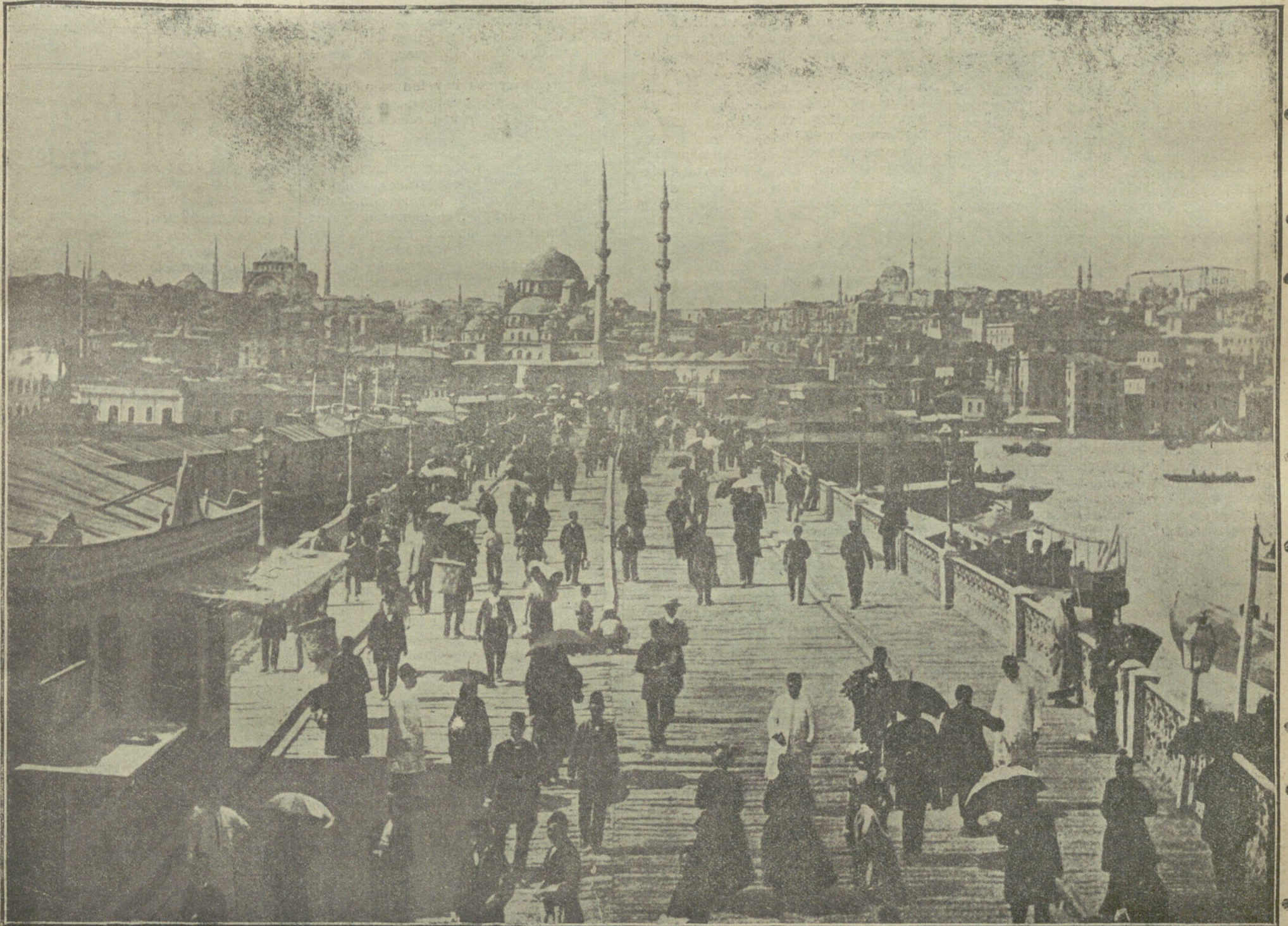
LA GUERRA EN LOS BALKANES.—El puente nuevo que une la parte Este de Galatz y Stambul en Constantinopla. Está situado en el centro de la ciudad y es el puesto de mayor tráfico. Al fondo se ven las torres de Santa Sofía, una de las partes más pintorescas de la ciudad

en ver cumplida su profecía... el pueblo español se alzó sobre sí mismo, alcanzó el vuelo de las águilas y, desplumadas, las lanzó por encima del Pirineo... Se reunió el