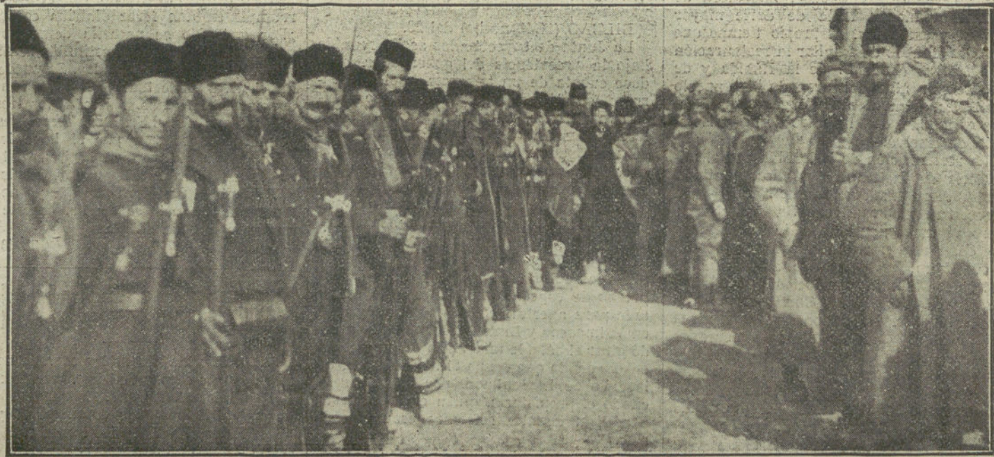
LA GUERRA EN LOS BALKANES.—Prisioneros turcos custodiados por las tropas serbias en la estación del ferrocarril de Monastir

El Papa ha nombrado a monseñor Apag Bologna, secretario de la Nunciatura apostólica de España.