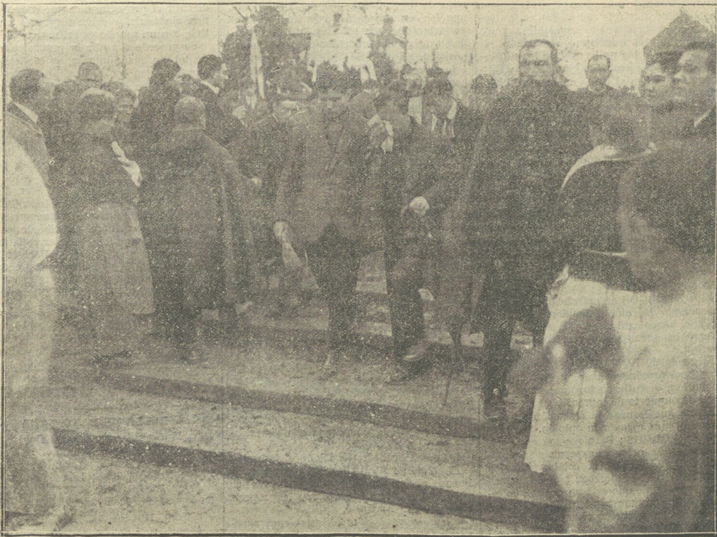
LA CATASTROFE DE BILBAO.—Las familias de las víctimas al salir del cementerio después del sepelio.

Hay el menor asomo de hostilidad en la alta Cámara hacia la región catalana, como caprichosamente han supuesto algunos.