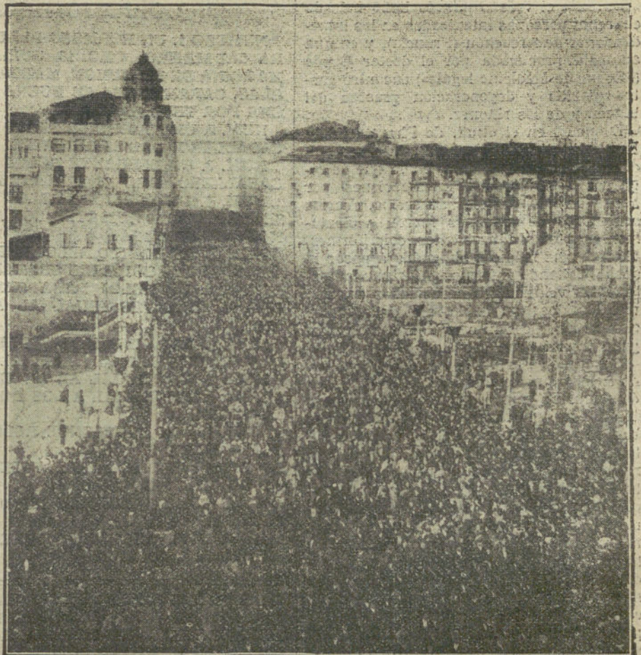
LA CATASTROFE DE BILBAO.—Inmenso gentío que nguro en el acompañamiento del entierro.

—Pues tenemos compradas nueve corridas y estamos en negociaciones para adquirir la décima. Contamos con toros de Miura, Santa Coloma, Martínez, Murube, Parladé, Villagodio, Sallido, Veragua y Guadalest. Y los tratos que traemos entre manos son con Palha.