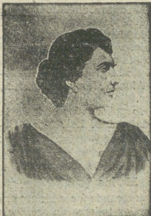
Diez días después de haber tomado el Depurativo radical.