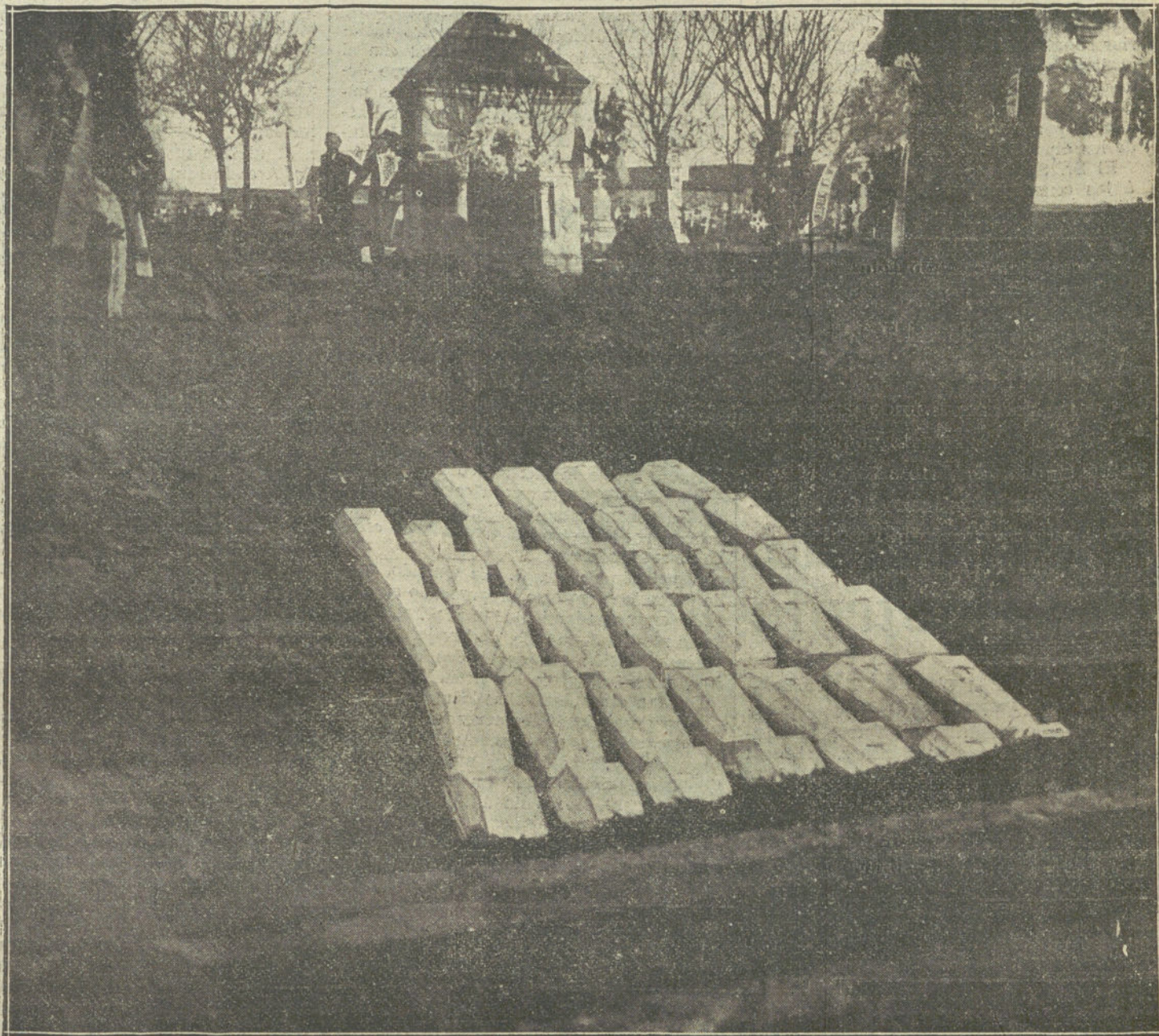
LA CATASTROFE DE BILBAO.—Los cuarenta y dos féretros de las víctimas colocados en la fosa donde han recibido sepultura.

Las comitivas fúnebres recorren las calles de Cetinje, precedidas de un niño llevando una cruz con crespónes; un coro de jóvenes la sigue, entonando con voz grave un canto litúrgico; después un «pope» con una cruz de metal en la mano y con unas vestiduras negras; después un