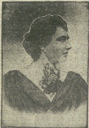
Antes de tomar el Depurativo radical

SIFILIS aun la más rebelde en cualquiera de sus tres periodos, el