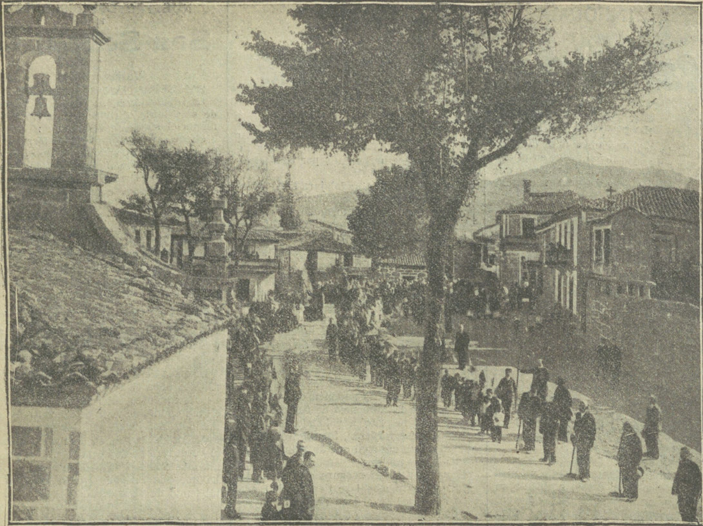
LA FIESTA DEL ARBOL EN JUNQUERA DE AMBIA.—Los niños de las escuelas públicas dirigiéndose á hacer las plantaciones.