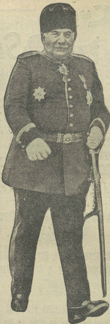
Generalísimo turco Nazim Pachá, que ha dirigido el Ejército turco durante la pasada campaña, y que ha representado á Turquía en las negociaciones