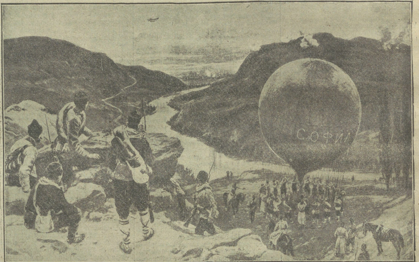
LOS GLOBOS Y LOS DIRIGIBLES EN LA GUERRA.—Soldados búlgaros disponiéndose á lanzar un globo que va á realizar una exploración sobre Adrianópolis

T. DE REMIRO Y VELAZQUEZ Madrid, 6 12 912.