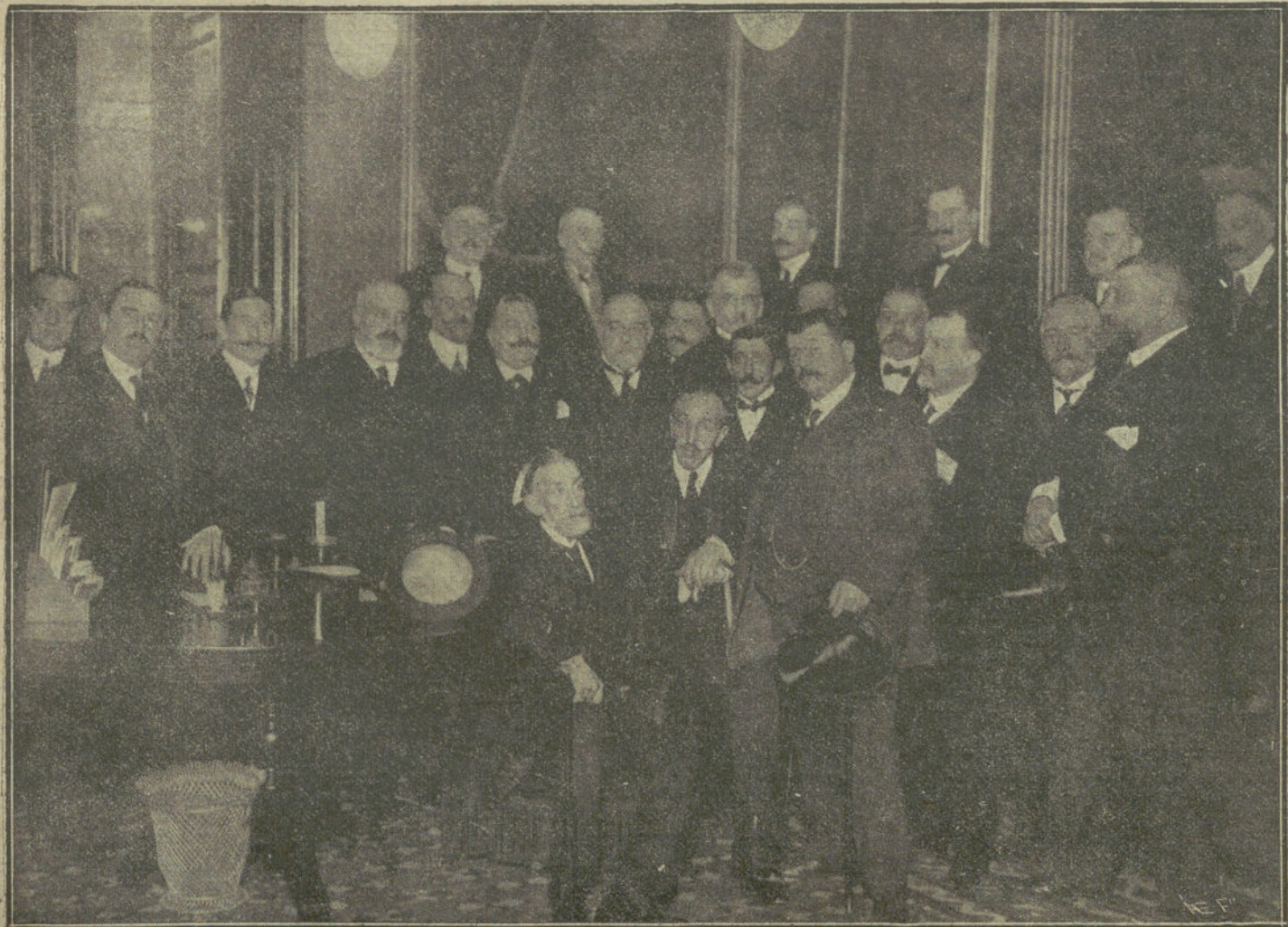
REUNION DE DIPUTADOS Y SENADORES CANALEJISTAS, verificada en el senado, esta tarde, á las cinco, para acordar un homenaje á la memoria del Sr. Canalejas.

La vía tardará dos ó tres días en estar expedita. Los trenes llegan con muchas horas de retraso.—Menchet