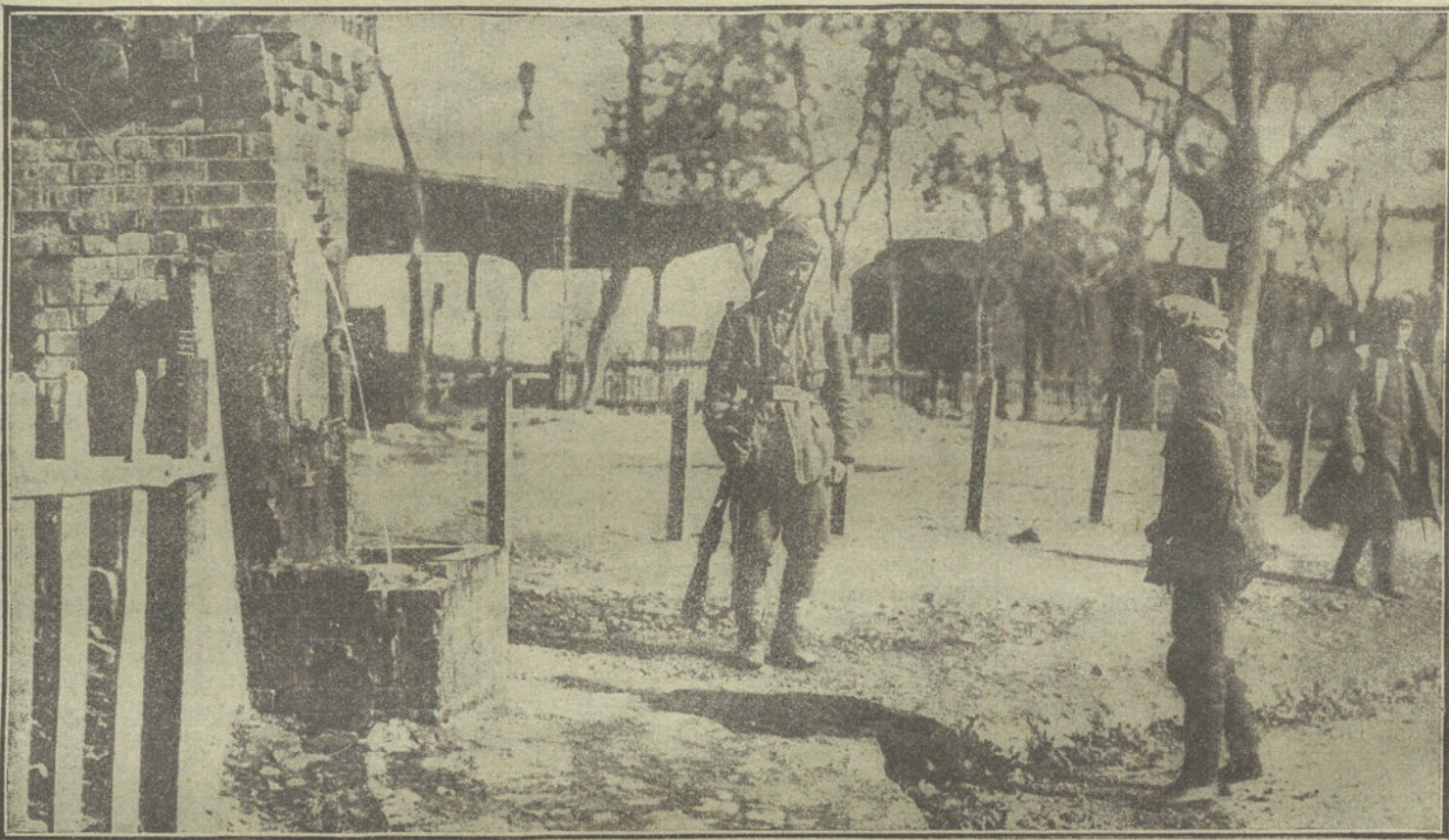
EL COLERA EN TURQUIA.—Un centinela turco vigilando una fuente de las afueras de Constantinopla

Sin moverse de su casa, pudo hallar todo el presupuesto preciso para una vía