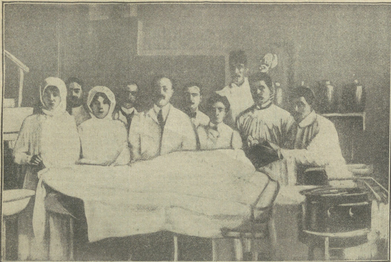
GUERRA EN LOS BALKANES.—En la sala de operaciones del Hospital de Haider Pacha, un herido turco operado con asistencia de las damas turcas.