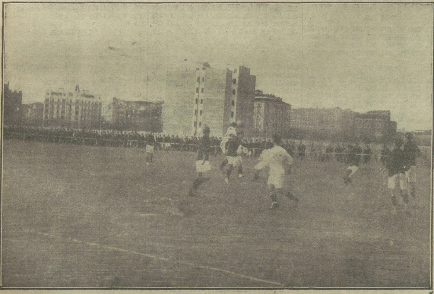
Un momento interesante del partido de «foot-ball» jugado ayer tarde entre los primeros equipos del «Hispania» F. C. de Valencia y el «Madrid» F. C. (Fot. VIDAL.)

LA TRIBUNA, apartado de Correos número 501.