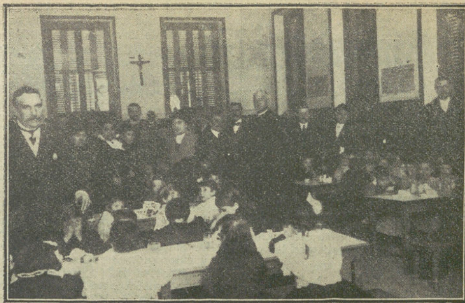
Comida costeada por la Reina para los niños del grupo escolar de la calle de Fernando el Católico.

Otra está ocupada por las duquesas de Híjar y Baena, marquesa de Casa-Calderón, señorita de Álvarez Calderón, Díaz de Rivera, Ruiz de Arana y Silva; marqués de Marbais y señores de Pérez de Guzmán