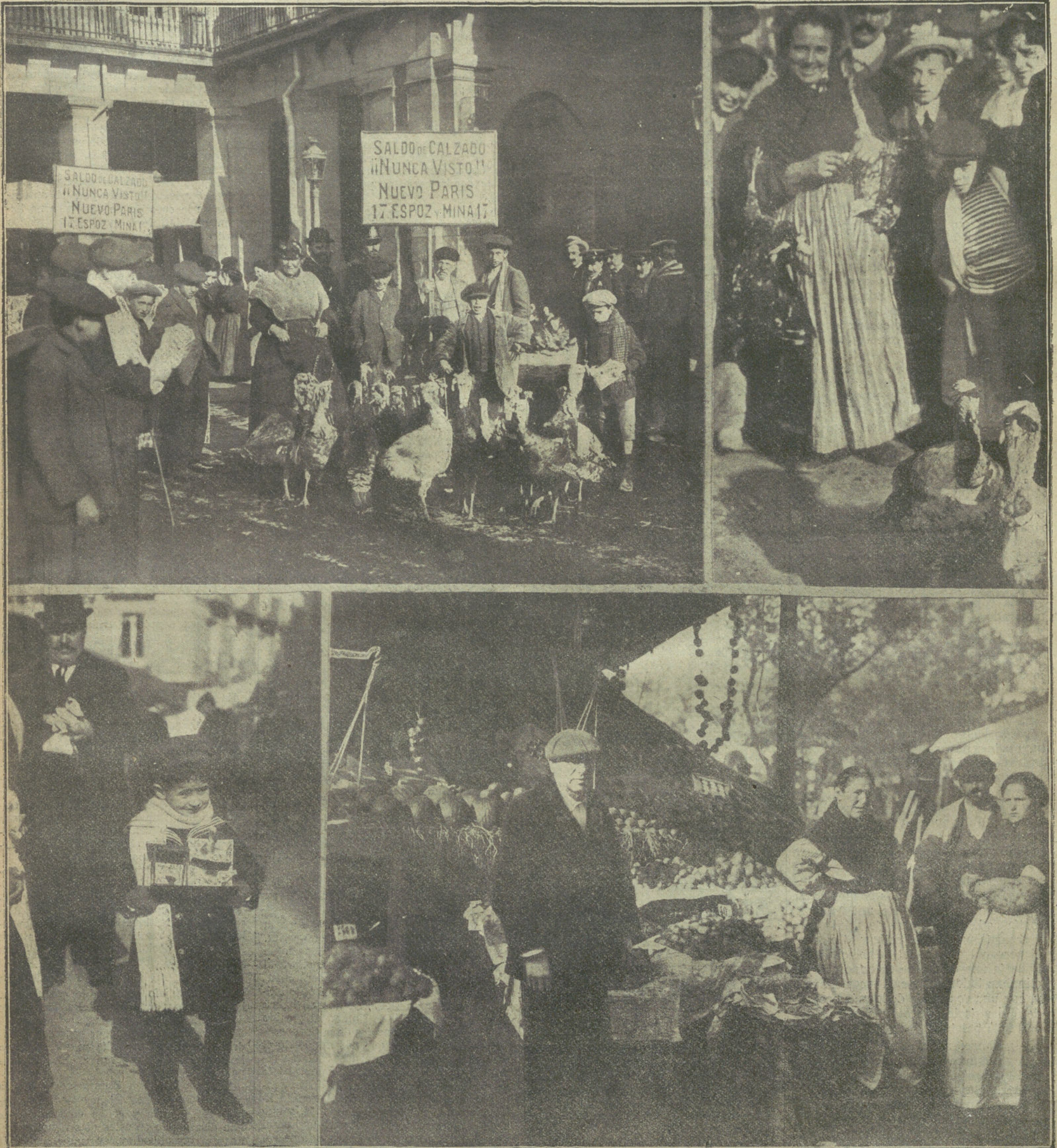
Varias escenas de las fiestas de Navidad en Madrid