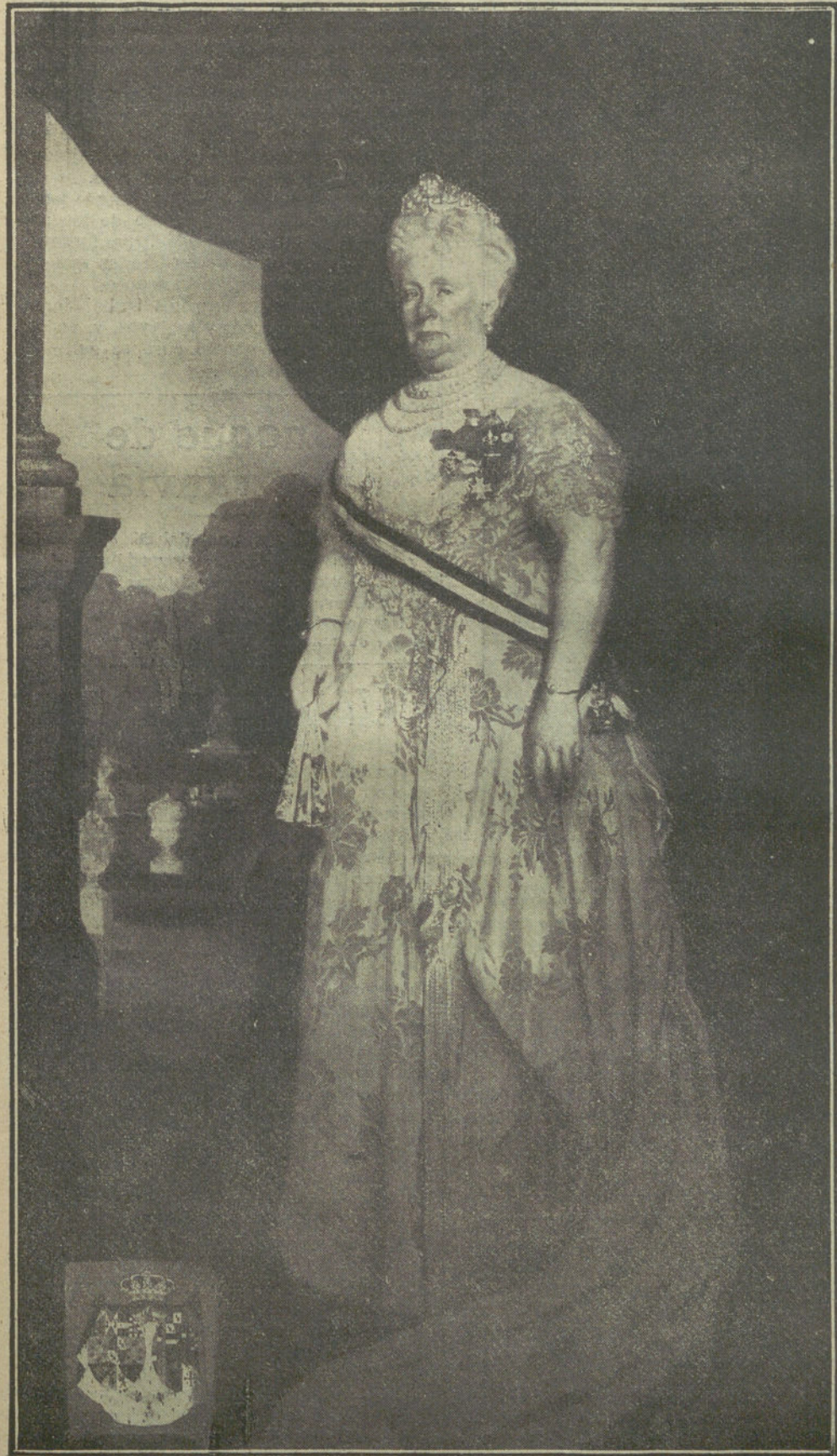
Retrato de S. A. la Infanta Isabel, pintado por el ilustre artista Manuel Benedito