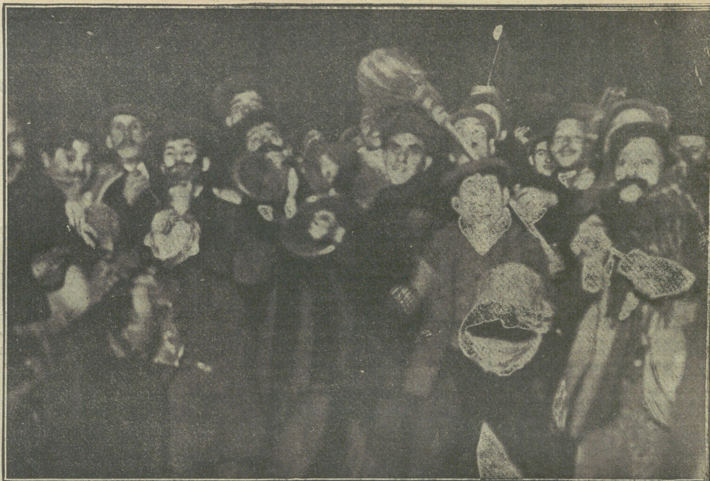
Otra nota de las fiestas de Navidad en las calles de Madrid.

Este género artístico, que en el extranjero ha dado nombre y positivos resultados a Capiello, Mücha y Steinlen, aquí se ha tenido en poca estima. Casas, en algún tiempo, trabajó algo en tal clase de pintura; Carlos Vergés también hizo algunas bellísimas obras; pero, en realidad, el arte