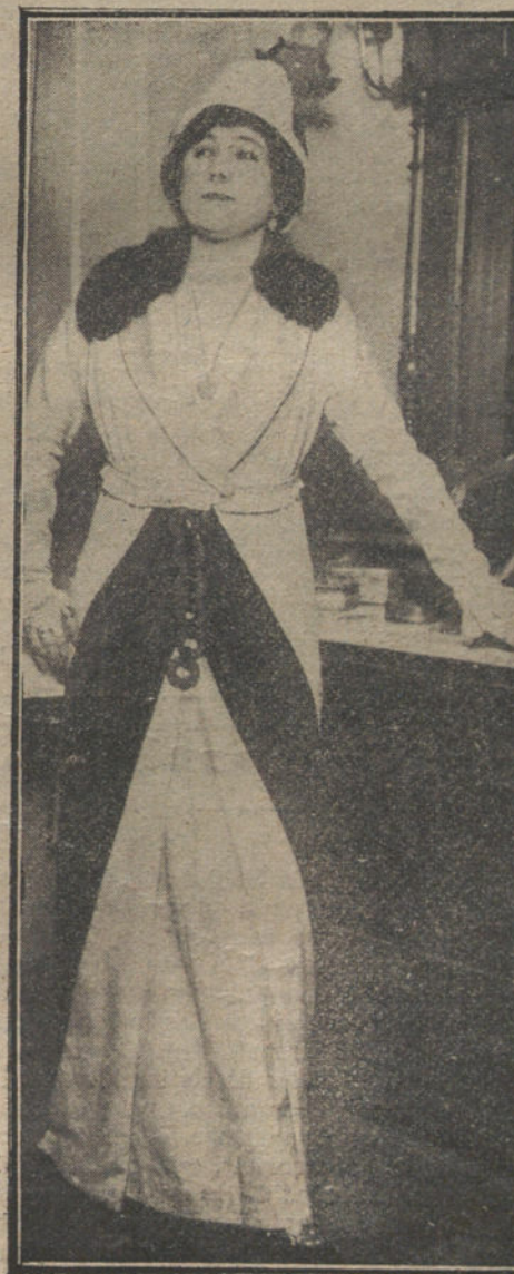
En «La veda del amor». Segundo gran éxito.