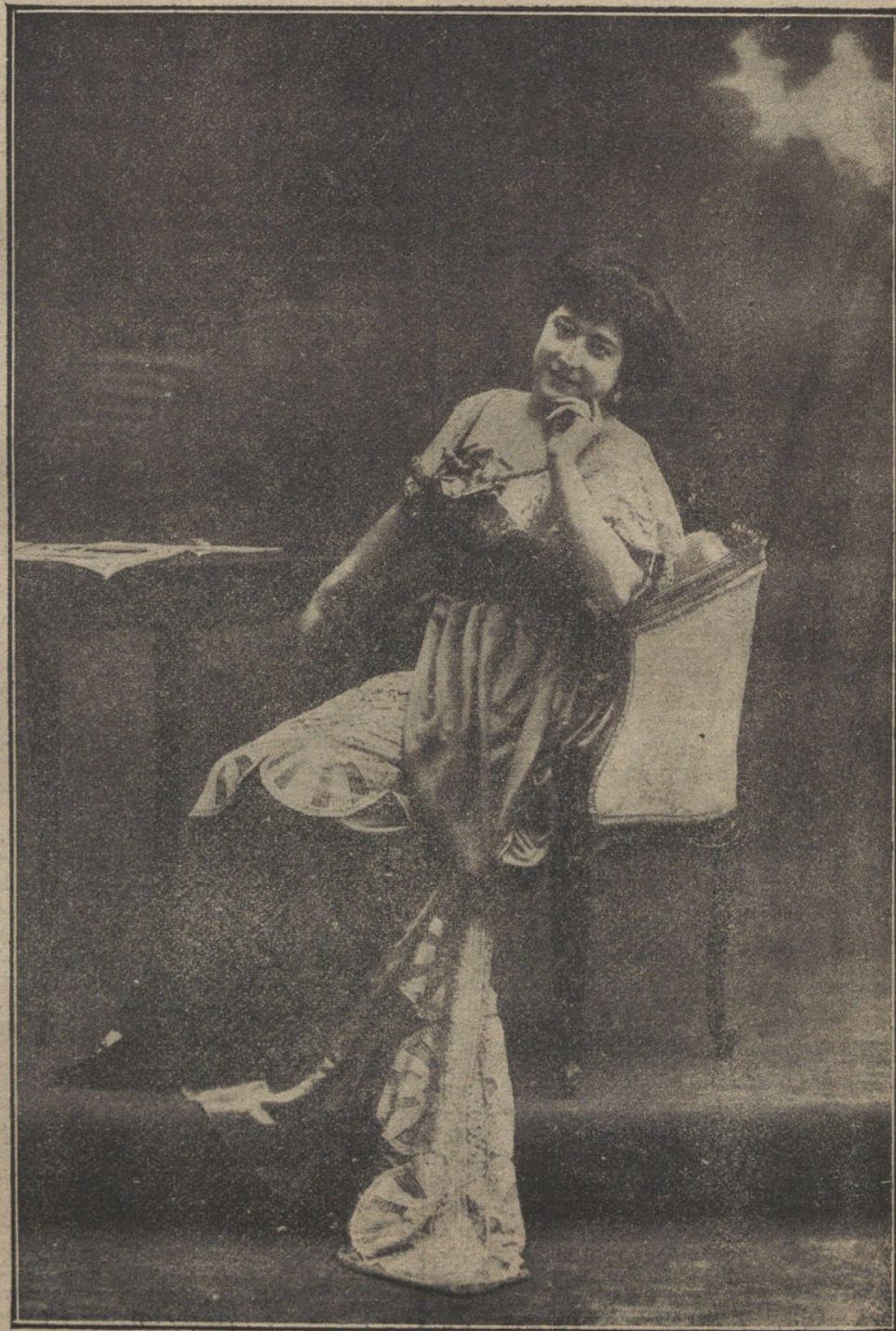
En «La generala». Primer gran éxito.

—Por lo que usted más quiera, Luisita; filosofías, no. Hágame usted el favor de despertar y cuéntenme cosas suyas.