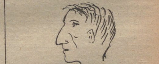
MI TIO, por Andrés Domenech (cinco años)