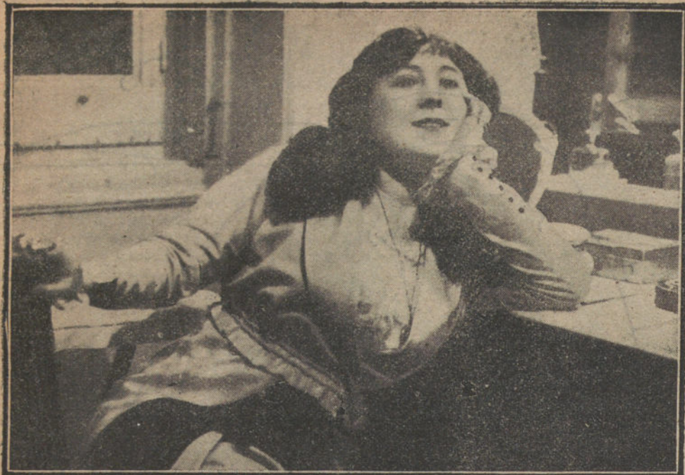
La primera tiple del Gran Teatro "Paseña", sentada en su cuarto.