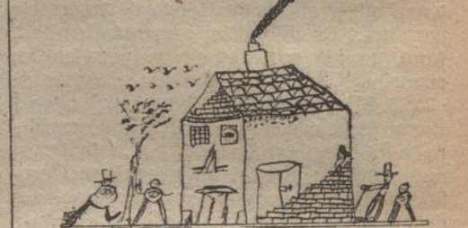
LA CASA DEL DUENDE, por Antonio López (diez años)