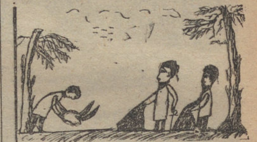
MIS PRIMOS JUGANDO AL TORO, por Consuelo Hernández (ocho años)