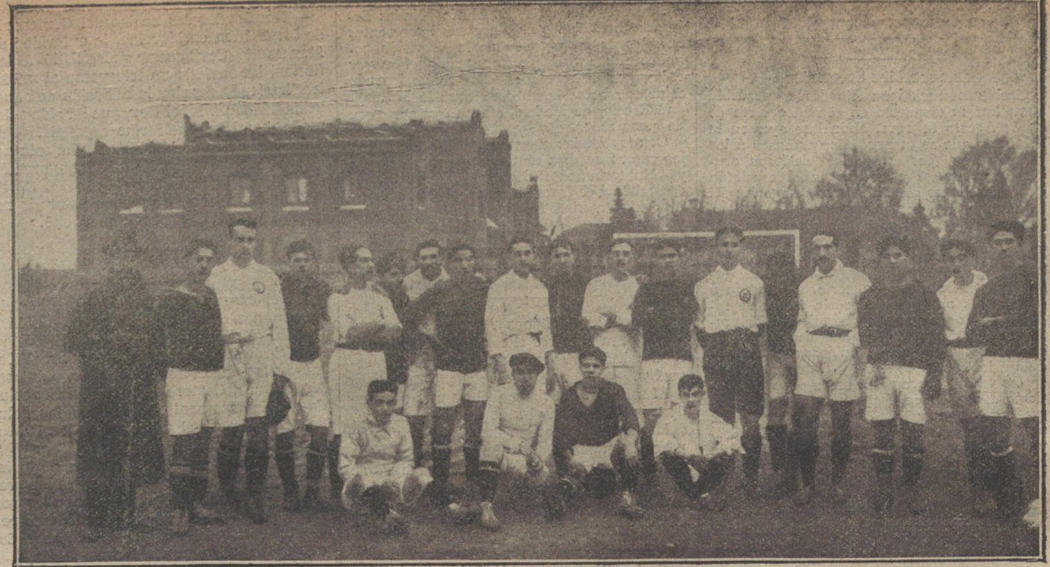
El equipo catalán «España» y el madrileño «Madrid F. C.», que han jugado en el campo del segundo interesantes partidos.

Dicha pulsera era propiedad de la víctima, y ha sido remitido a Barcelona para