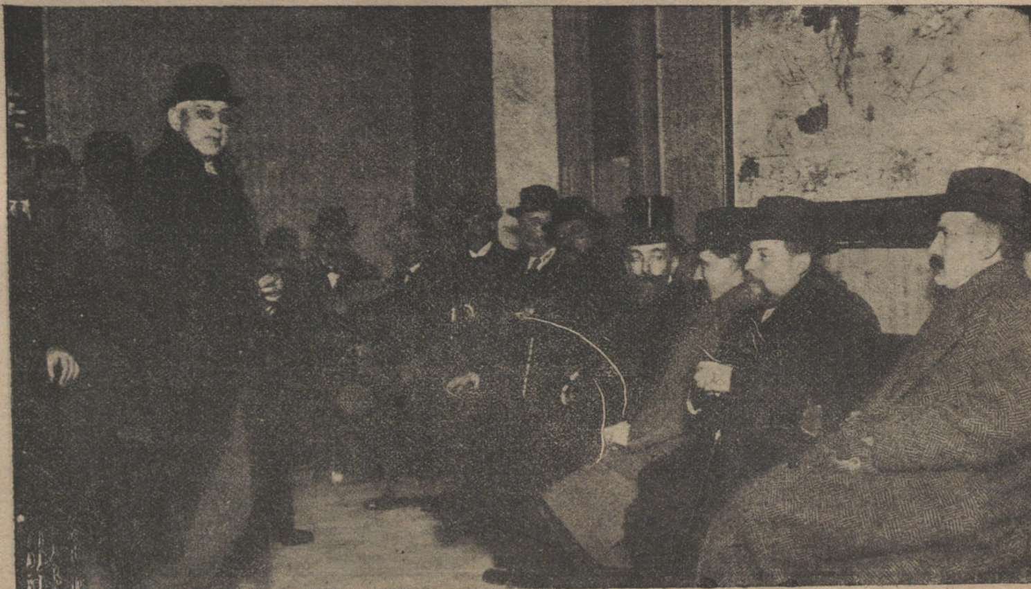
Los empresarios de espectáculos de Madrid, reunidos esta tarde en el Gran Teatro.

Caso de no aceptar los obreros esta propuesta, los patronos irán al lock-out el sábado próximo.