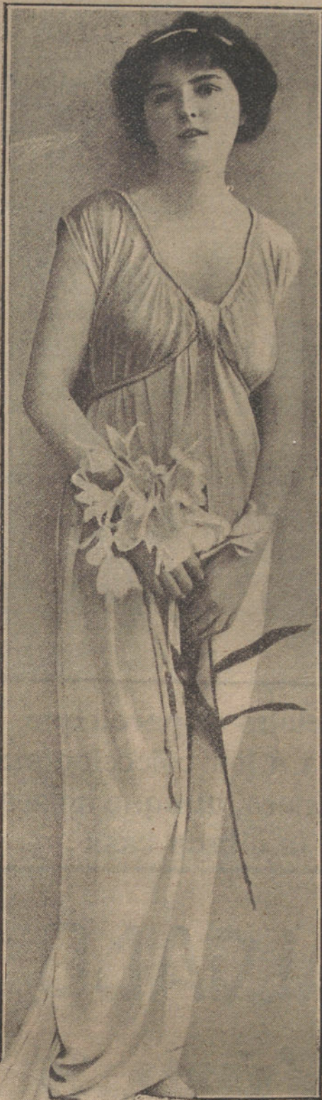
El Arte y la Belleza en el mudo

competir en el gran torneo mundial. A competir y a «vencer», que no es lo mismo.