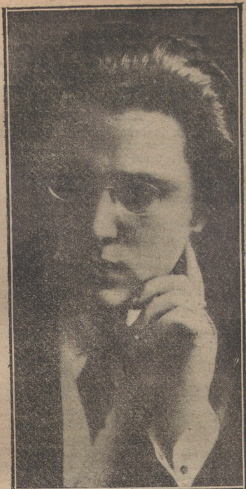
El maestro Nin, que dará un concierto en el teatro de la Comedia, mañana