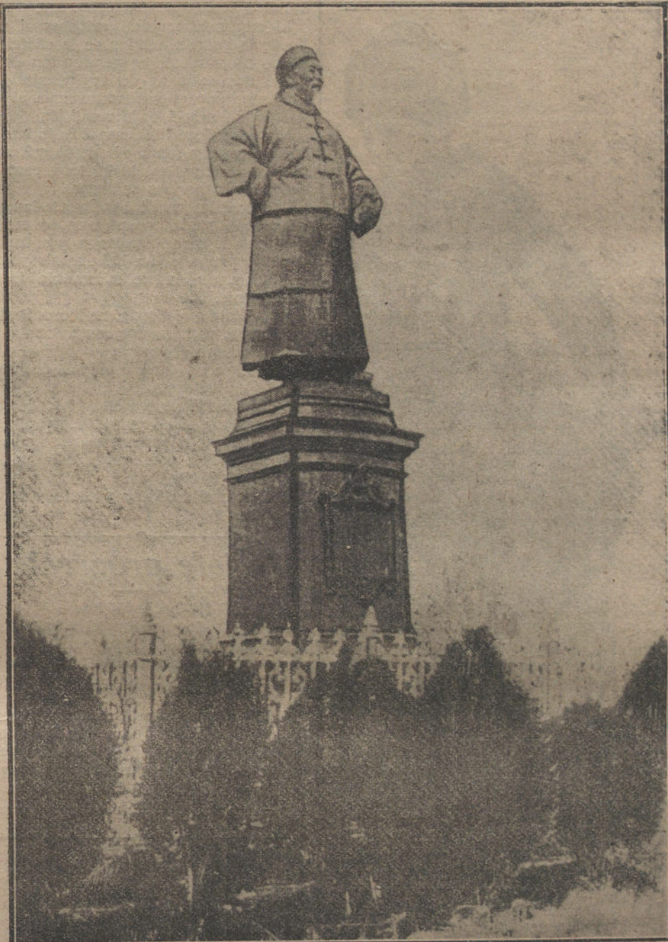
En Shanghai acaba de descubrirse la estatua del célebre estadista chino Li-Hung-chang. Este es el primer monumento que, al estilo europeo, se ha levantado en China