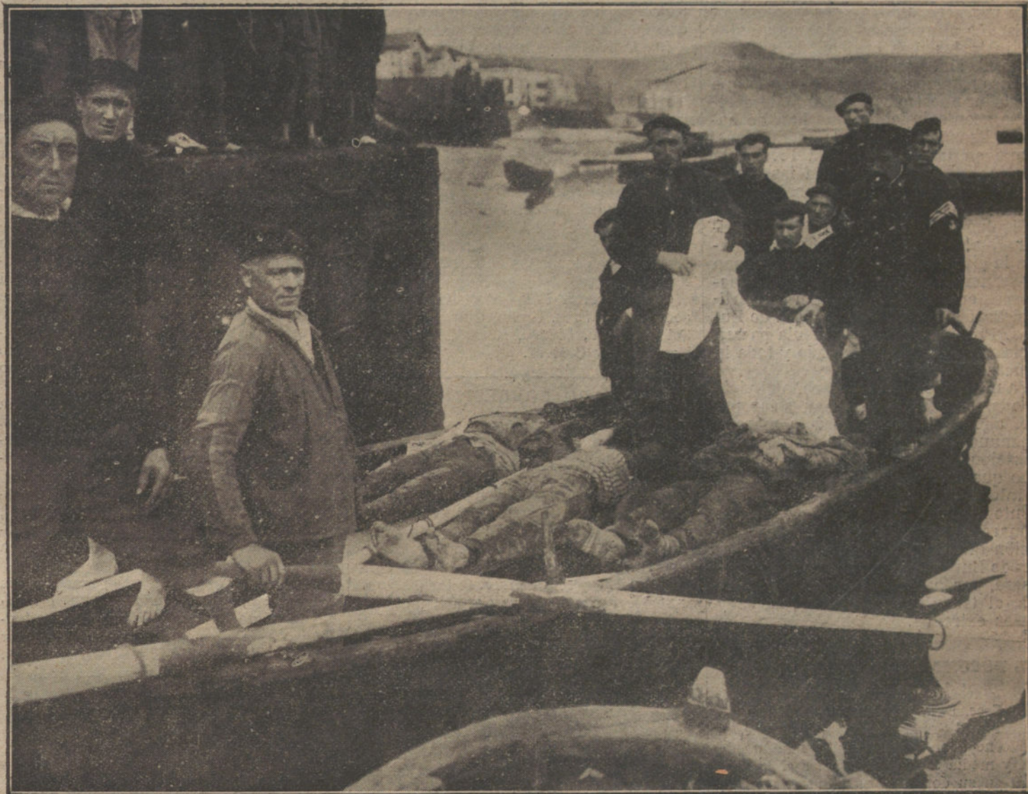
LA CATASTROFE DE FUENTERRABIA. — Conducción de los cadáveres al puerto.

En un país que, cual España, vive hace siglos en constante desequilibrio, las fuerzas conservadoras tienen una misión mucho más sagrada que cum-