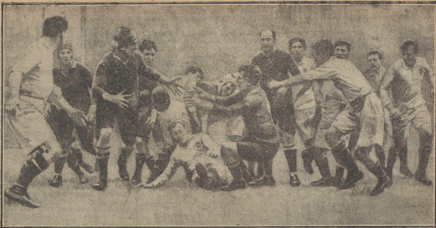
EL BALOMPIE A TODO TRAPO.—Un momento emocionante del partido de «rugby», que ha jugado el equipo «Sur de Africa» contra el de «Selección del Club Inglaterra»