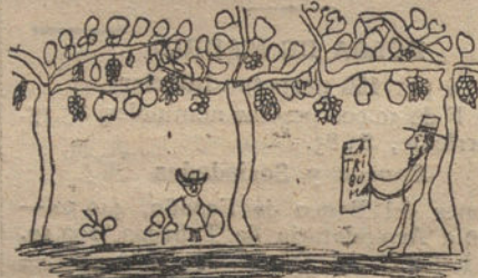
PARRAL EN LANJARON, por Amalita Noguera (siete años)