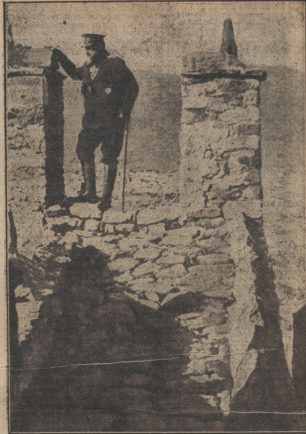
El zar de los búlgaros marcando la parte de Macedonia que corresponde a Bulgaria sobre las ruinas de la fortaleza de Kavala, en la antigua Necrópolis de Filipo y de Alejandro

En las páginas de este libro, Gómez Carrillo ha puesto toda la sensibilidad de su alma artista y toda la observación de su juicio analítico. Para mí el principal mérito de «El Japón heroico y galante» está en la perfecta síntesis que de ese pueblo admirable ha hecho Carrillo. La vena, la corriente que ha dado nueva vida al pueblo héroe se ha alimentado de su formidable estoicismo, de su sutil sentimiento estético, de su profunda admiración a la mujer, su gran respeto a la leyenda y su aguileteado espíritu de justicia. Todos esos aspectos, Gómez Carrillo, lisa y llanamente, siempre a través de su temperamento, los ha llevado a este su último libro, tan vario como bello en sus distintos motivos. El ejemplo del Japón es uno de los ejemplos a imitar sin limitación de ningún género: cada japonés ha tenido para sí el que la mejor de todas las victorias era la que se conseguía sobre uno mismo, y esta educación de la voluntad individual ha creado una fuerza colectiva invencible y por varias causas respetable. Al hojear las páginas del libro de Carrillo, poniendo al servicio de sus pintorescas narraciones toda mi credulidad, confieso haber sentido la vibración de mis pasiones. No es posi-