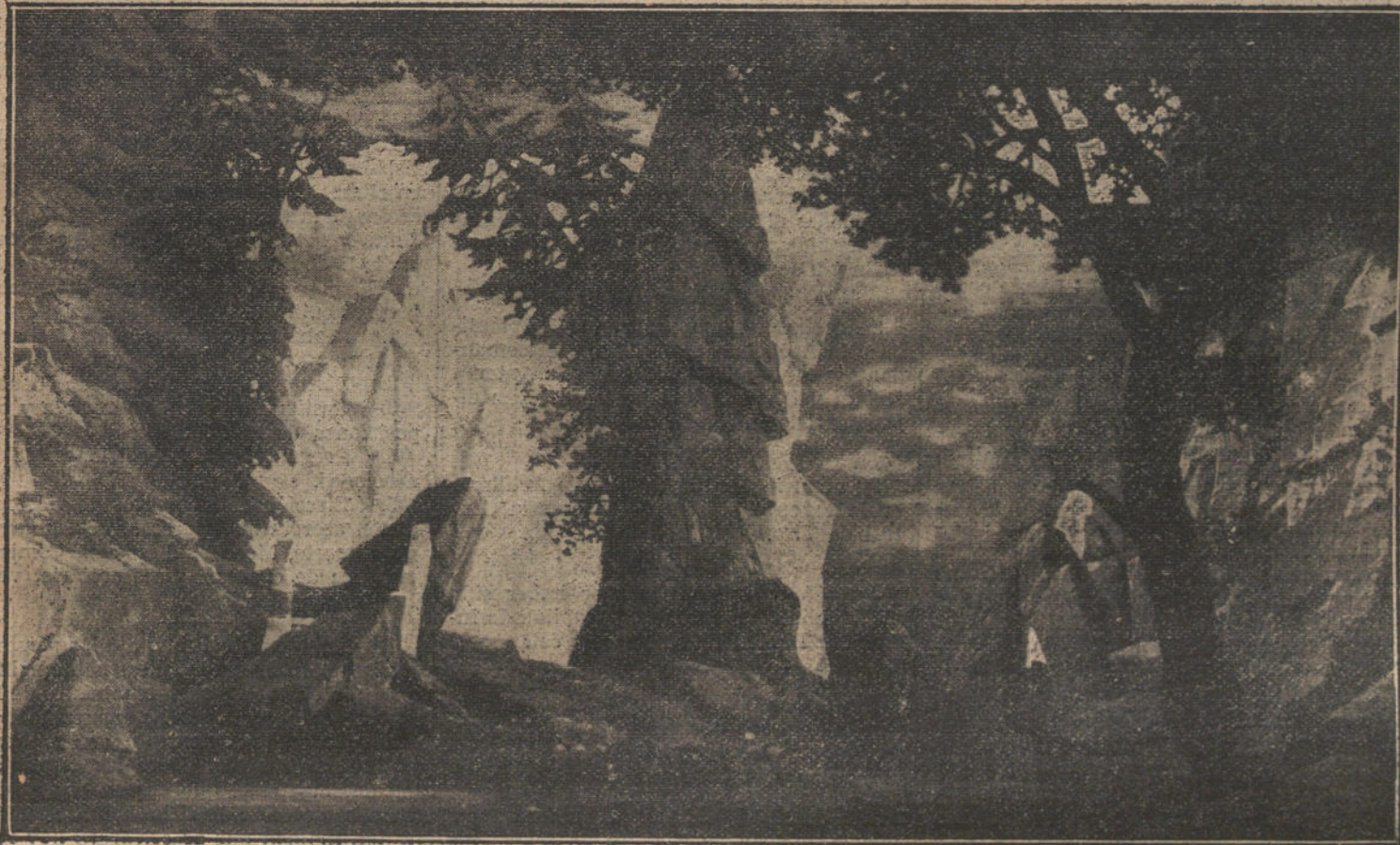
EN EL REAL.—Decoración pintada para el estreno de la ópera «Der Freischütz».