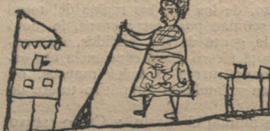
MI MAMA BARRIENDO LA COCINA, por Antonia Bermejo (cinco años)