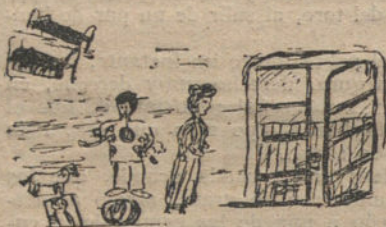
YA VIENEN LOS REYES, por Luis Franco (once años)