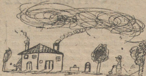
CASA DE PEON GAMINERO, por Manuel Caro (diez años)