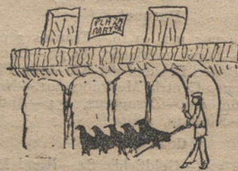
EL PAVERO, por José Núñez (once años)