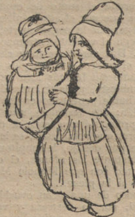
UN TIPO HOLANDES, por Natividad Díaz (diez años)