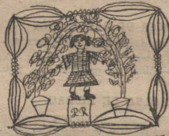
MI HERMANA DIGIENDO VERSOS, por Joaquina Rodríguez (once años)