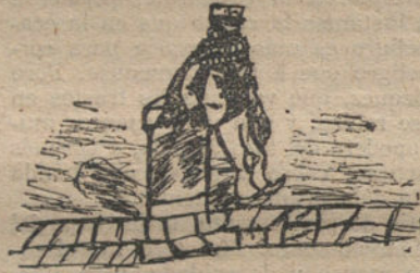
ESPERANDO LA CARGA