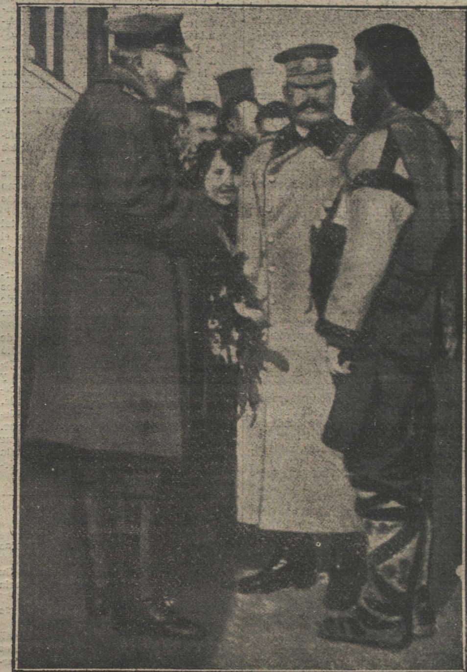
El zar de Bulgaria, recorriendo el campo de operaciones de su Ejército, ha tropezado en una estación ferroviaria con el peligroso revolucionario búlgaro llamado «El rey de las montañas» y ha conferenciado con él mano á mano

quía, pero no los encontraréis en Inglaterra, la nación más progresiva y más tradicional del mundo.