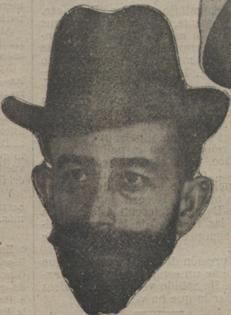
EL MAESTRO RABL