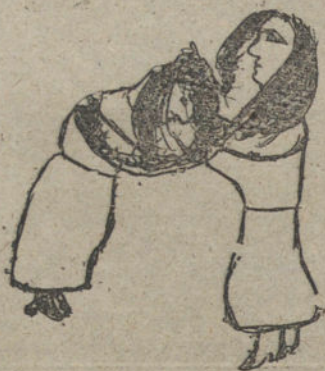
LA TRANQUILIDAD DE MIS VECINAS, por Leonor Fernández (nueve años)