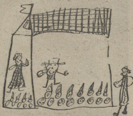
SI LA QUIERE LA LLEVA Y SI NO LA DEJA, por Rosario Bugallo, (diez años)