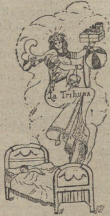
LO QUE SUEÑO TODAS LAS NOCHES, por Arturo Buzón (trece años)

Además, entre los coleccionistas, sean ó no compradores de la casa Salgado, se sortearán ONCE MAGNÍFICOS RELOJES DE PARED.