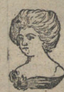
Madame Giral á los 65 años

LA MUJER recobra y conserva la pureza del cutis aplicándose cáscara de huevo igual á la muestra, que con el procedimiento para prepararla entrega por 25 céntimos la PERFUMERIA DE FORTIS, Puerta del Sol, 2; y á los de provincias, remitiendo 40 céntimos á PEREZ MARTIN y Compañía, Alcalá, 7, Madrid.