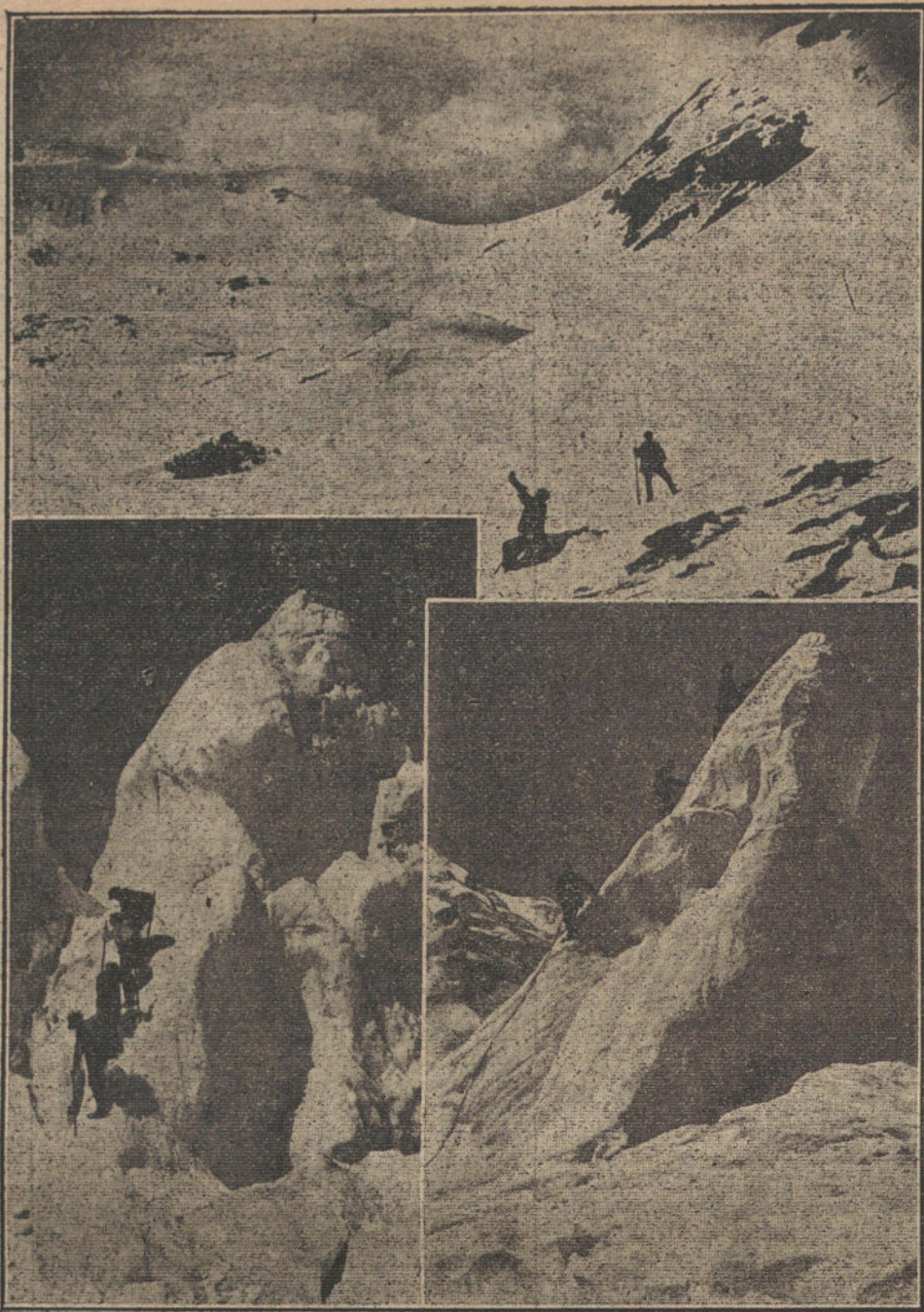
DEPORTES DE INVIERNO.—El valle de Arán, cubierto de nieve.—Ascensiones peligrosas en Chamonix

Ha amainado el tiempo, habiendo reanudado sus ejercicios la guarnición de la plaza y las fuerzas del campo exterior.