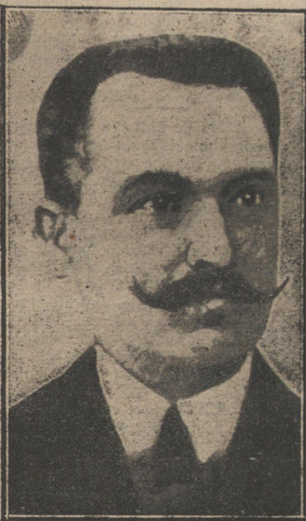
LA CRISIS FRANCESA.—M. LEBRUN, nuevo ministro de la Guerra

Se cree que mañana, en Versalles, el número de votantes que darán sus sufragios á M. Raimundo Poincaré se elevará á 423, contra 380 que podrá sumar su antagonista,