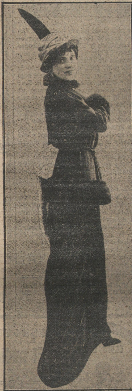
Modelo de invierno