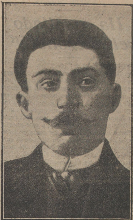
LA CRISIS FRANCESA.—M. René Besnard, nuevo ministro de las Colonias

por el foro para sujetar opiniones propias que, por ser nuestras, no encierran tanto interés como aquellas ajenas que desfilarán por las columnas de este periódico en días sucesivos.