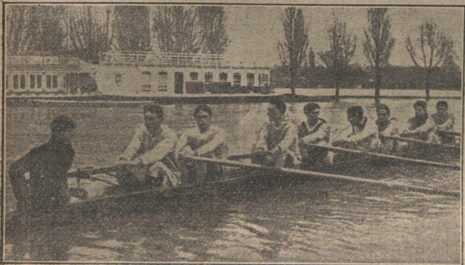
El primer equipo de regatas á remo de la Universidad de Oxford, preparándose para la reunión de Primavera

En la página 8 publicamos el cupón de EL PEDIDO DE LA TIENDA