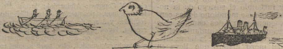
EN EL ESTANQUE DEL RETIRO, por Enrique Prado.—UN PAJARITO, por Gonzalo Camino.—EL «CATA LUNA», por Teresa Alonso