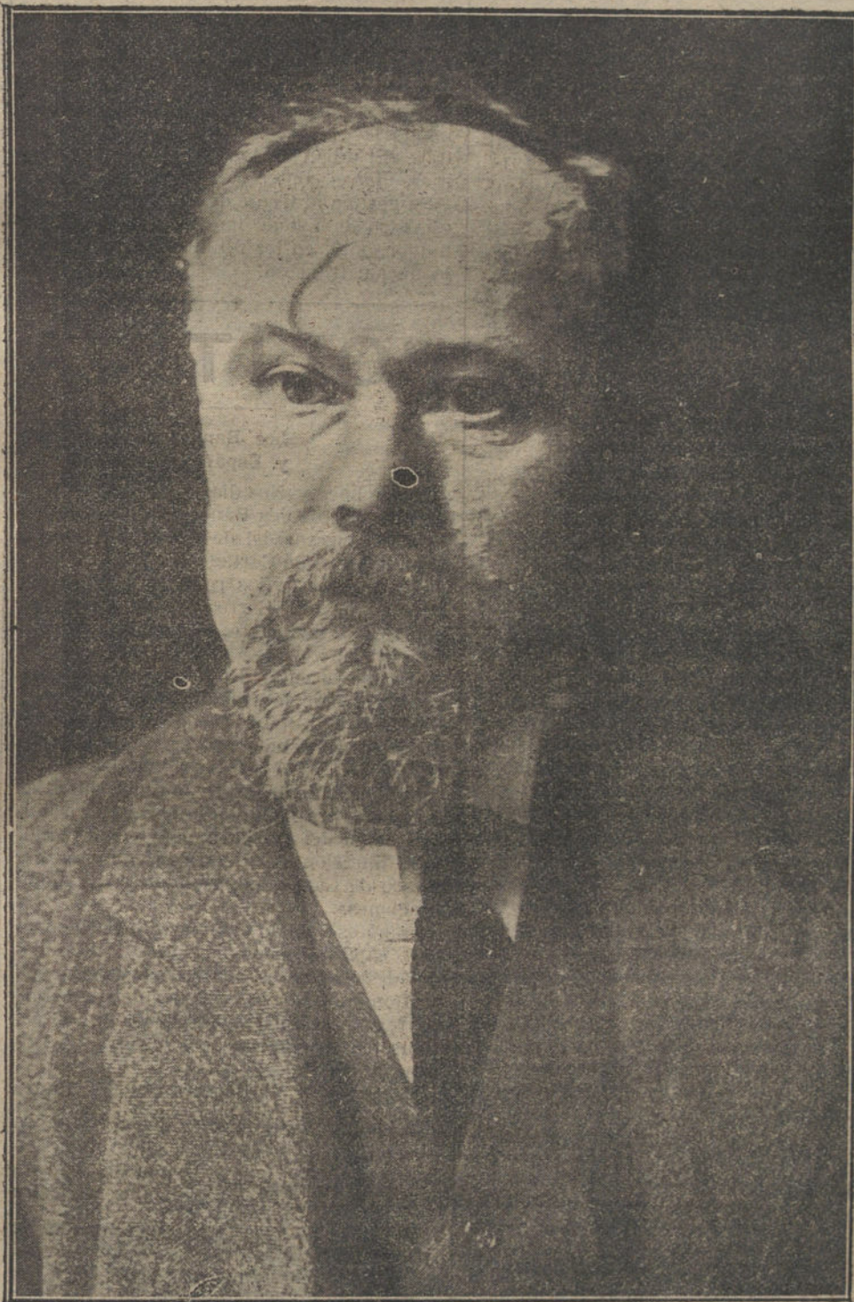
POINCARÉ, que ha sido elegido presidente de la República francesa, en las elecciones verificadas esta tarde

En la nación francesa, y dado lo crítico de las circunstancias, existe un gran desasosiego, deseándose conocer quién será el candidato triunfante, si M. Pams ó M. Poincaré, pues los programas de ambos candidatos son totalmente opuestos en lo que se refiere a política internacional, pues la nación francesa juzga mucho más templado y