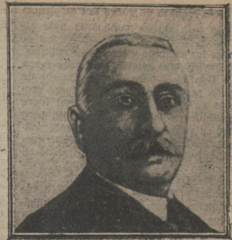
PAMS, que ha seguido a Poincaré en número de votos

El presidente del Consejo contestó a los comisionados que no podía complacerles por no ser éste su modo de ver y que la Asamblea nacional resolverá mañana, en último término