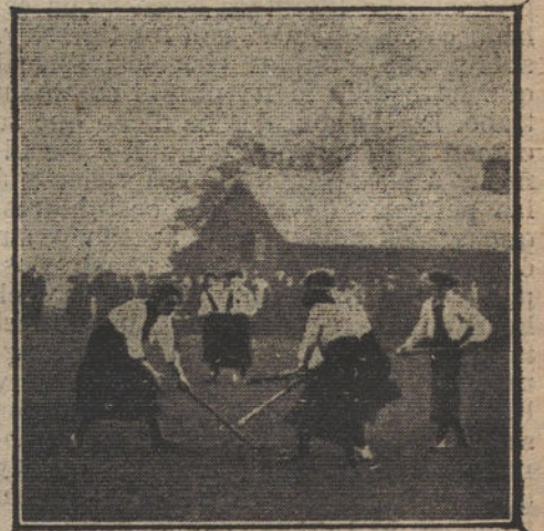
Un gran partido de «hockey» jugado en Richmond, entre dos equipos formados por señoritas pertenecientes a la mejor sociedad de Sussex y Middlesex

He aquí, amados currinches, el argumento de una estupenda zarzuela. ¡Sus y a