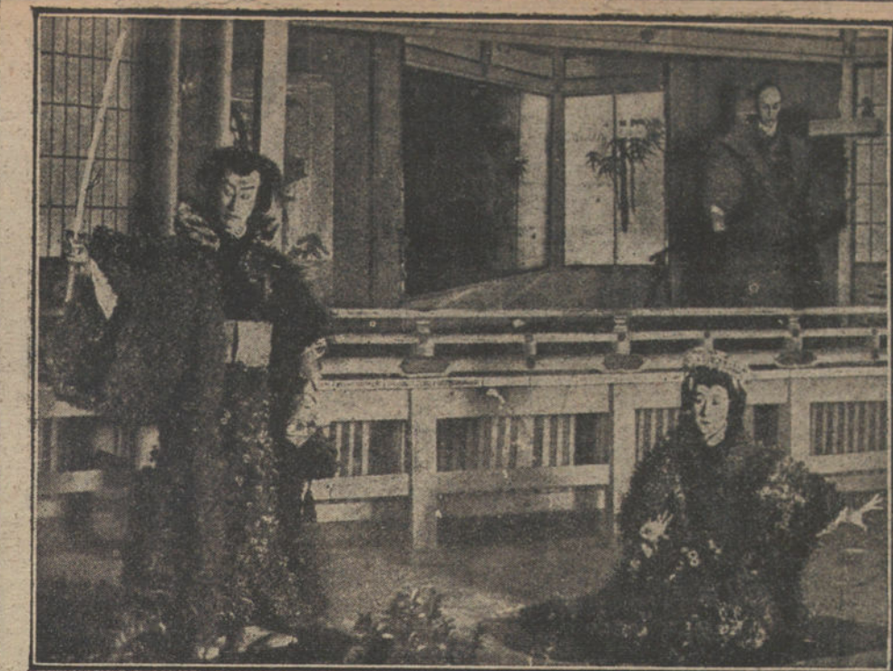
Una fantasía de la Horticultura nipona.—Plantación y floración de crisantemos sobre armaduras humanas

El tratado es, por decirlo así, la autorización legal para el desenvolvimiento de nuestra labor colonial en Marruecos; pero esta labor necesita de los mismos esfuerzos y trabajos que siempre, y estos esfuerzos y trabajos han