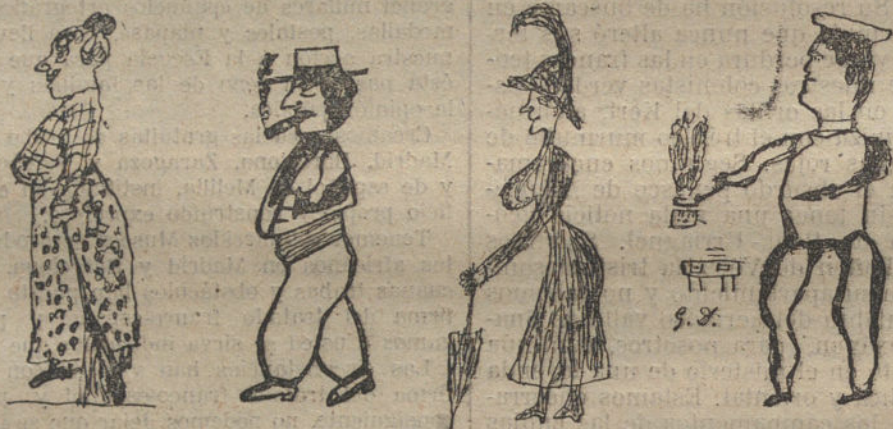
LA PORTERA DE MI CASA, por Victor Oses.—EL CHATO, por Cándido Trassorra.—UNA SEÑORITA, por Gregorio Alvarez.—EN LA GOCINA, por Pedro Aira