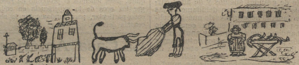
UNA ALDEA, por Ramón Tonado.—LA AFICION, por Encarnación Muñoz.—LA CHURRERA, por Isabel Sánchez Morales