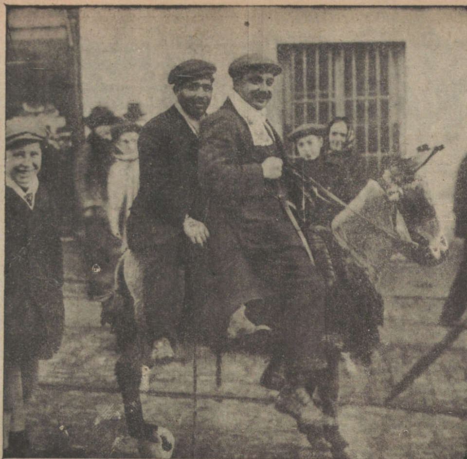
Un detalle de la pintoresca romería de San Antón

Hasta el día 21 del corriente mes se admiten proposiciones, en la Secretaría de la Corporación, para el suministro á los establecimientos de la Beneficencia provincial, de los siguientes artículos: tocino, garbanzos, maneca, bacalao, café, merluza, ternera, sal aios y cebollas.