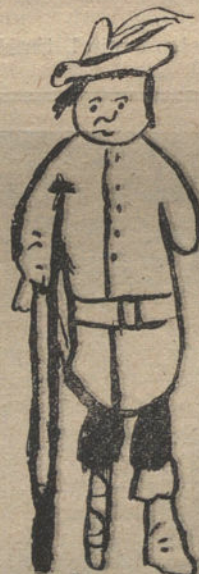
UN COJO, por Ricardo Coca (nueve años)