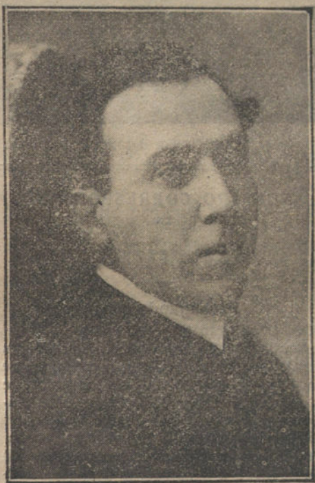
ANTONIO MACHADO, poeta para quien se ha pedido a la Academia el premio Pastenratsh, por su magnífico libro «Campos de Castilla»

por los embajadores de todas las potencias al ministro de Estado turco.