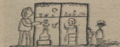
MI ABUELITO HACIENDO JARABE, por Julianito Mateos