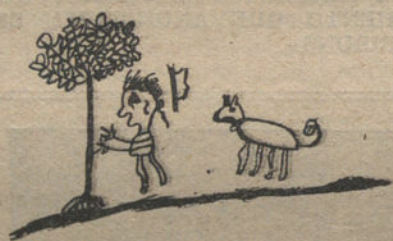
MI PERRO «CLAVEL», QUERIENDO MORDER A UN MALETA, por Pedro Hurtado