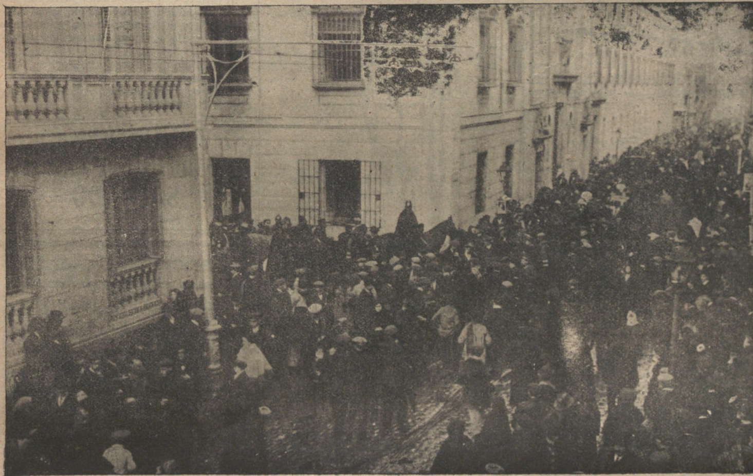
LA FIESTA DE SAN ANTON.—Aspecto de la calle de Hortaleza durante la tradicional bendición de la cebada

Formóse el inventario y los contadores hicieron la partición, no adjudicando bienes á los herederos de sexto grado, por no existir ningunos que procedieran de la línea materna á la que estos herederos pertenecían.