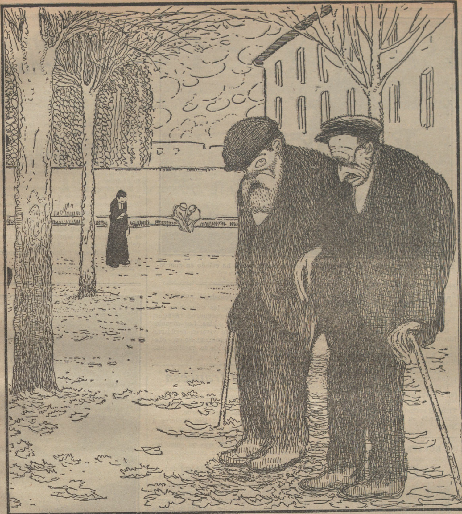
EN EL ASILO DE INVALIDOS

—Oye, tú; dicen que van á licenciar á muchos viejos, que vendrán aquí. —¿Y crees que nos acortarán la ración? —No; los que entran vienen bien alimentados.