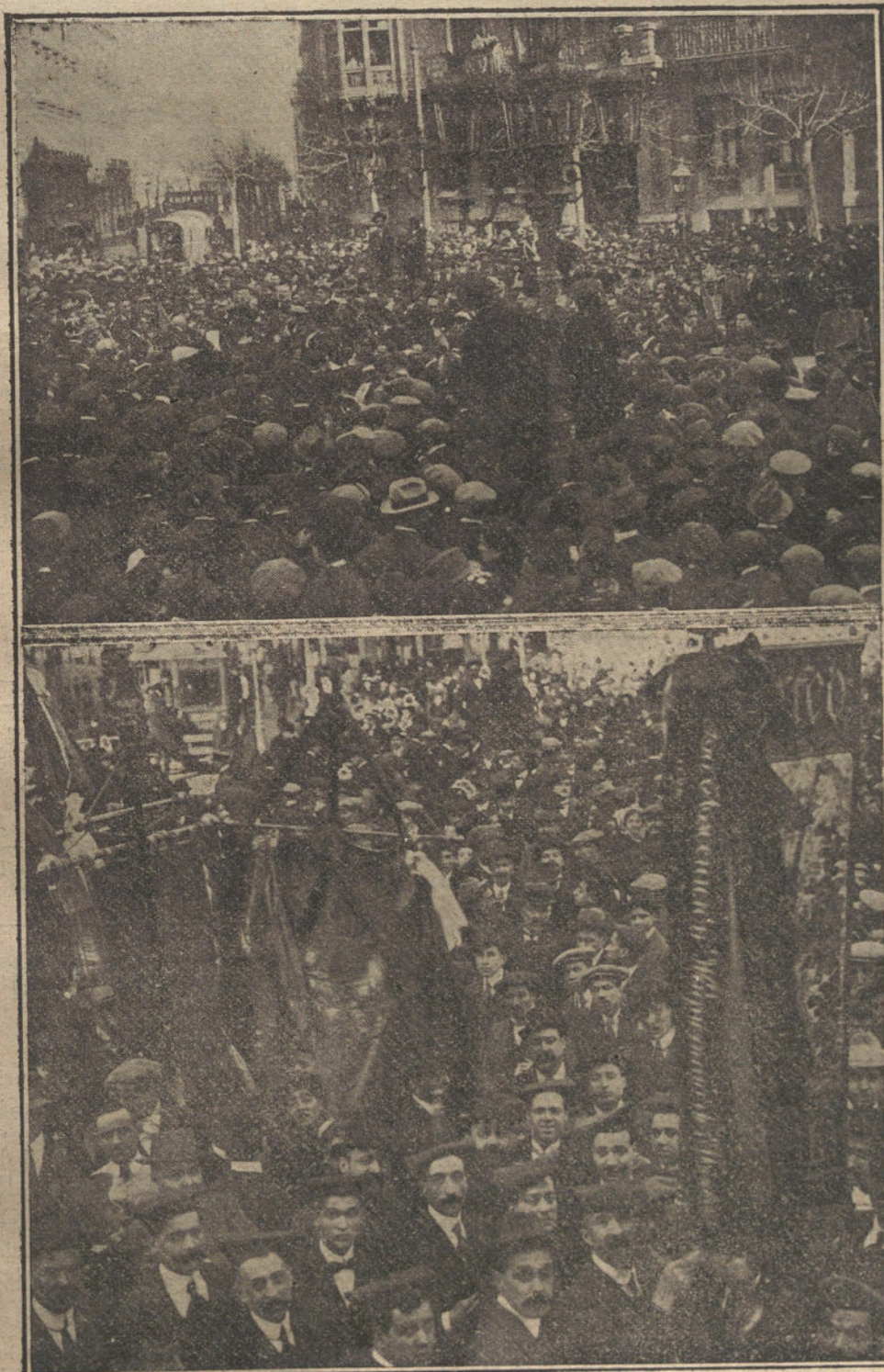
EL ORFEON BILBAINO EN BARCELONA.—Los orfeonistas durante el concierto dado junto al monumento á Clavé. Estandartes de las Sociedades corales de Barcelona, que acompañaron al Orfeon Bilbaino.

—S. M. la Reina doña Victoria ha enviado la cantidad de 1.000 pesetas, con destino á la casa de España en Larache.