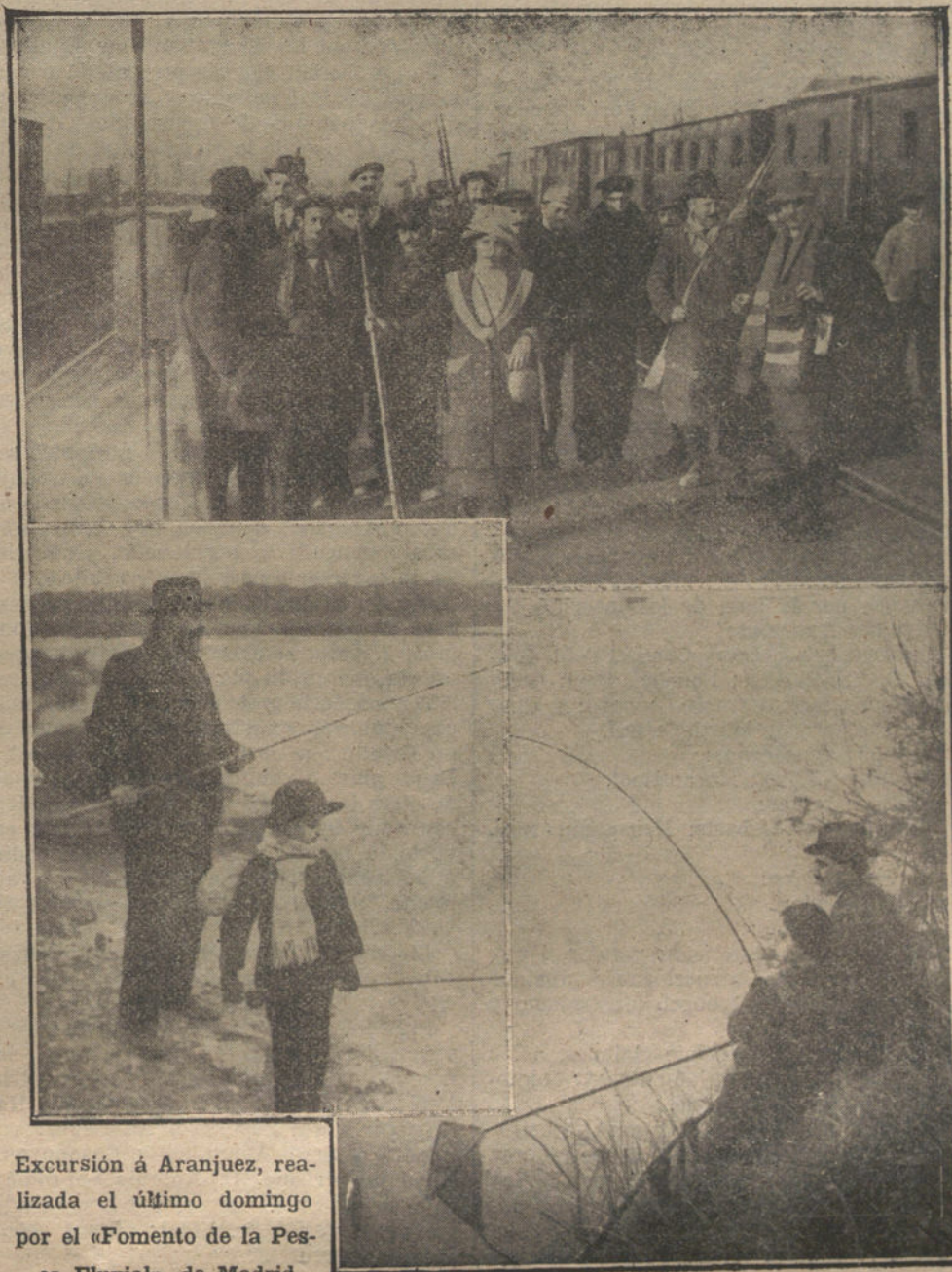
Excursión a Aranjuez, realizada el último domingo por el «Fomento de la Pesca Fluvial», de Madrid