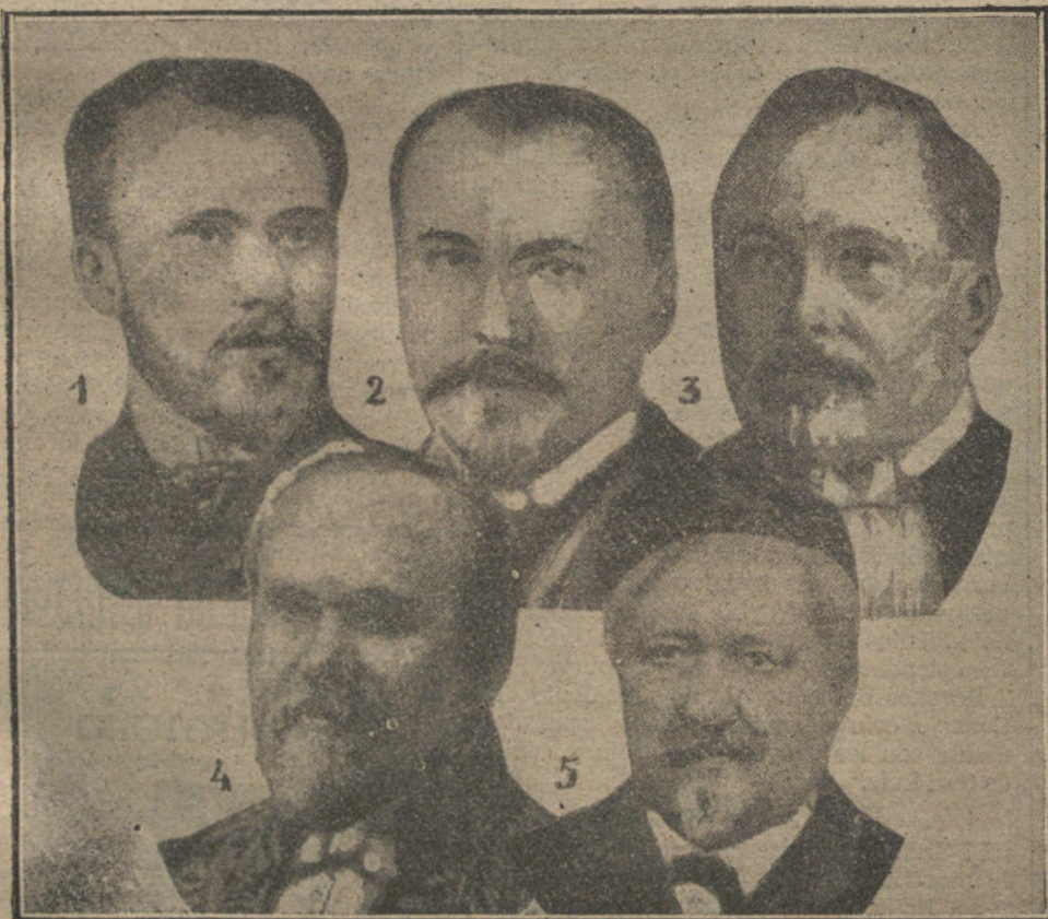
EL NUEVO PRESIDENTE DE LA REPUBLICA FRANCESA.—(1) Poincaré, en 1887 primera vez que fué diputado. (2) Poincaré, ministro de Instrucción pública. (3) Poincaré, abogado. (4) Poincaré, académico. (5) El padre de Poincaré.

Todos aque los de nuestros lectores que hubieran hecho compras en CASA DE SALGADO , Carmen 4, el DIA 19 del pasado Diciembre, pueden pasar á recoger el importe íntegro de ellas