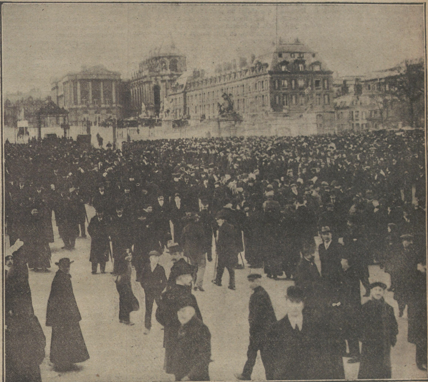
LAS ELECCIONES PRESIDENCIALES EN FRANCIA.—La muchedumbre delante del Palacio de Versalles, esperando el resultado de la votación.

Se expresará en el teatro, en el que hay actualmente como una cargazón eléctrica, fuerzas decorativas excesivas, distintas, sutilizaciones de todas las ar-