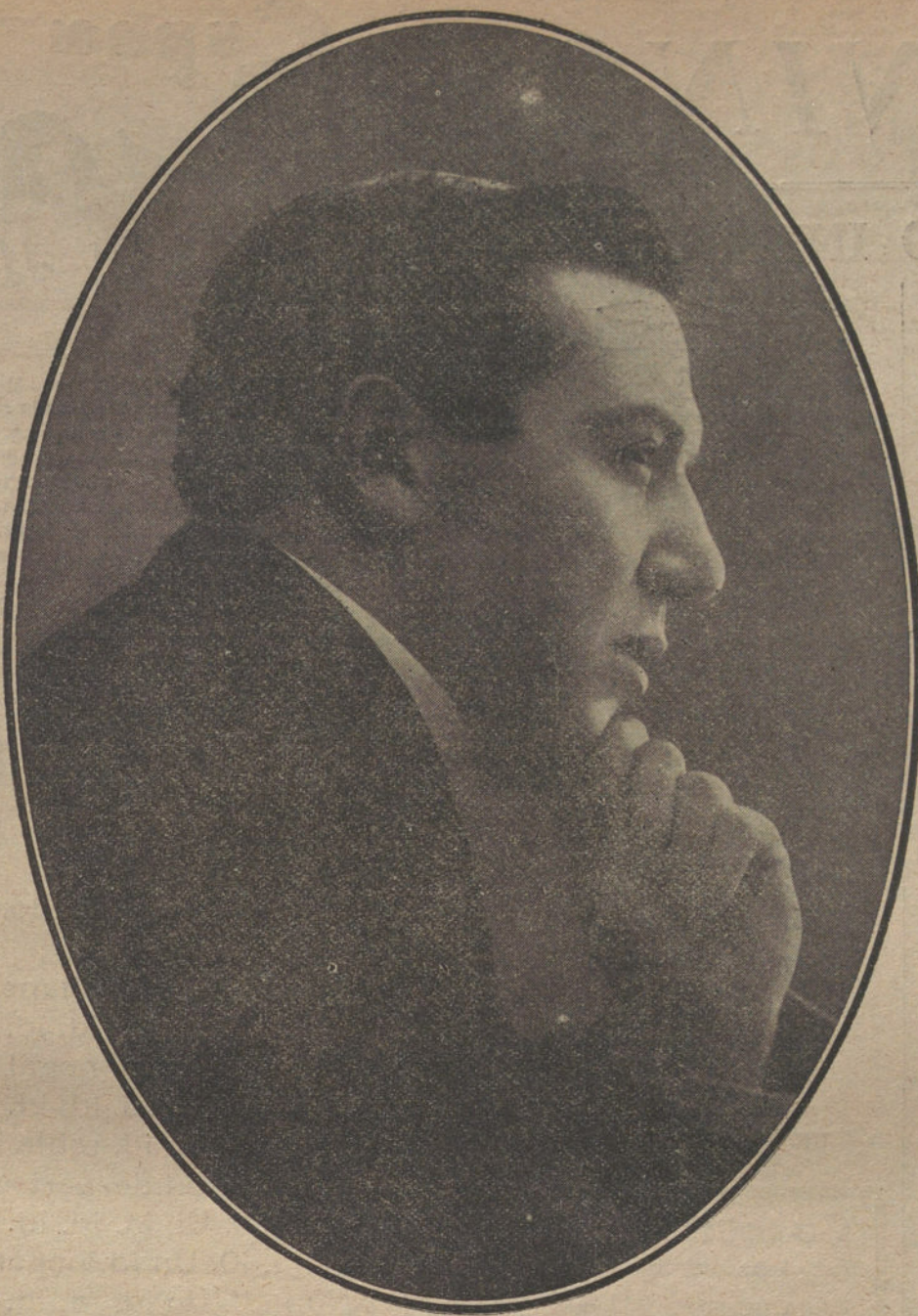
FRANCISCO FUENTES, primer actor del teatro Español, que anoche obtuvo un éxito personal en la obra «Sobrevivir»

Con un asunto «venerable» y con procedimientos inocentes, han escrito los señores