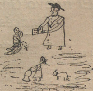
VISPERA DE REYES Y DIA DE REYES, por Alfonso Reyes Senén (diez años)