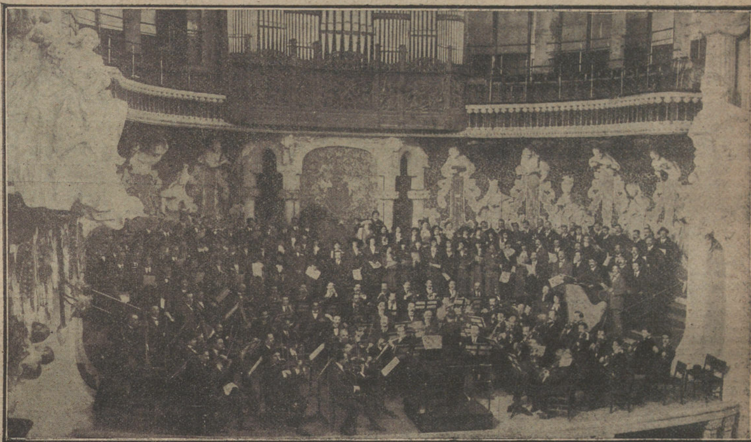
EL ORFEON BILBAINO EN BARCELONA.—Aspecto del Palacio de la Música Catalana, durante el concierto dado por la Sociedad coral de Bilbao y la orquesta del teatro Liceo.