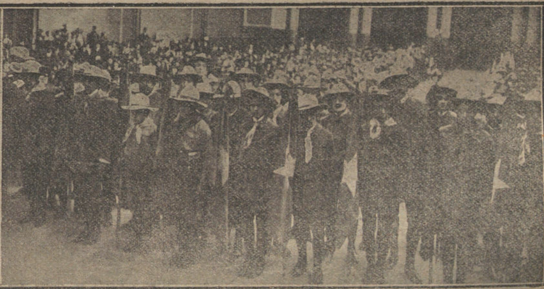
LOS EXPLORADORES DE ESPAÑA en el Palacio de Bellas Artes, de Barcelona, con las banderas de las distintas secciones. Desfile por el Parque de los 800 «boy-scouts», con los nuevos escudos.