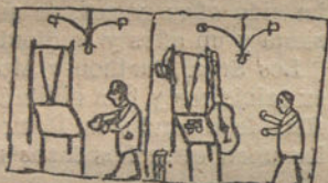
CASTIGADO POR MALO, por Clara Vila- plana (once años)