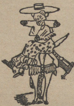
UN SOLDADO, por Juan Serra