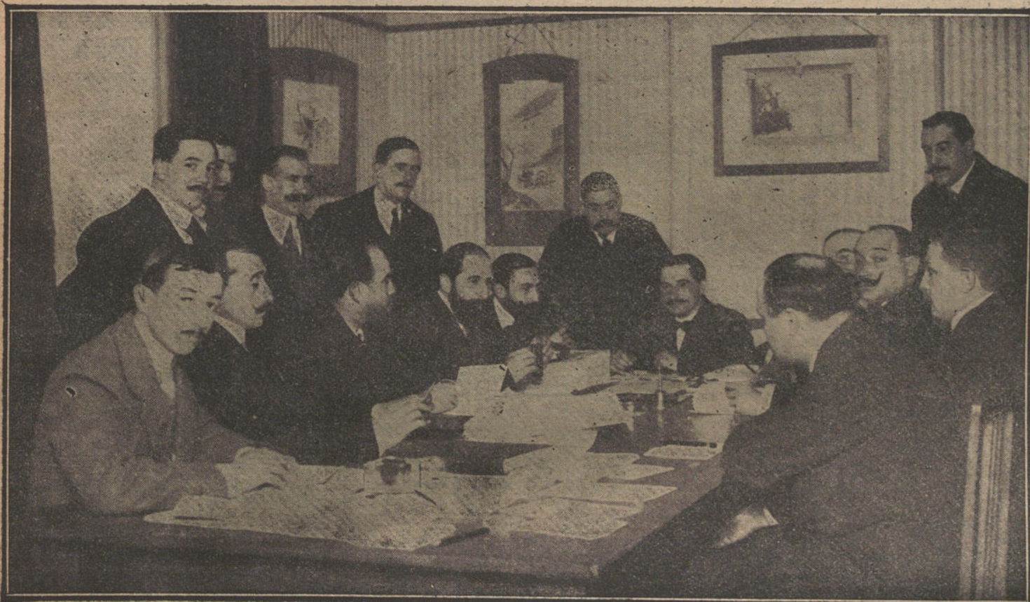
Aspecto de la Cámara Sindical Española del Automovilismo, en la reunión que celebró el viernes último para protestar y pedir la modificación del reglamento del Gran Premio del R. A. C. E.