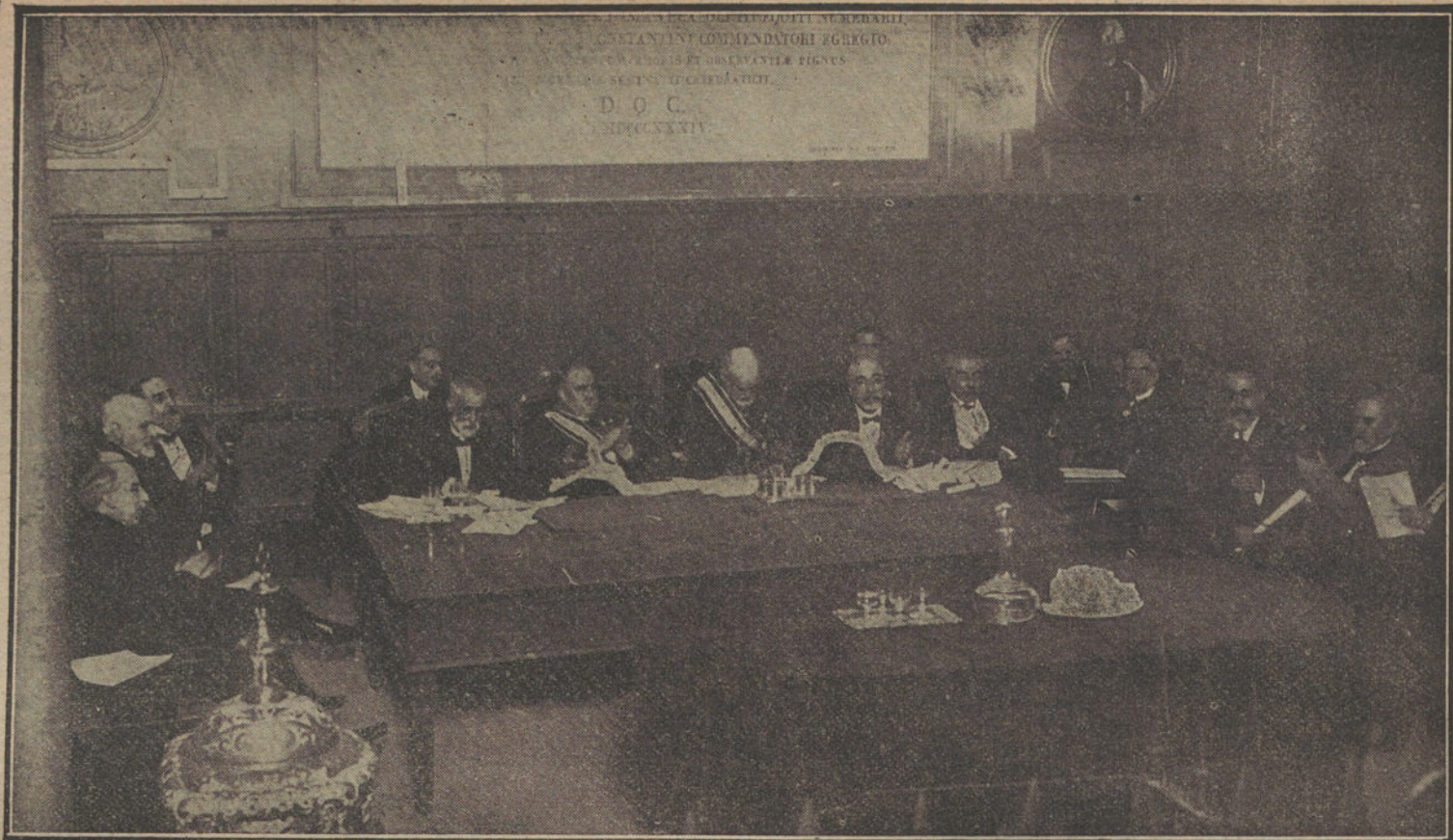
Sesión de inauguración de curso en la Real Academia de Medicina.