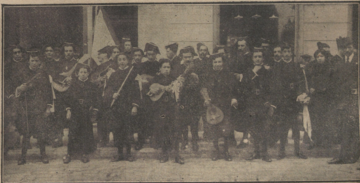
La «Tuna Jovellanos», de Oviedo, que se ha embarcado en Barcelona para Nueva-York y la Habana, donde dará varios conciertos.

El Gobierno imperial no piensa enviar otros buques de guerra al Bósforo, y sigue