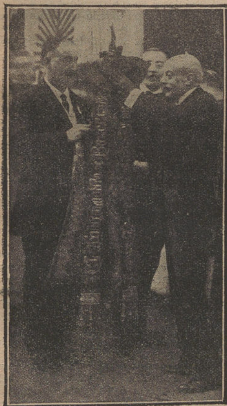
El alcalde de Barcelona colocando la corbata que ha regalado al Orfeón bilbaino. (Fot. SOLER).

El Sr. Cánovas, diciendo que se proponía continuar la historia de España,