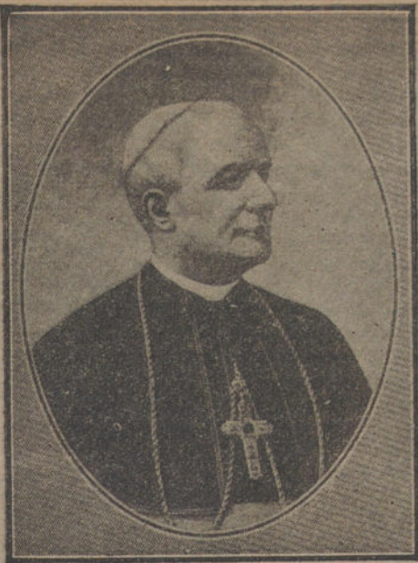
Monseñor RAGONESI, nuevo nuncio de Su Santidad en España

Rogamos a todos los artistas: poetas, pintores, actores, músicos, escultores, etc., se sirvan asistir el martes 28, a las seis de la tarde, al Café Nacional (calle de Toledo), con el objeto de tratar de la organización de una Juventud Artística y de la fundación de un periódico encaminado a proteger las Bellas Artes.