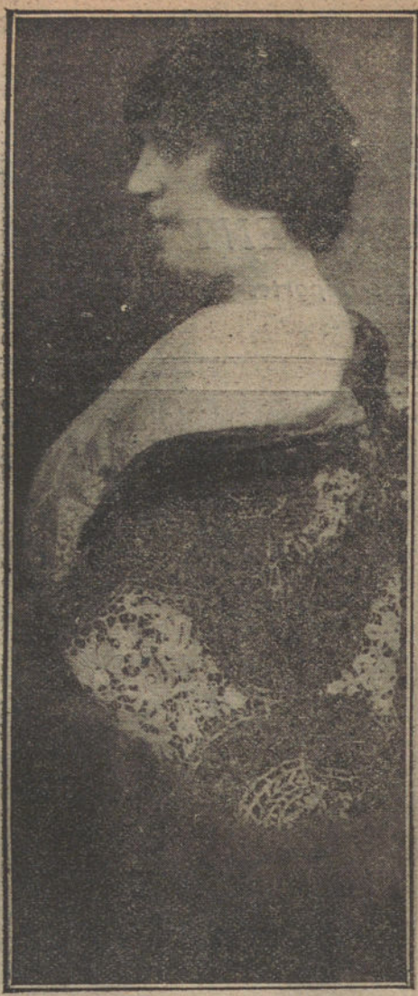
La primera actriz del teatro Español Antonia Arévalo, que por homenaje al maestro Galdós desempeñó anoche el papel de «Sor Dorothea», con mucho aplauso del público

Los dos heridos son de pésimos antecedentes.