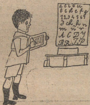
¿ES APRENDIENDO LAS PRIMERAS LETRAS, por Máximo Fau (nueve años).