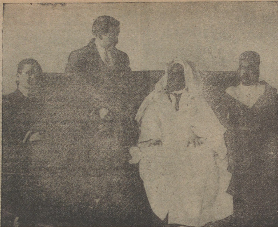
Hablando con el Almohtacen de Marruqués.

—Sí, y le aprecio. Es un bravo guerrero. Al venir a España pasé por Larache, para saludarle; pero me dijeron que estaba en España. Ahora, cuando regrese a Marruqués, estrecharé su mano.