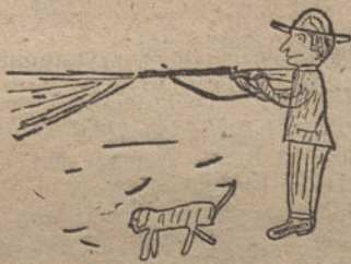
DE CAZA, por Manuel Sánchez (diez años).