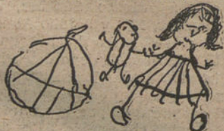
MI HERMANITO Y YO, por Elisita Arrovo (cinco años).