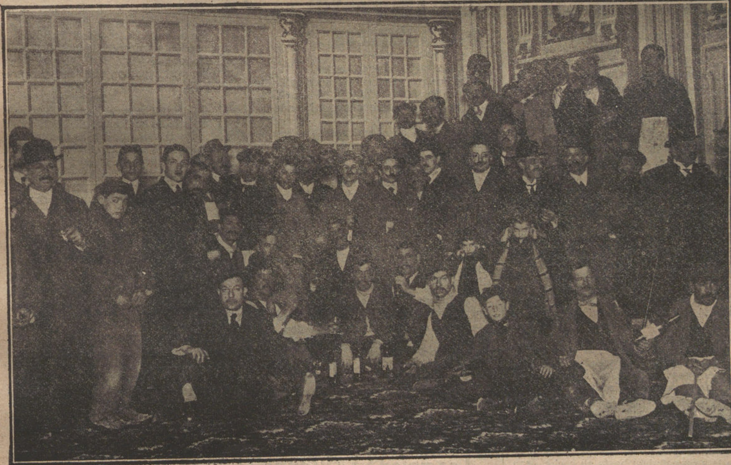
Los obreros que ayer terminaron la reconstrucción del teatro de la Zarzuela.

El intrépido aeronauta saldrá del cabo de Roca á las Azores; desde estas islas, á Halifax, en América del Norte, recorriendo, en total, 4.600 kilómetros, y necesitando para ello 3.000 kilos de esencia, y empleará en el recorrido veintidós horas, á una marcha de 136 kilómetros por hora.