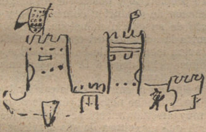
EL CASTILLO DE LA MOTA, por Bernardo Sánchez (nueve años).