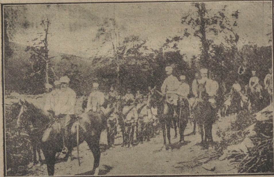
El Ejército servio.—El generalísimo Pon nit con su Estado Mayor y escolta.

El día 27 del corriente se reunieron los propietarios de balnearios y aguas minero-medicinales de España, convocados por su Asociación y bajo la presidencia del señor conde de Torre-Vélez, tratando de varios asuntos de excepcional importancia para aquella propiedad y para bien del público en general, como son el relativo á libertad balnearia; á los impuestos y tributos que dificultan el desarrollo de dicha industria; el establecimiento de billetes de ferrocarril á precios económicos en las temporadas oficiales de baños desde la estación de