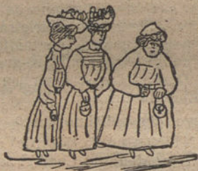
LAS DE RODRIGUEZ, DE PASEO, por Rosa Martín