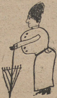
LA MUJER DEL TIO ROQUE, COCINERA DE GALLINEJAS, EN CUATRO CAMINOS, por Angel Tolosa (ocho años).