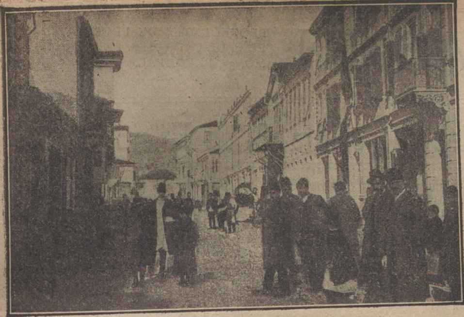
Una calle de Scutari

las piezas, todas modernas, que han cogido durante la campaña.