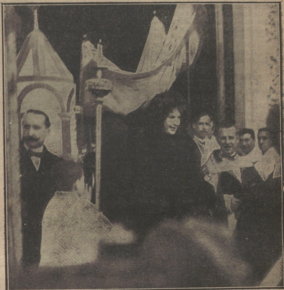
Su Majestad la Reina Victoria saliendo del templo de los Jerónimos, donde por la Junta de damas se ha celebrado esta mañana una solemne ceremonia en sufragio de los militares muertos en campaña.