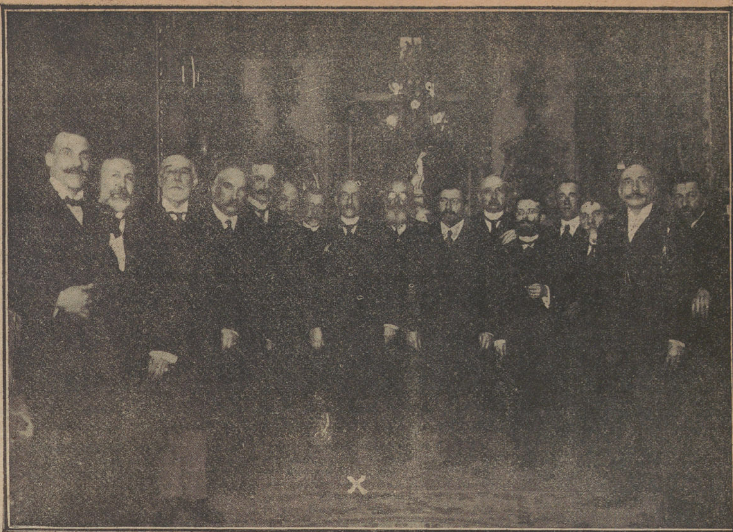
Junta nacional del partido tradicionalista, reunida ayer tarde, bajo la presidencia del marqués de Cerralbo (x), en su palacio.

La Sociedad Económica ha contestado agradeciendo y aceptando las buenas disposiciones de los comerciantes de Pau.