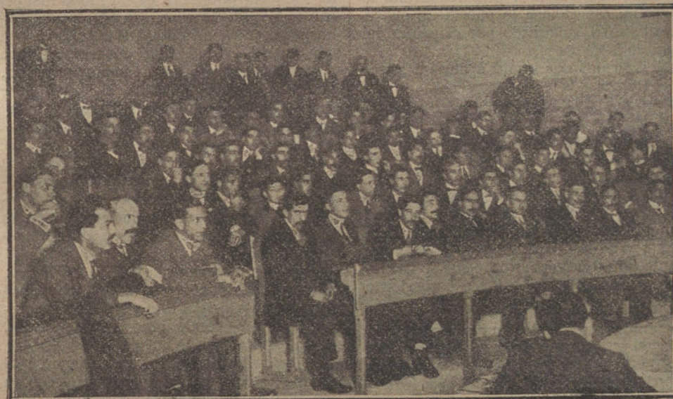
EL MITIN MEDICO-ESCOLAR, celebrado en Barcelona para recabar el apoyo de los estudiantes de aquella Facultad de Medicina, para conseguir del Gobierno el pago de los médicos titulares por el Estado.