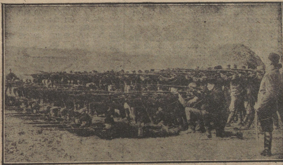
El Ejército servio.—Prácticas de tiro por las tropas de tercera línea.