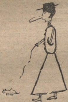
MI SEÑORA DE COMPANIA, por José Jover (once años).

Todos los juguetes del concurso infantil están adquiridos en el Bazar X Calle Espoz y Mina