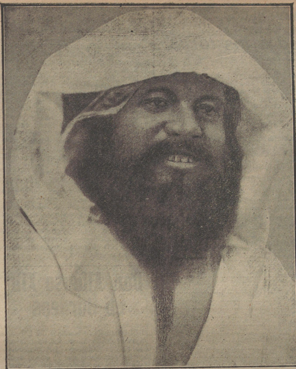
RAISULI, amigo de España

Por eso, considero que es una política contraria á los intereses de España y á la que ya han comenzado á practicar los franceses en su zona la que hemos emprendido contra el Raisuli, restándole autoridad entre sus cabileños, aunque sea con el propósito de ampararles en su resistencia al pago de los tributos que aquél les