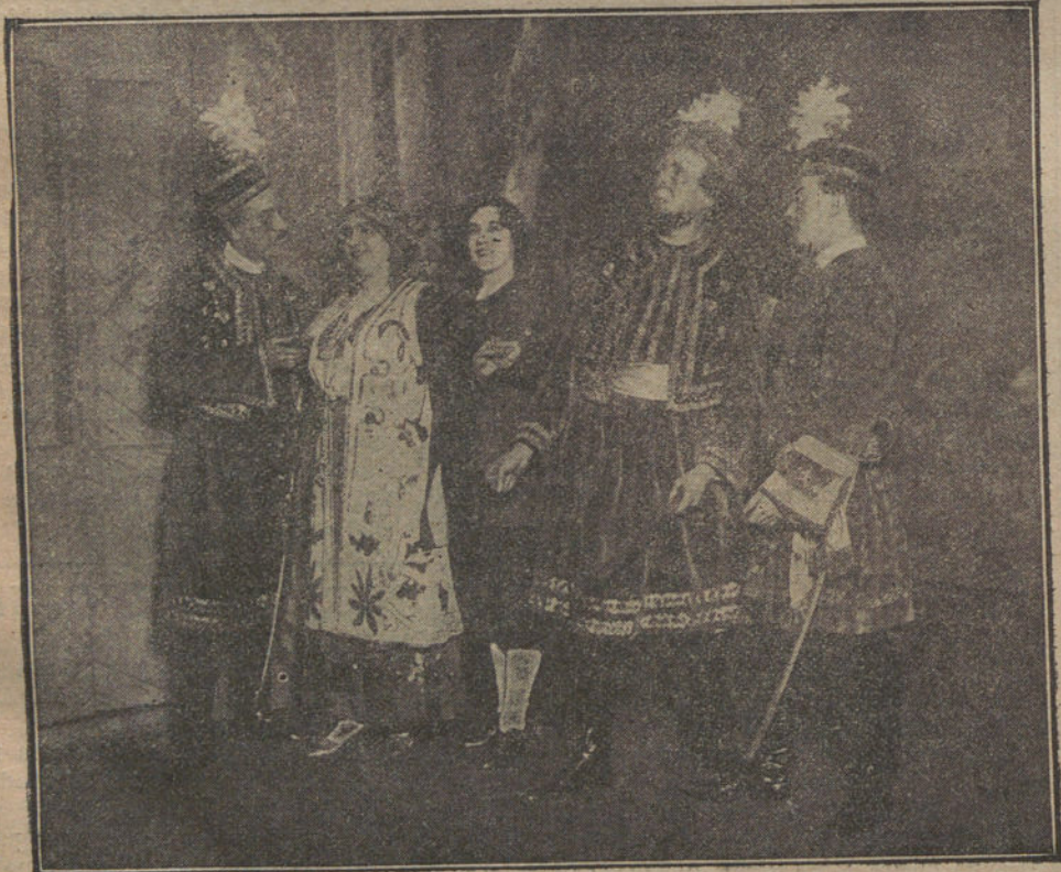
Escena final de la opereta «Alina», original del periodista Sr. Dalmases Gil, estrenada cop extraordinario éxito en el teatro Nuevo de Barcelona.