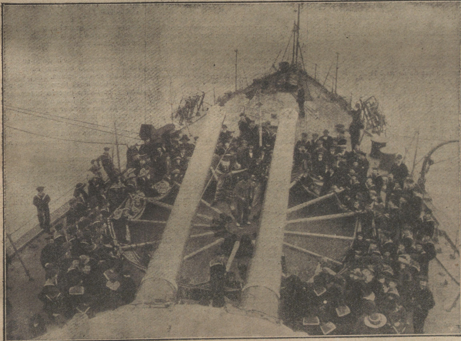
EL GRANAVAL EN EL MAR.—También a bordo de los buques de guerra halla la marinería solaz y recreo en estos alegres días de carnestolendas. Bajo los ensunchados tubos de los cañones de proa han organizado un ahimado «Tío vivo»; para ello han enchufado los largueros en las mortajas del cabrestante elevador del ancla; en las cabezas de los largueros descansan las hamacas. Gira el cabrestante, y sobre los radios girantes se sostienen, en acrobático equilibrio, varios enmascarados marineros

castizo refrán que dice: «Dios los crea y ellos se juntan».