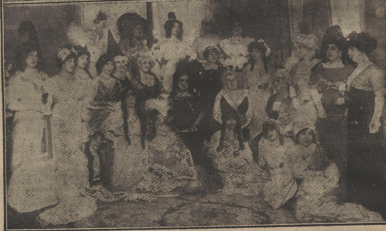
Del baile de cabezas celebrado en casa de la marquesa de Amboage