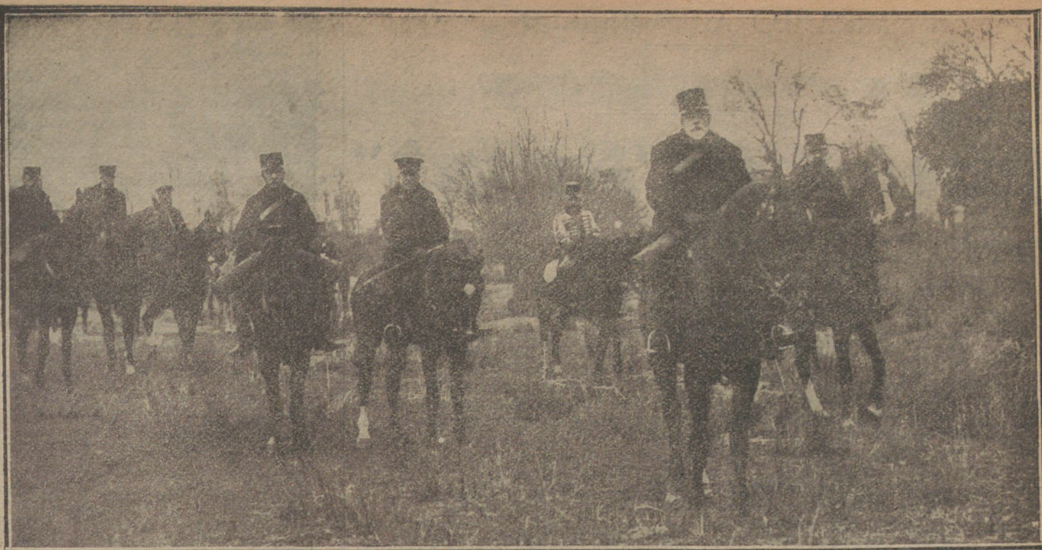
El general Marina y su Estado Mayor presenciando el desfile de los nuevos regimientos de Ingenieros.

La primera condición de un específico debe ser la amenidad. Al mismo tiempo conviene que el específico sea un poco teatral. Yo tomaba en Madrid un preparado de fósforos que me proporcionaba grandes éxitos en la casa de huéspedes. A la hora de comer, echaba unas gotas en un vaso de vino, y del vaso de vino brotaba inmediatamente una llama fantástica. Mis compañeros de mesa coadyuvaban al buen resultado de la medicina haciendo sonar las cucharillas sobre los platos. Algunas noches, a la hora en que yo me tomaba mi específico, los otros huéspedes de la casa apagaban la luz, y la escena resultaba «feérica». Específico como aquél, creo que no volveré a tomar otro en mi vida. Ya habrán ustedes adivinado que era un específico francés. Sólo esa genial farmacopea francesa puede producir un específico semejante. En él todo estaba maravillosamente combinado, hasta las horas de tomarlo. Yo estoy completamente seguro de que, si el autor del específico aconsejaba que se tomase a las horas de comer, era para asegurarse cierto público al enfermo.