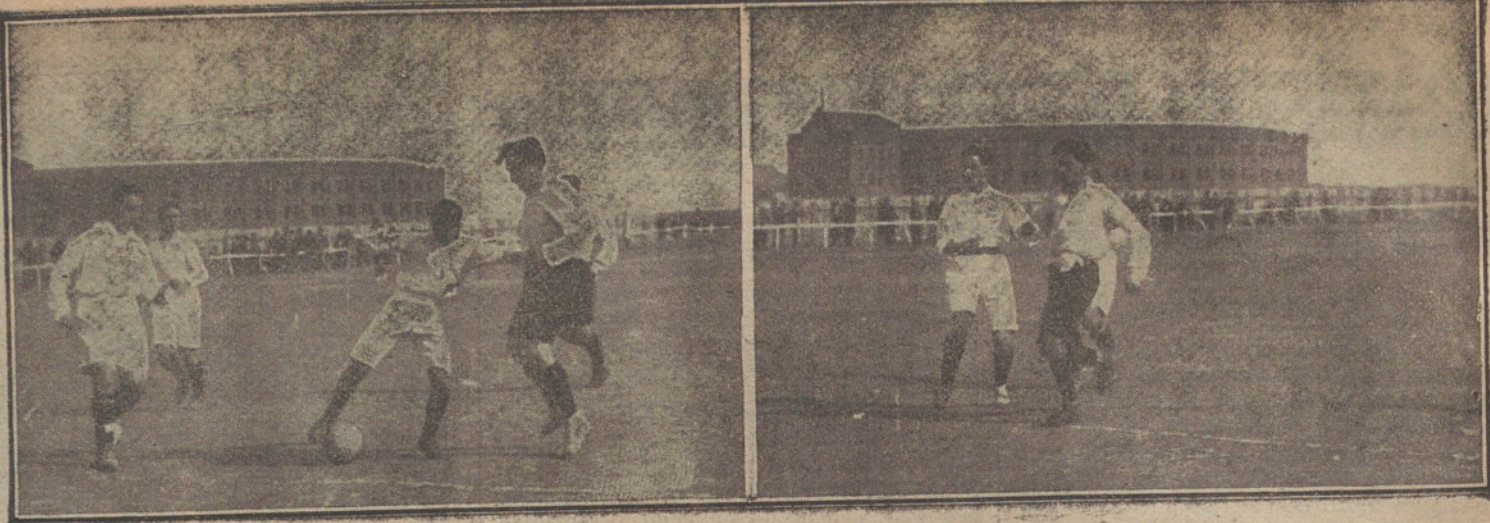
Momentos interesantes del partido de «foot-ball», jugado esta mañana por los equipos del «Madrid».