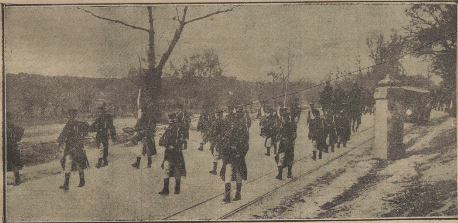
Desfile del regimiento de Ferrocarriles, en columna de honor, ante el capitán general.

Comunican de Podgoritza que el rey Nicolás de Montenegro ordenó esta mañana