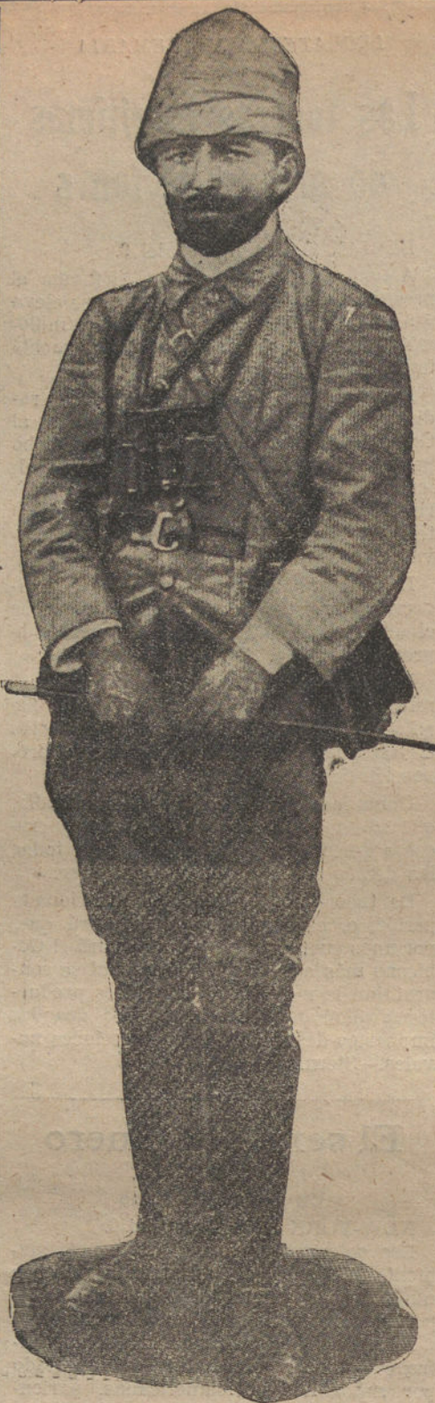
ENVER BEY, el célebre general turco, ha salido al frente de tropas escogidas, cuyo destino se desconoce. Nuestro grabado representa al popular general otomano con el uniforme que usaba en la Tripolitania, donde dirigió importantes combates contra las fuerzas del rey Víctor Manuel

En breve aparecerá el primer cupón para el regalo de los cien abonos a los toros que hace LA TRIBUNA a sus lectores