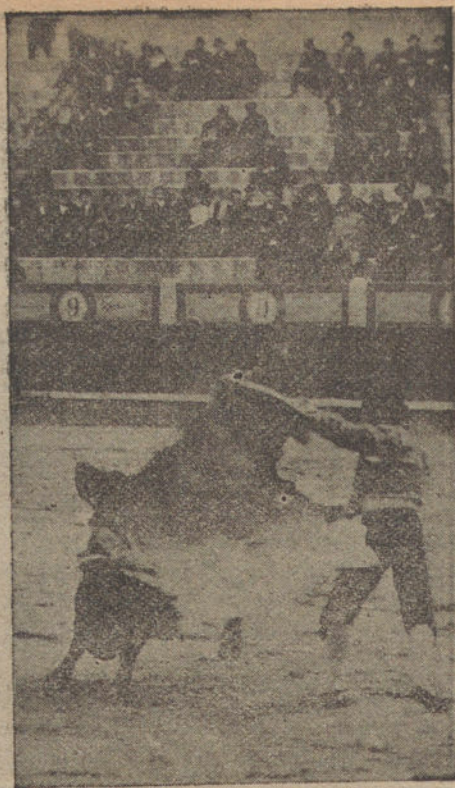
El que ha quedado, como el catarro

Intenta tres veces el descabello y acierta (Música desagradable.)