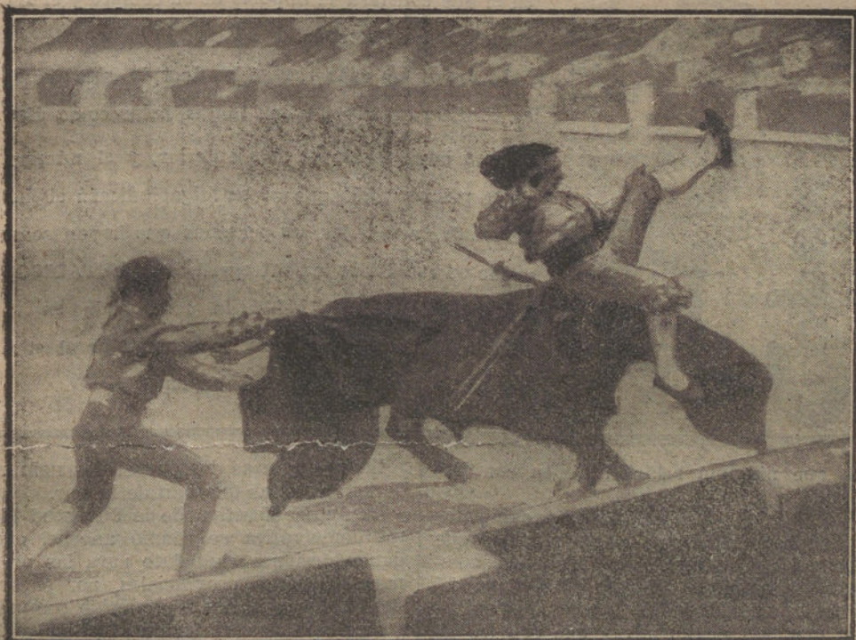
DE LA NOVILLADA DE AYER.—El toro «Navarro», lidiado en cuarto lugar, coge á Conejito III.

Por la gracia general de 1868 alcanzó el grado de alférez de Ejército.