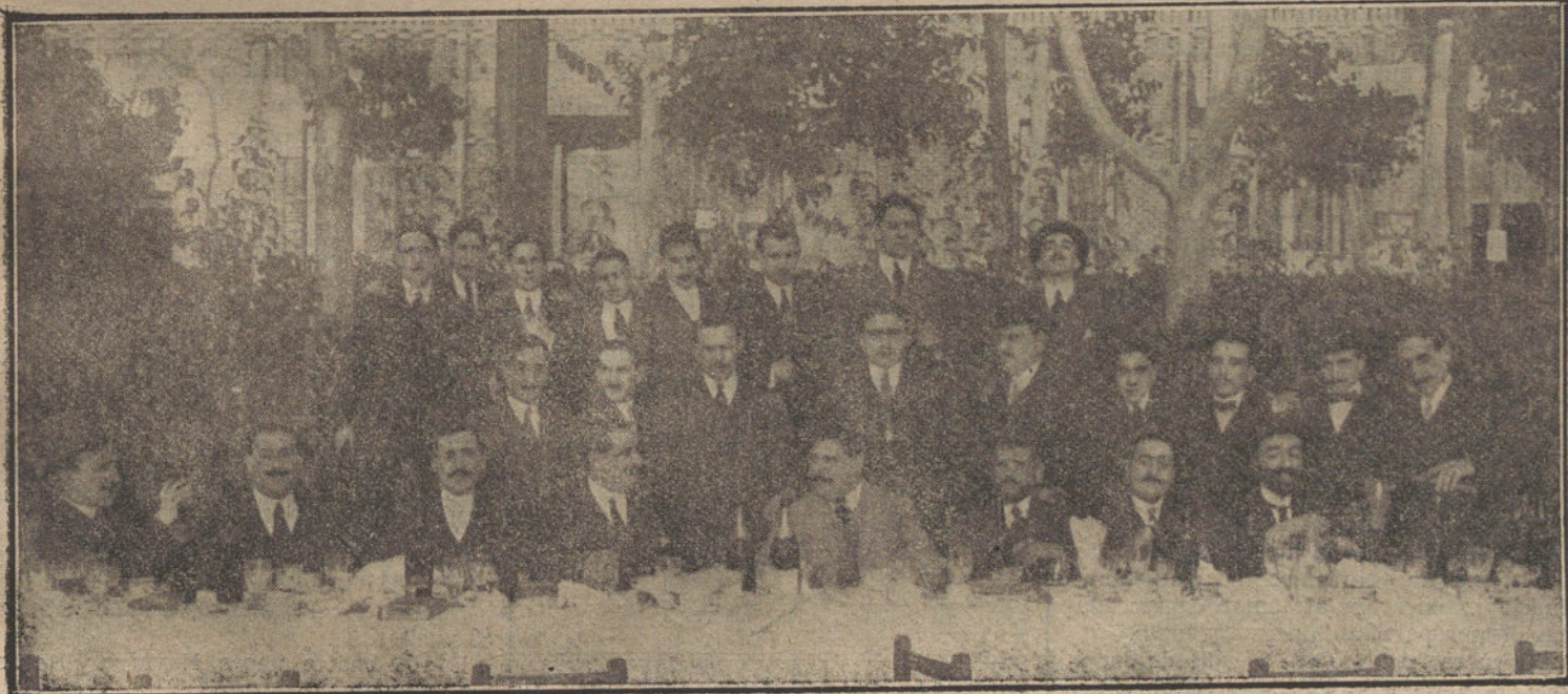
Banquete celebrado en «La Huerta» por los alumnos aprobados en Correos, de la Academia Pacheco.

Siempre a reserva de que el conde de Romanones no quiera aceptar la presidencia.