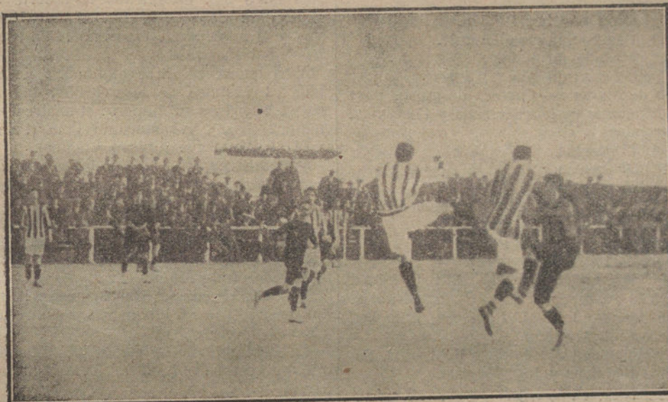
Momento interesante del partido jugado ayer entre los primeros equipos del «Athletic», de Bilbao, y «Español», de Madrid

«Igualmente, mediante un portavoz, ordena el piloto al mecánico las diversas velocidades a que debe marchar el motor; le da las órdenes para embragar o desembragar la hélice, y, por consiguiente, de poner en marcha o detener el navío aéreo.