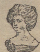
Madrón, Gira 1 a los 6 años

LA MUJER recobra y conserva la pureza del cutis, desapareciendo las pecas, patas de gallo, arrugas, espinillas, manchas y barros, aplicándose cáscara de huevo, igual á la muestra, que con el procedimiento para prepararla se entrega por 25 céntimos en las principales perfumerías de España. Depositarios: Pérez, Martín y Compañía, y Martín y Durán, Madrid.