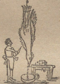
PAVO Y TURRON, por Jerónimo García

Todos los juguetes del concurso infantil están adquiridos en el Bazar X Calle Espoz y Mina