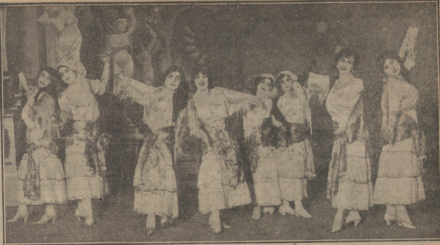
«LA RUMBA», escena final del último cuadro de «S. M. el Cupón», zarzuela de espectáculo que se estrena esta noche en el teatro de la Gran Vía.

Bromas á un lado, y aunque en el cartel notamos la falta de otros nombres que, como el de Hermosilla, Pepe-Hillo, Conejito y Lagartijillo, es extraño, dado el amplio y protector criterio de la Empresa, que