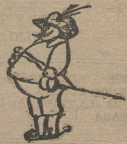
MI TIO, por José Huerta (siete años)