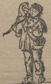
EL TIO DEL MONO, por Julián Hurtado (trece años)