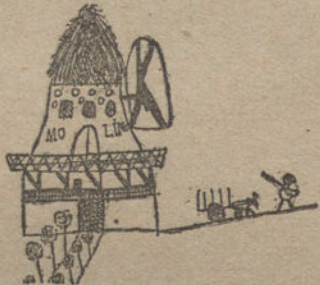
UN MOLINO, por Pepito Piquer (ocho años)