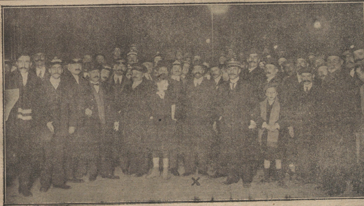
El presidente de la Asociación General de Ferrocarriles (X) rodeado de todo el personal de la estación que acoge y despidió al Sr. Alcalá Zamora

También se espera al «Victoria Luisa», hallándose entonces en nuestra bahía los cuatro buques escuela de cadetes de Marina que tiene Alemania.