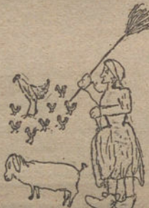
MI ABUELA EN EL CORRAL, por Víctor Cuadrado (doce años)