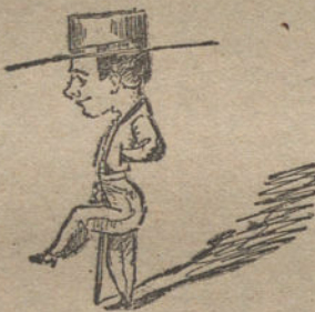
EL MOJAMIN GRANDE, por Luis Carras-cosa (diez años)

Todos los juguetes del concurso infantil están adquiridos en el Bazar X Calle Espoz y Mina