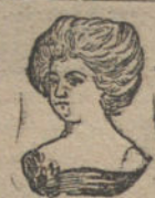
Madame Gira a los 65 años

LA MUJER recobra y conserva la pureza del cutis, desapareciendo las pecas, patas de gallo, arrugas, espinillas, manchas y barros, aplicándose cáscara de huevo, igual a la muestra, que con el procedimiento para prepararla se entrega por 25 céntimos en las principales perfumerías de España. Depositarios: Pérez, Martín y Compañía, y Martín y Durán, Madrid.