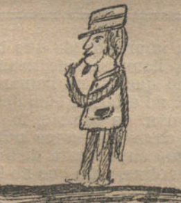
EL JEFE DE LA ESTACION DE MI PUEBLO, por Vicente Pérez Estévez (siete años)