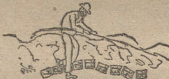
MI PAPA SUBIENDO LA CUESTA DE ENERO, por Antonio Grosso (diez años)