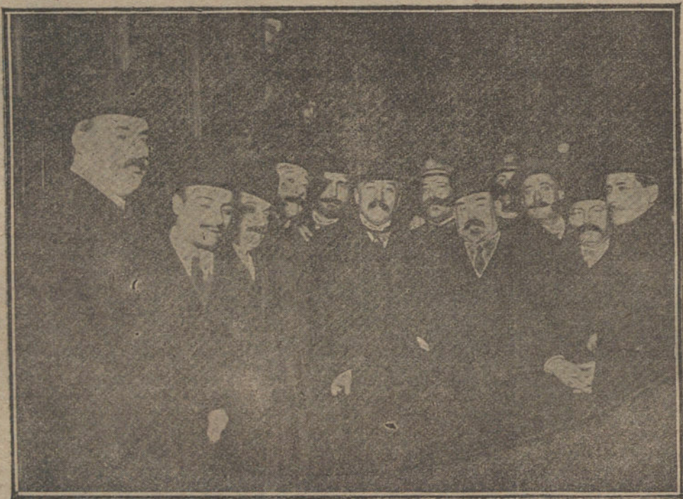
LOS SRES. ALCALA ZAMORA, RABOSO, ROMERO CIVANTOS y otros diputados, salieron anoche para Cádiz con objeto de asistir, en nombre del Gobierno, á los funerales que en aquella capital se han de celebrar en sufragio del Sr. Moret y tomar parte el Sr. Alcalá Zamora en la velada nerológica en honor del ilustre ex presidente.—A la estación, acudieron á despedir á los viajeros muchos diputados, Comités de distrito y gran número de ferroviarios, que felicitaron al Sr. Alcalá Zamora por haber sido nombrado socio honorario de su Asociación.