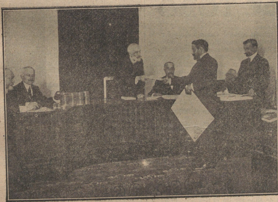
BARCELONA.—En la Casa de América, reparto de medallas y diplomas á los artistas é industriales que más se distinguieron en la Exposición de Méjico.