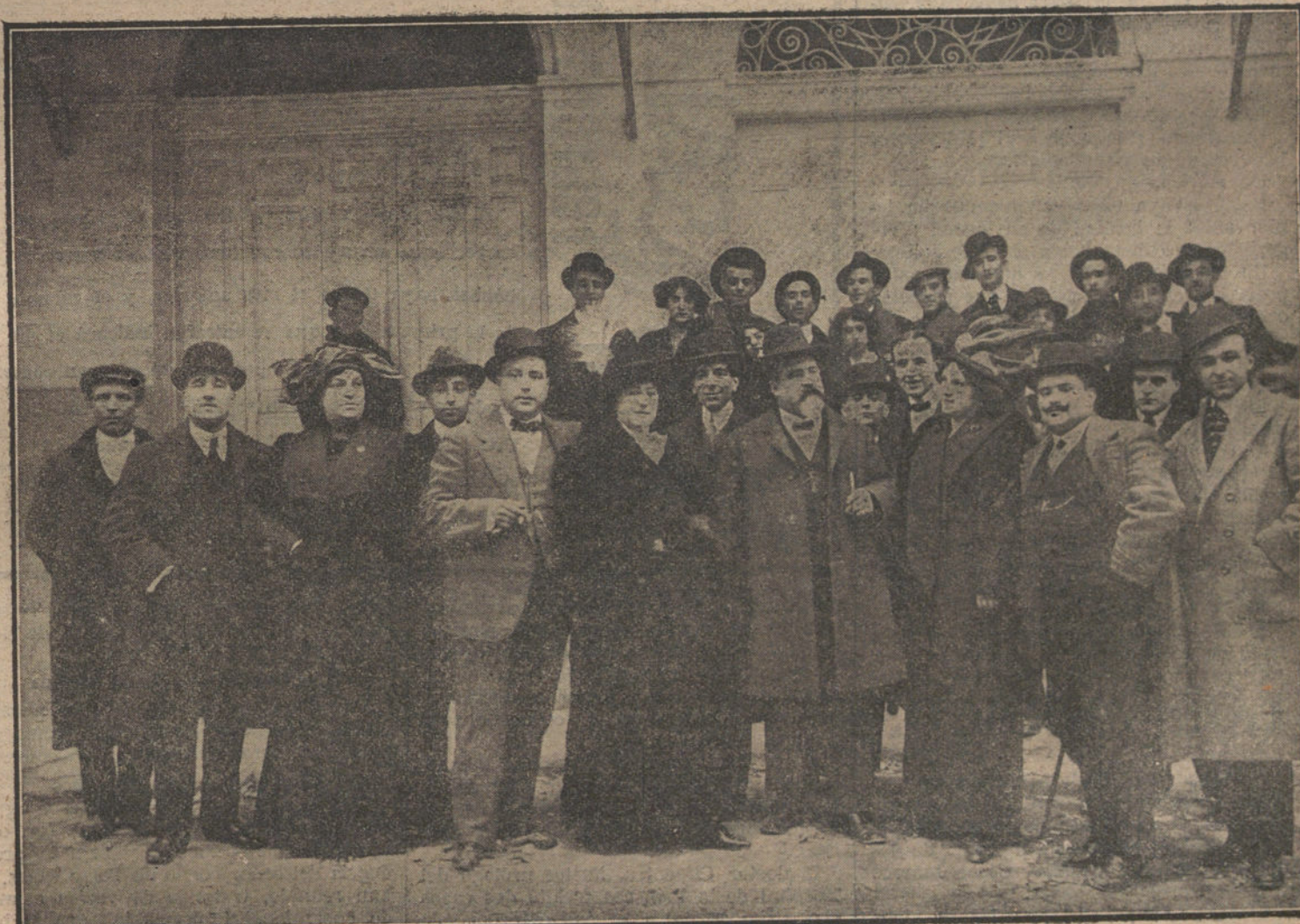
LA APERTURA DE LA ZARZUELA. —Con las obras «El rey que rabió» y «Las dos princesas», de Chapí y Caballero, se inaugura el viernes el lindo y madrileño teatro de la Zarzuela. Los artistas ya están cantando algunos números de «Las dos princesas», sus intérpretes rodean al director que graba la bella partitura. En este instante les sorprende la máquina fotográfica de Rodríguez os sonríe...