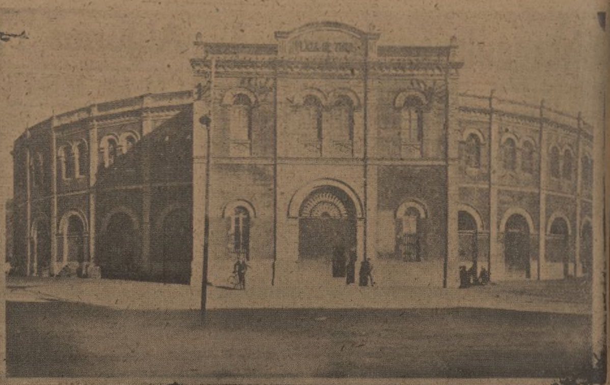
Vista del exterior de nuestra plaza de toros, cuyo derribo solicitaron sus propietarios: decisión que ha dado lugar a artículos periodísticos y a sueltos comentarios en la Prensa de España