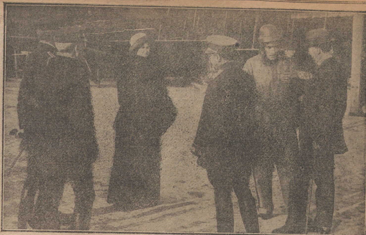
La infanta doña Beatriz y el infante D. Alfonso al llegar ayer tarde al aeródromo de Cuatro Vientos

Dice que se trata de una simple competencia entre intereses particulares, y afirma que los pescadores nunca han sido perjudicados, ignorando la intención que persiguen los interesados en que se grave la introducción, cuando el verdadero patriotismo aconseja que no se diferencien en nada los buques pesqueros nacionales y extranjeros, pues esto ocasionaría la ruina del archipiélago, porque daría lugar á un recíproco gravamen de nuestros frutos en los puertos extranjeros.