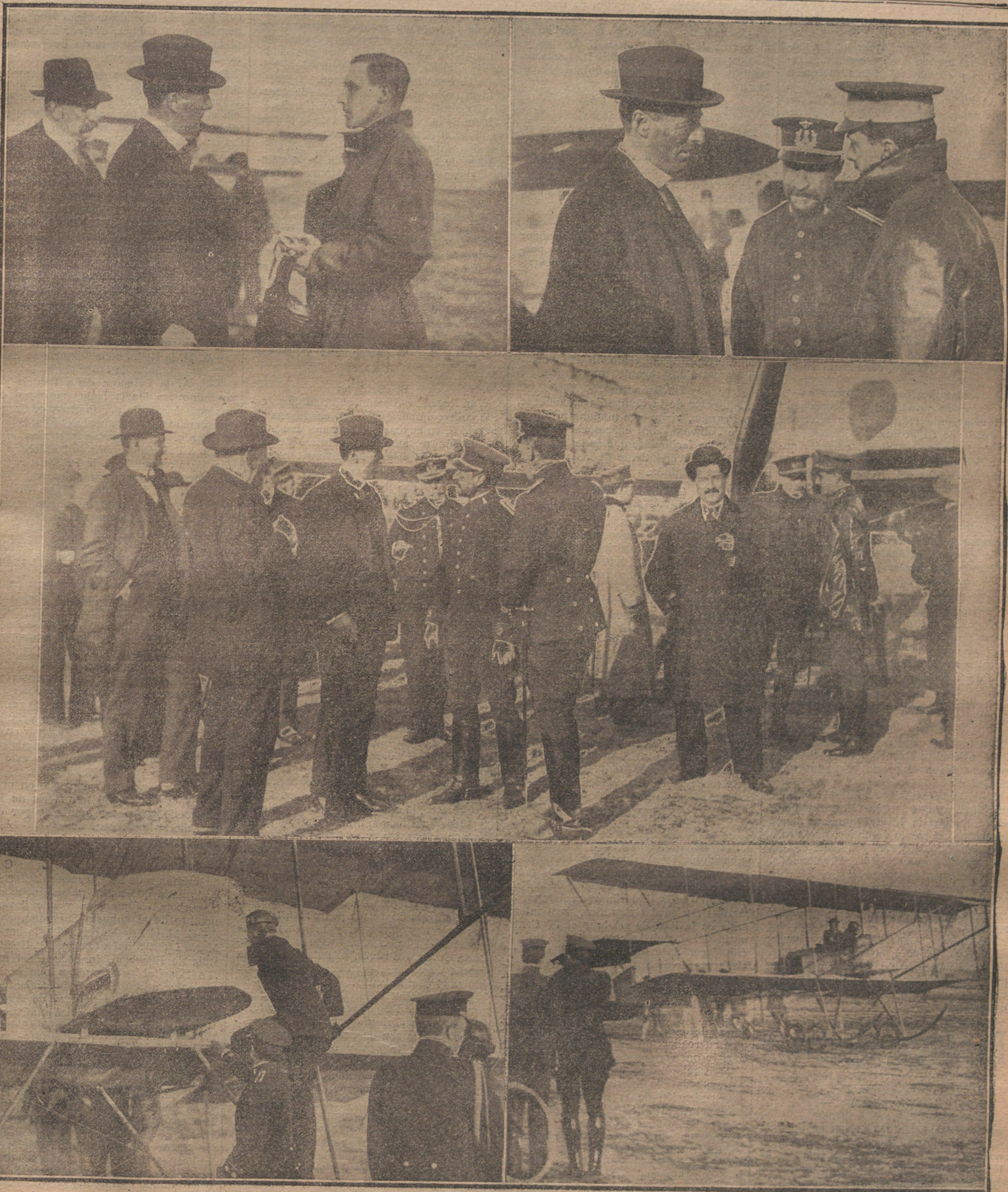
El ministro Secly hablando con el aviador, Infante D. Alfonso. El ministro inglés con el coronel Vives y el capitán Bayo. El ministro inglés al llegar al aeródromo de Cuatro Vientos. Entre los concurrentes se ve a nuestro director, Sr. Cánovas Gervantes, que acudió ayer a Cuatro Vientos. Mr. Secly, ayudado á montar en el aeroplano por el coronel Vives. El ministro Secly, al remontarse el aeroplano que lo elevó sobre Madrid.