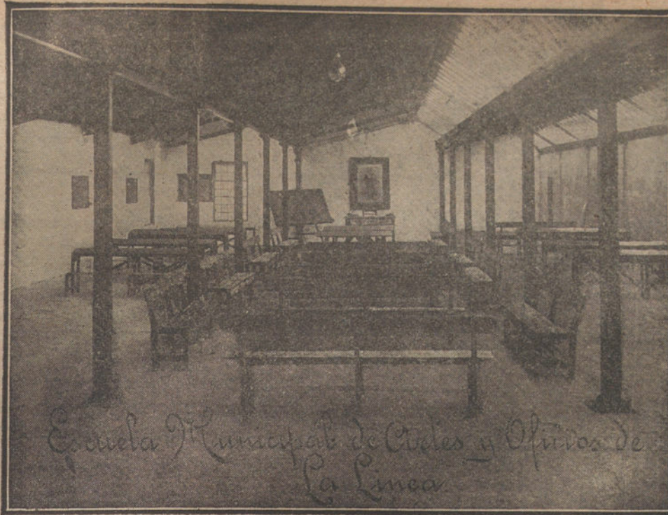
La nueva escuela municipal inaugurada hace pocos días en La Línea de la Concepción

Cuando, hace dos años, el ilustre Altamira estuvo en La Línea de la Concepción, acompañado del diputado del distrito, en alta visita de inspección escolar, que éste había solicitado, confesó, noble y espontáneamente, que constituía una vergüenza nacional que, lindando con una tierra extranjera, existiese una población como La Línea, con más de cuarenta mil almas, en su mayoría obreros y gente necesitada, y que sólo hubiera «cinco escuelas oficiales».