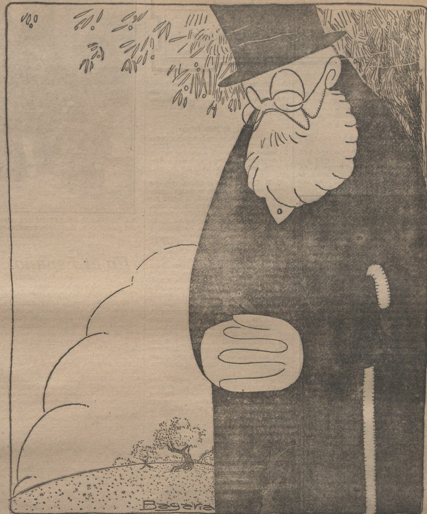
EL HOMBRE DE CIENCIA: Aumentos en los ejércitos, guerras, alianzas defensivas... ¿Y para esto me hepasado yo tantos años descubriendo mi suero vivificador? ¡Qué poco agradecidos son los hombres!

Después de enterado del informe de la Comisión de asuntos extranjeros de la Cámara de los diputados, relativo á la adjudicación de los trabajos del puerto de Casablanca, M. Tonnart manifestó al Gobier-