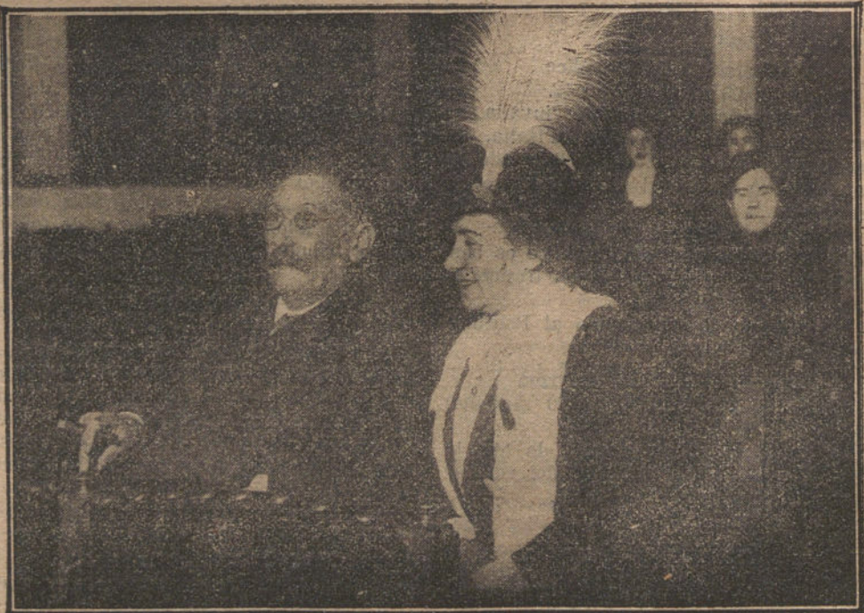
Sofia Casanova, acompañada de D. Benito Pérez Galdós, en la sala del Español, presenciando el ensayo general de «La madeja».