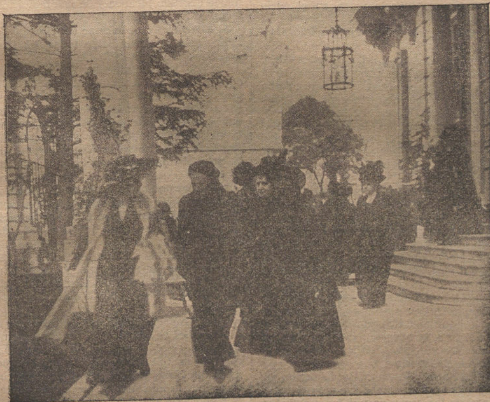
Señoras de la Junta de damas católicas, saliendo de casa del conde de Romanones después de entregarle el mensaje-protesta contra los proyectos del Gobierno sobre la enseñanza del Catecismo en las escuelas.

¡FIJARSE BIEN! «LA TRIBUNA» CUMPLE CON EXCESO SUS PROMESAS ANUNCIO CIENT ABONOS A LOS TOROS Y DARA DOSCIENTOS