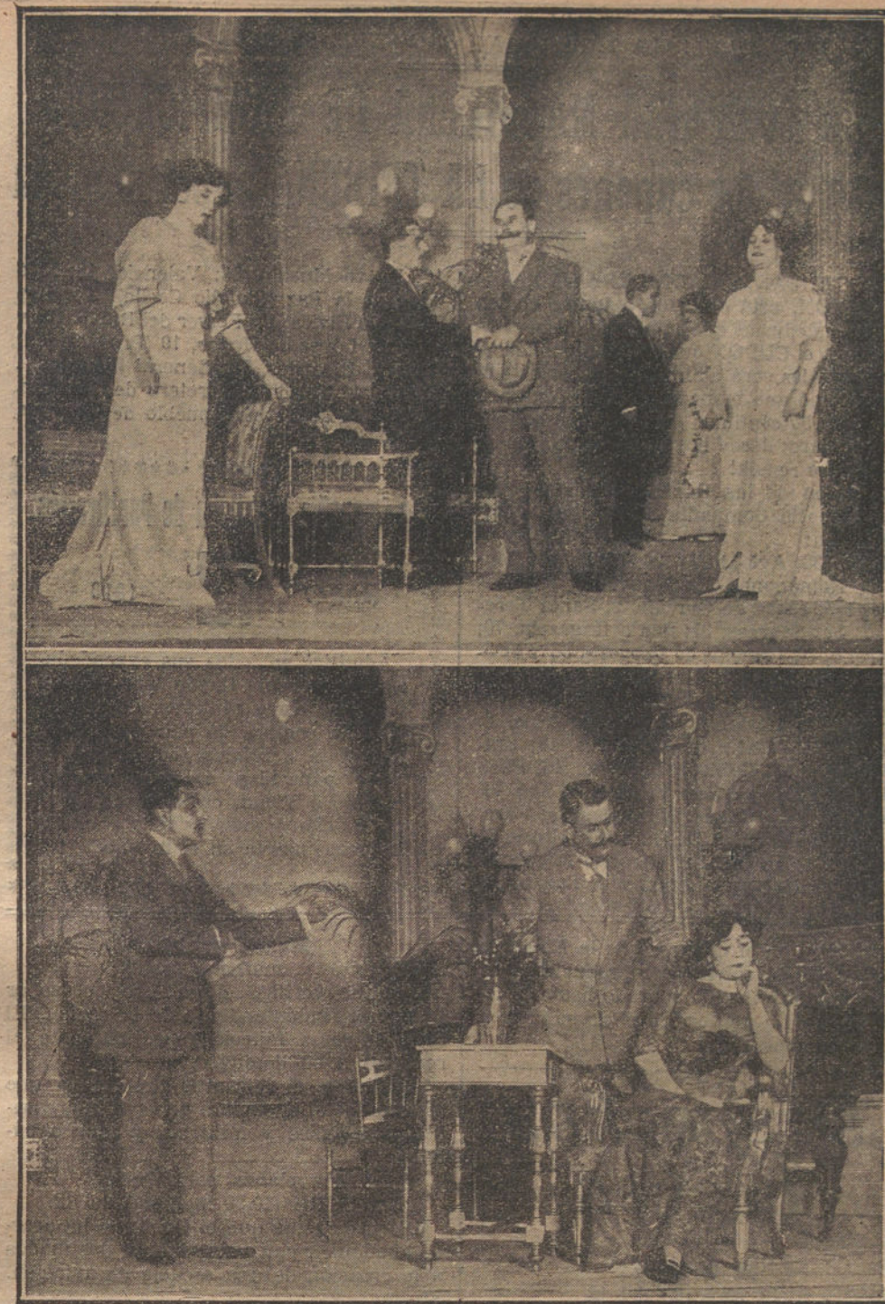
Escenas de «La Madeja», obra de doña So fia Casanova, estrenada ayer en el Teatro Español

sanova, yo sonreía interiormente con la sonrisa del hombre que sabe donde vive. Yo he conocido en Madrid, en París y en todas partes admirables improvisadores de la vida que obtienen siempre lo que se proponen, que hacen dinero, que enamoran mujeres y que triunfan de cualesquiera obstáculos que se les pongan por delante; hombres de prensa, animales de dominio, seres organizados para vencer constantemente donde quiera que estén. Donde quiera que estén, menos en Londres. A veces, cuando alguien me dice, comentando las hazañas de alguno de estos hombres, que no hay obstáculo para él, yo pregunto si «El» ha vivido en Londres, porque Londres es más fuerte que todo. Se puede vivir por procedimientos de excepción hasta en el Polo Sur, pero en Londres no. En Londres no vale el ser un César ni un Don Juan. Aquí hay que adquirir un «office» en la City, tomar una dactilografía y meterse en «business» o buscarse un empleo y resignarse a ganar tres ó cuatro libras semanales. Esto ó la muerte, por inanición.