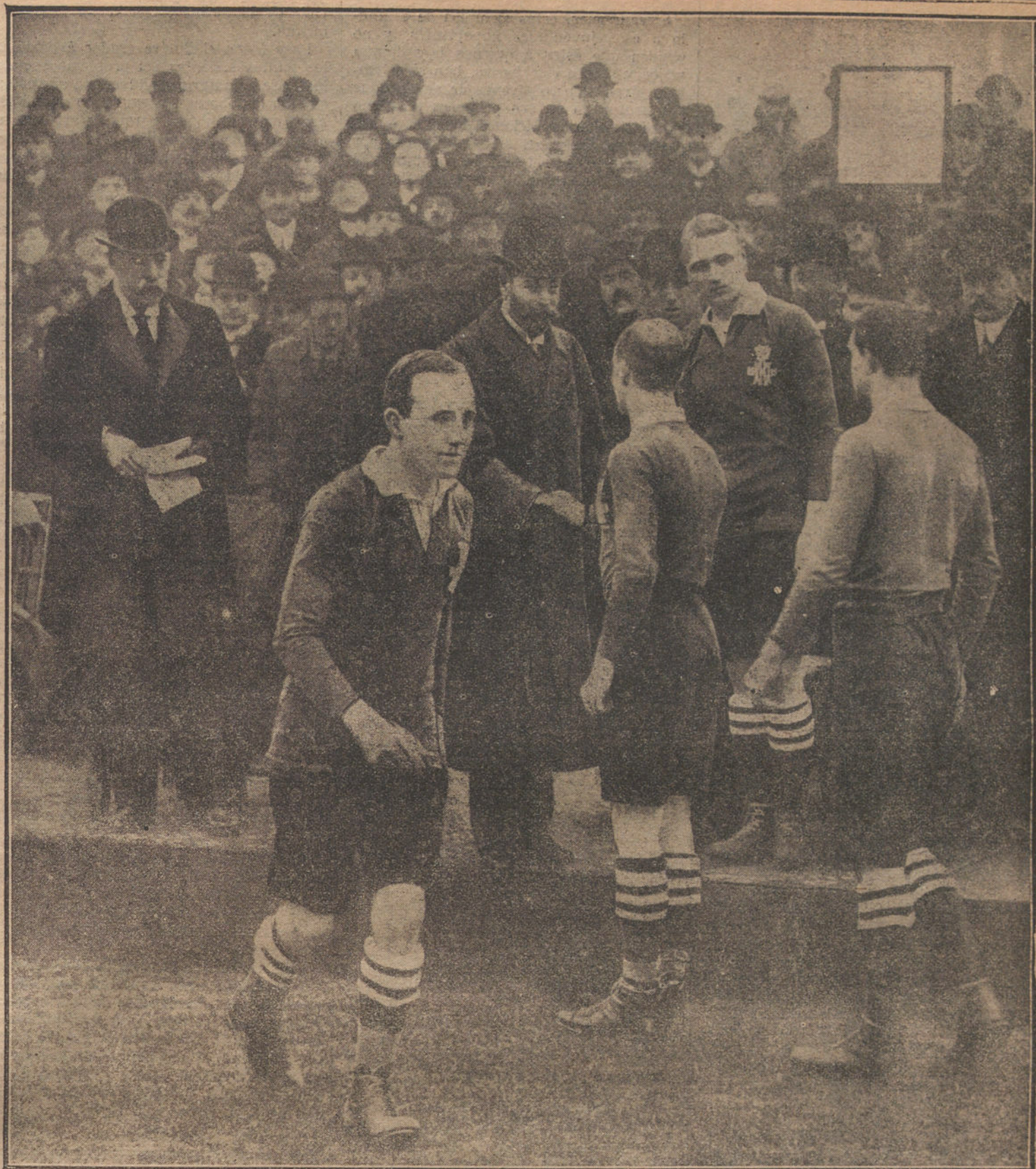
El rey de Inglaterra felicitando á varios oficiales de la Armada británica que acaban de jugar un interesante partido de «foot-ball»