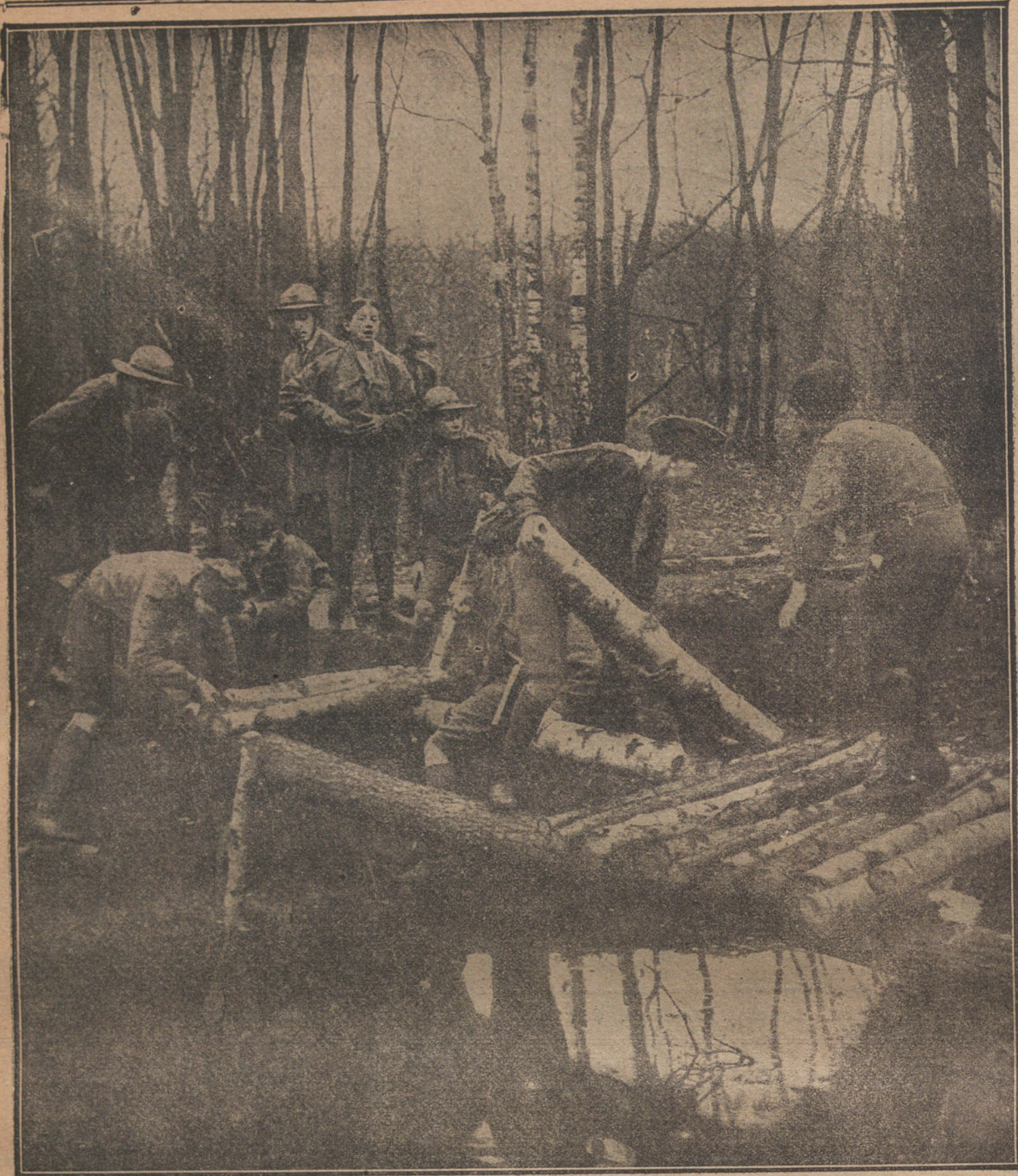
LOS EXPLORADORES FRANCESES.—Grupo de «boy scouts» tendiendo un puente rústico sobre una torrentera