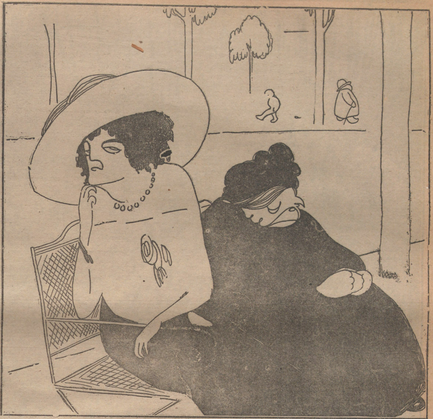
La doctrina, obligatoria... El ser vicio, obligatorio... ¿Y el matrimonio, cuándo? (Caricatura BAGARIA.)