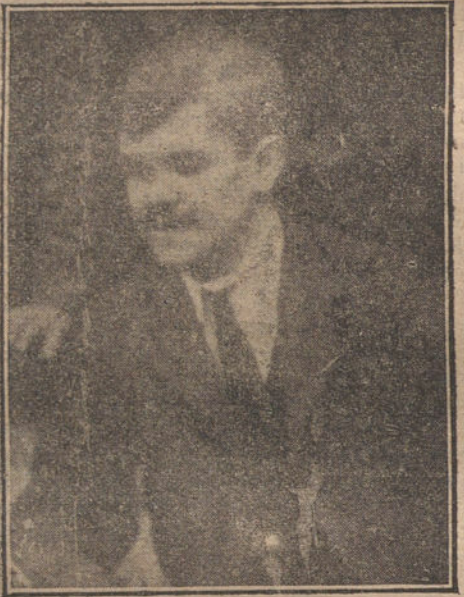
El esposo ofendido, mudo también

A partir de este día, la tragedia sorda,