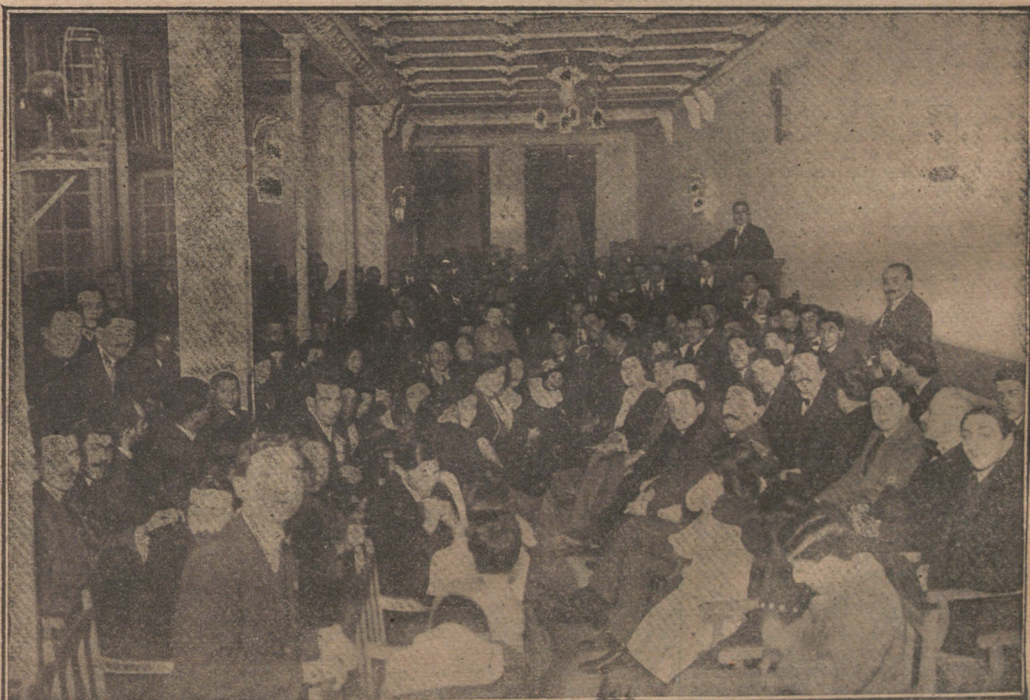
Mitin en el Centro jaimista, contra los proyectos del Gobierno, sobre la enseñanza del Catecismo. (Fto. VIDAL).