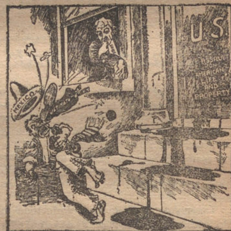
El «ultimátum» del Gobierno arrojado a la cabeza de la República