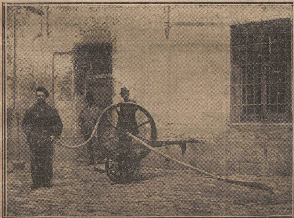
MADRID. —Los nuevos aparatos adquiridos por el Ayuntamiento para regar la villa y corte.