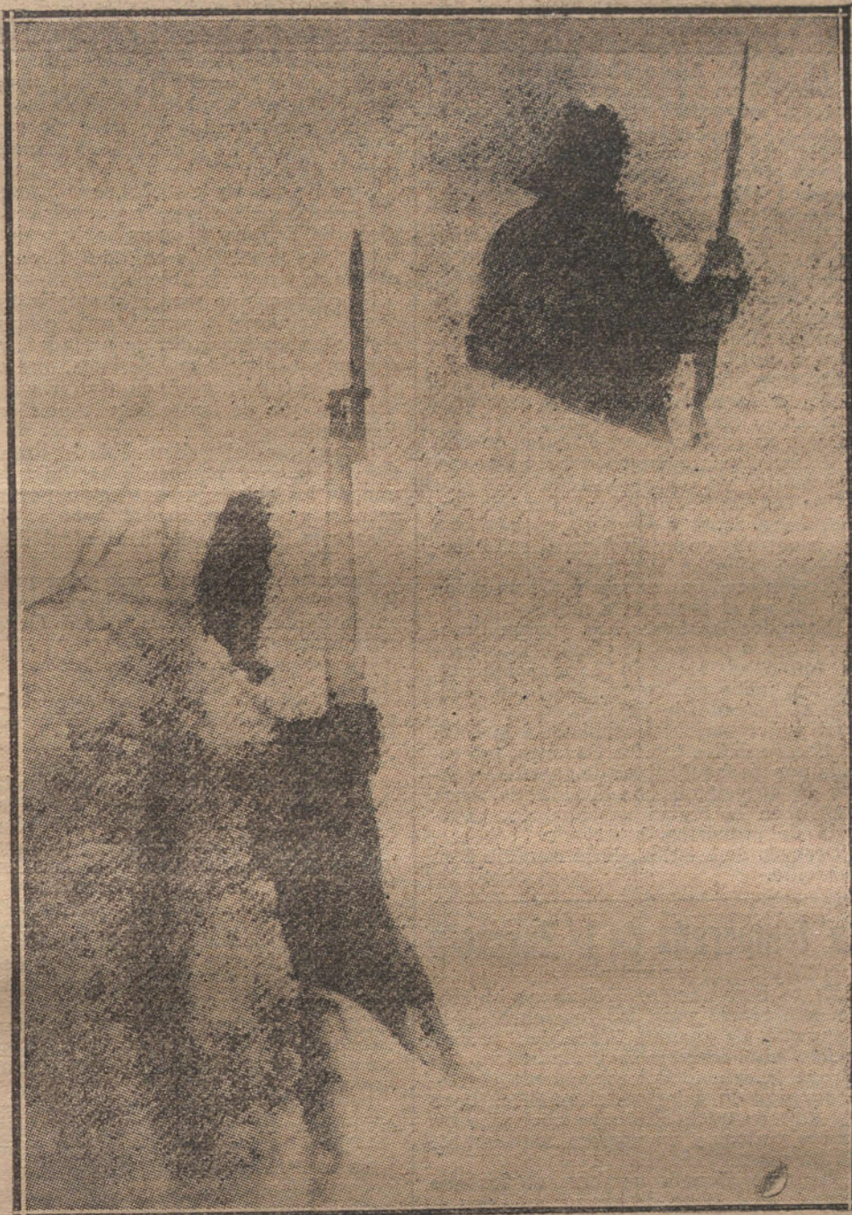
LA GUERRA BALKANICA.—D os centinelas cubiertos de nieve.

Expuso luego su creencia de que no espera ser sorprendido por acontecimientos políticos durante su ausencia, y que caso de que aquellos lleguen á registrarse, será por la época de la caída de la hoja.