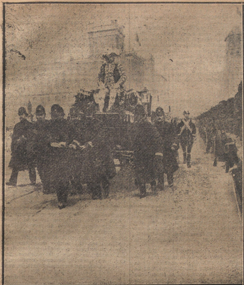
TRACCION DE SANGRE HUMANA. —El coche del embajador de Alemania en Londres, al dirigirse a Palacio a una ceremonia de Corte, se encontraba sin caballos. El Gobierno le facilitó unos cuantos «policemans», que tiran del coche hasta su destino.