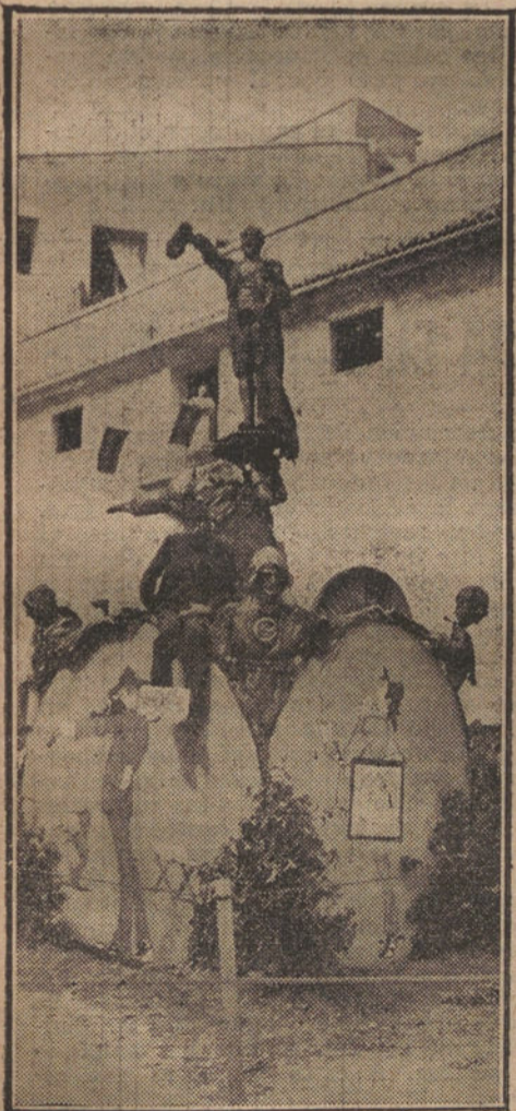
LAS «FALLAS» DE VALENCIA.—«Gloria a las Artes», grupo de artistas aplastados por el toro.

«LA TRIBUNA», QUE YA HA SORTEADO CIEN ABONOS A LOS TOROS, PUBLICA EL CUPON PARA REGALAR OTROS CIEN ABONOS.