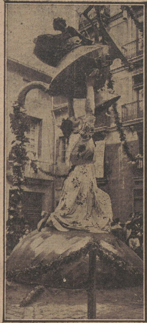
VALENCIA.—«Fallas» levantada en la plaza de San Bult. Una labradora sostiene en lo alto una tetera que vierte una lluvia de flores. Se titula «La taza de oro». Cuarto premio.

Iehosúa (Con voz pausada y melodiosa).—Yo soy el hijo de Dios, hecho hombre para morir por los hombres y redimirlos del pecado... Soy Iehosúa. Myriam (Al cabo de un instante de vacilación).—¡Oh Iehosúa!... Te he llamado con afán, porque te amo, y vienes a mí. ¿Me amas tú también?