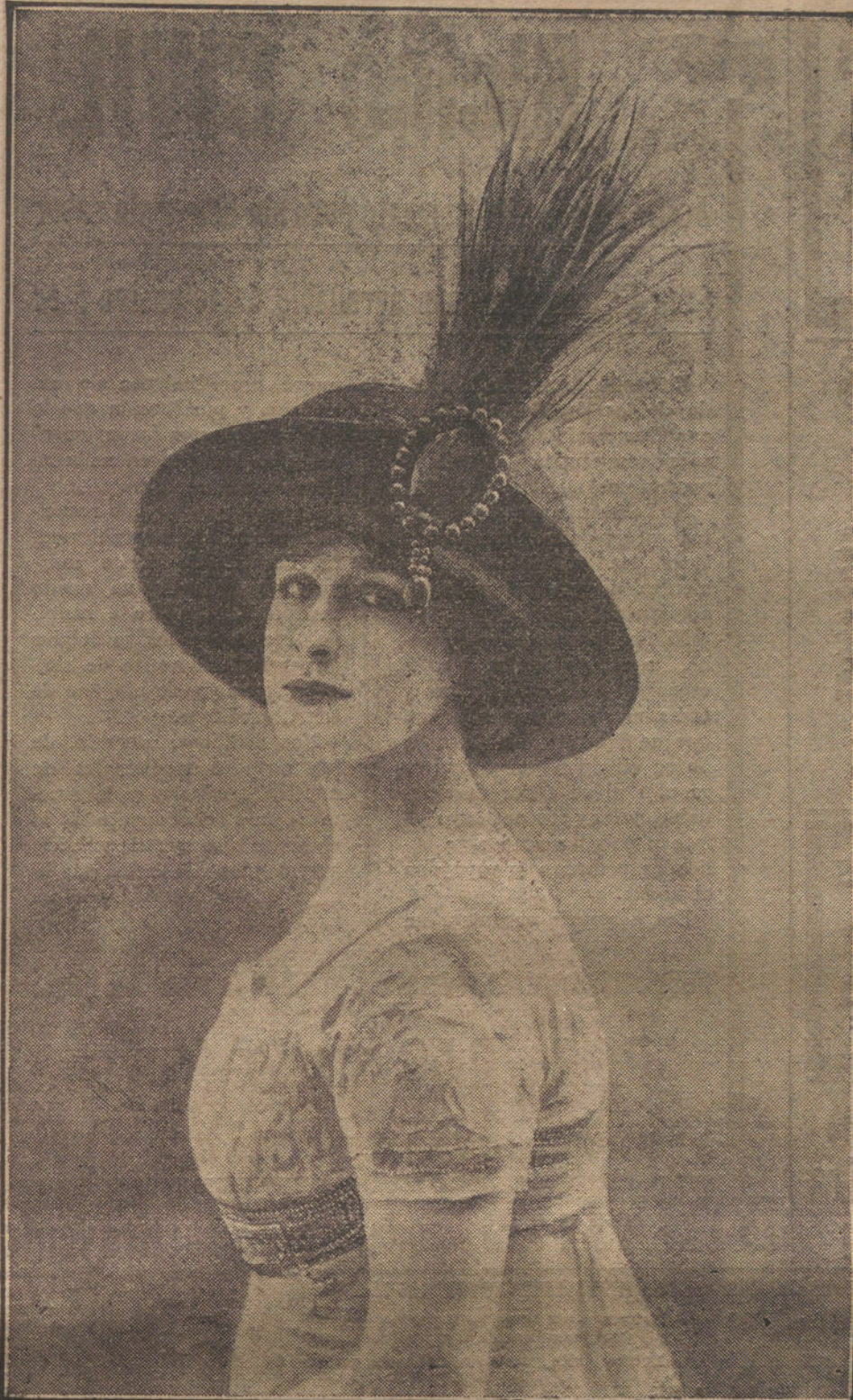
LA MODA FEMENINA.—Elegantísimo sombrero de primavera, creación de la casa Humbolt, de París.

Santa Isabel.—Por la tarde, a las siete, habrá sermón de Resurrección, después del rosario.