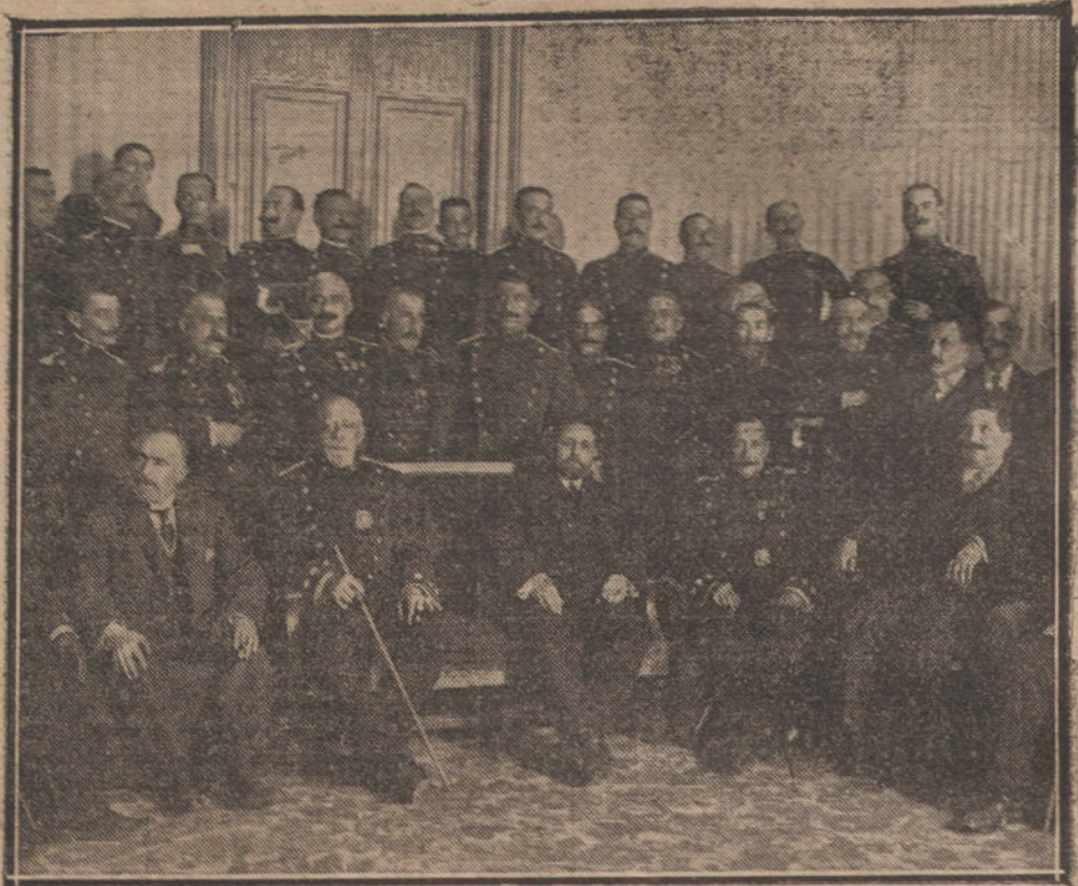
BARCELONA.—La Junta del Centro Aragonés y jefes y oficiales de la Guardia civil que concurrieron al festival celebrado al proclamar a la Virgen del Pilar Patrona de la Guardia civil.

Plazas de Salamanca, de la Villa y camino de la Dehesa de la Villa.