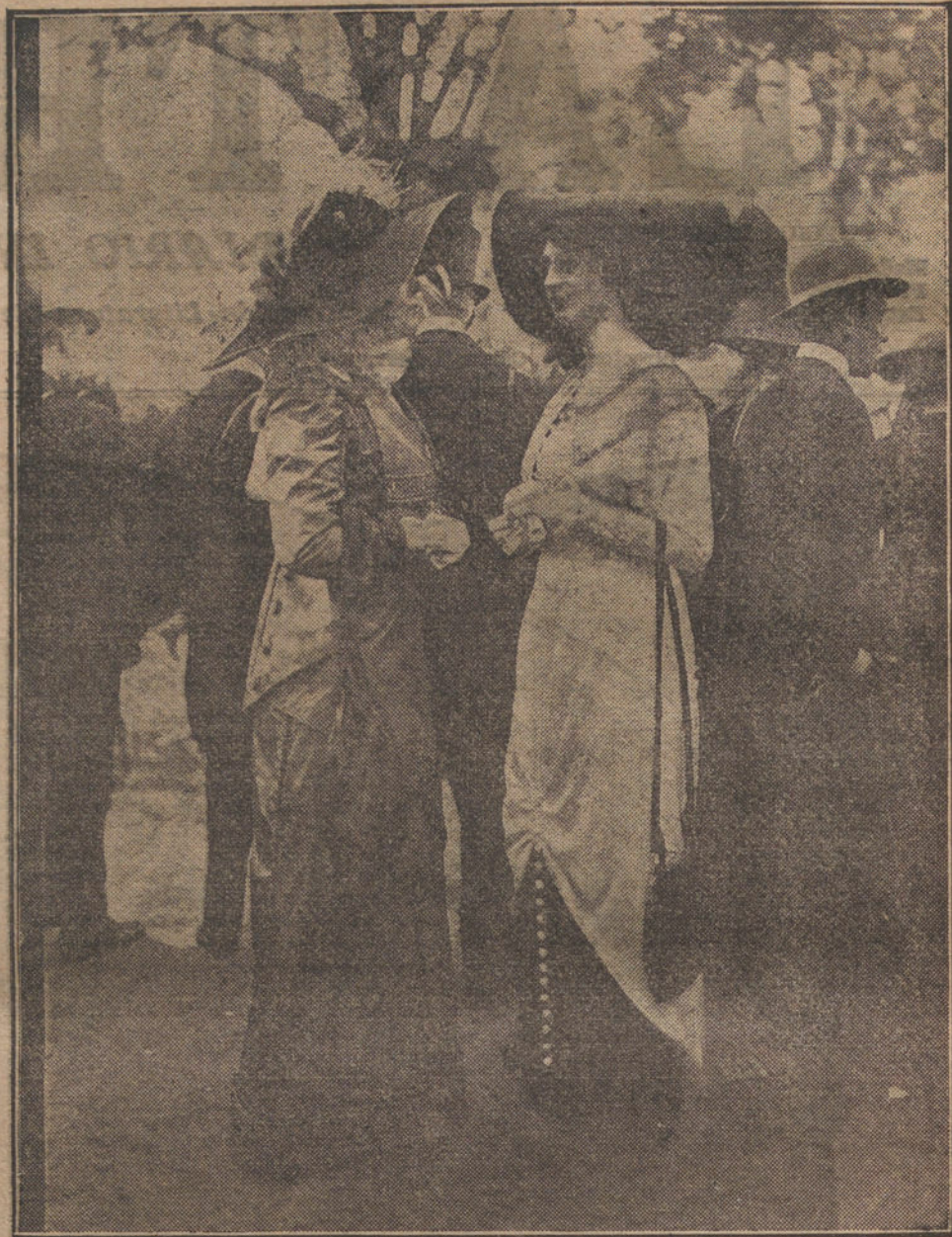
LA MODA FEMENINA.—«Toilettes», elegantísimas y de última creación, que han lucido dos bellas artistas francesas en las carreras de Auteil este mes.

Perspicaz y decidido, repele toda clase de ataques morales y materiales. Aviraneta triunfa de sus enemigos y sale de Laguardia, contando lo sucedido como vulgar aventura, sin trascendencia alguna.