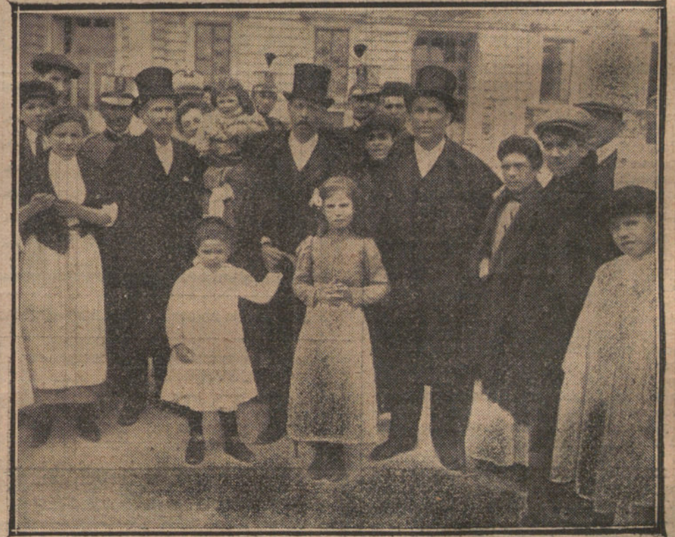
SEMANA SANTA EN MADRID.—Un grupo de pobres al salir de Palacio, después de las ceremonias de Jueves Santo.

¡Tú eres el que las gentes llaman Iehosúa y aclaman con jubilo los pueblos?