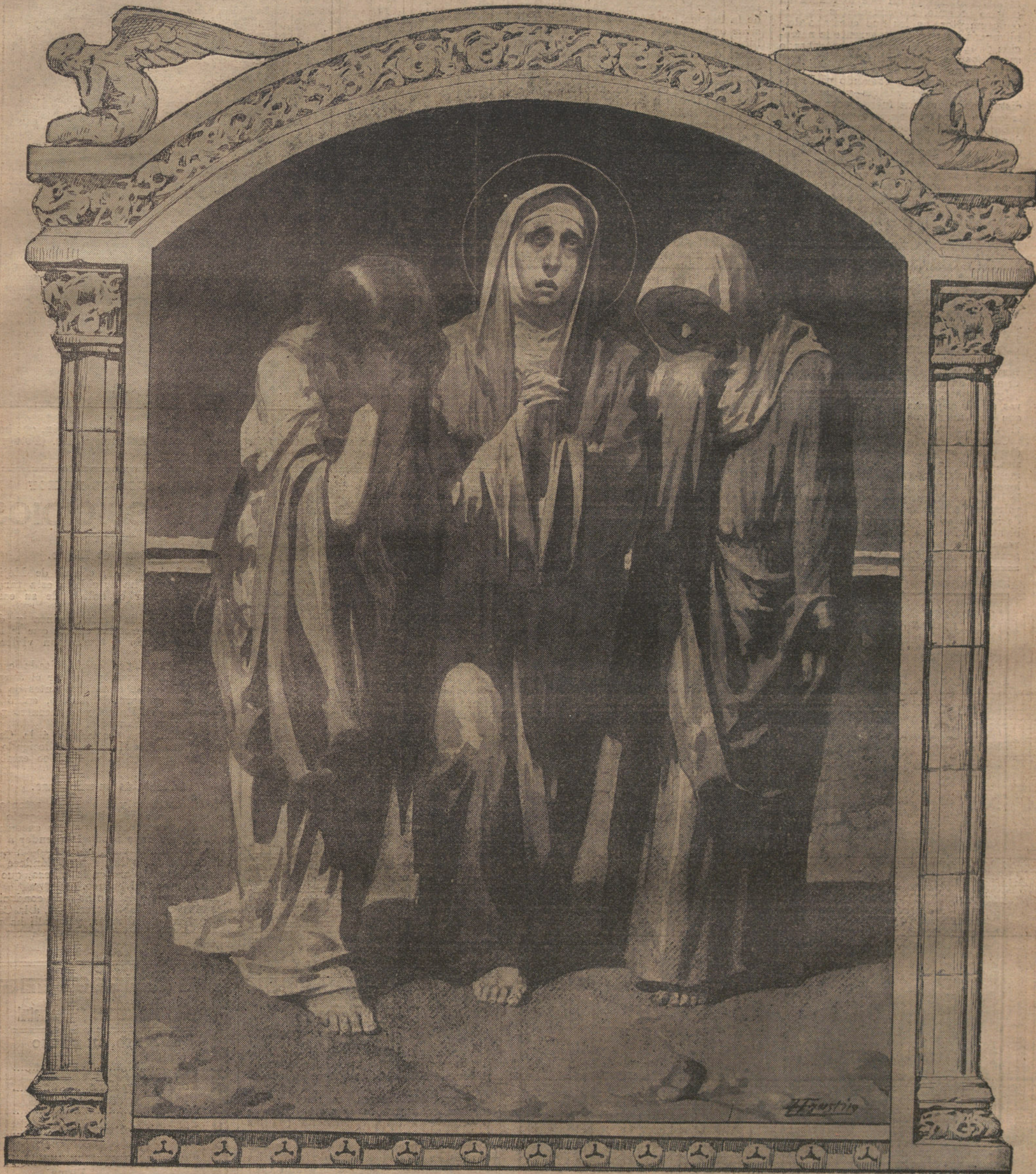
LAS SANTAS MUJERES.==(Dibujo de Agustin.)