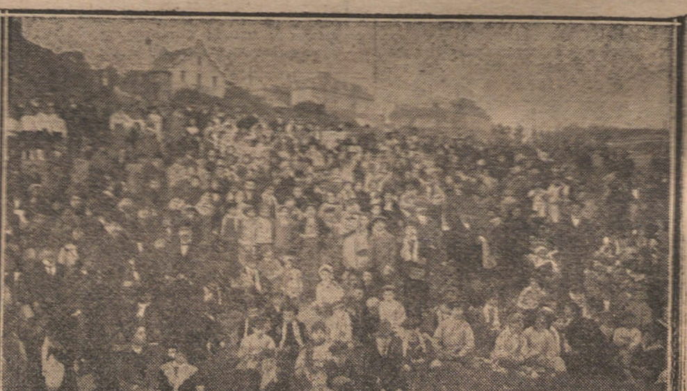
BOY SCOUTS.—Los exploradores españoles de Barcelona en la excursión en que se bendijeron las banderas y se impusieron las insignias.