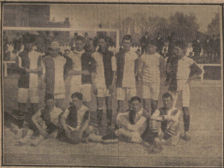
CAMPEONATO DE ESPAÑA.—Equipo del «Vigo F. C.», que fué vencido por uno a cero en un interesante partido jugando con el «España», de Barcelona, quedando eliminado.

(Prestan atención hasta el final del canto, y cuando éste hubo cesado alzáse un tapiz a la izquierda y entra un esclavo.)