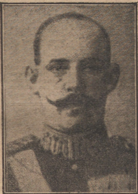
Constantino I, nuevo Rey de Grecia.